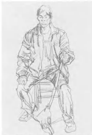
7 至此画面效果已基本呈现,有一定动态的速写要注意肢体动作的协调与节奏感,还要注意头、手、脚三者的内在联系及基本动态的传神表现。