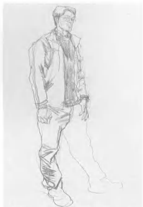
5. 画腿要注意其外部形态, 大腿与小腿的构成稍呈弯曲, 不可太过僵直, 脚与腿要同时画出。