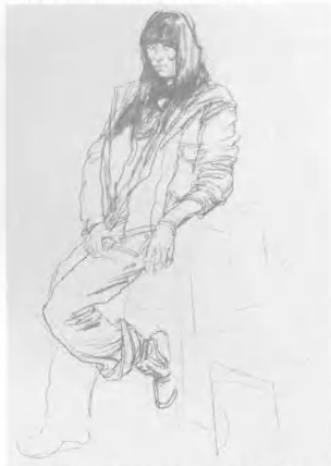
5. 接着画出下肢, 要强化肢体部分间的转动、穿插、屈伸、进退所造成的节奏之感。