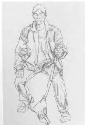
6 依次画出下肢,画下肢时要注意把握腿内部形态的外部呈现及膝部的转折。画脚要注意其外形及与腿的上下贯通,腿与脚不必分开画。