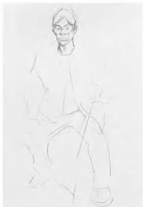
3 画头部时要注意把临头的形态与主要的面部特征,强化对象的个性之美,使其生动而又有趣。