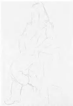
1. 此幅中的姑娘动作幅度稍大, 其肢体的构成角度与变化较多, 画的时候应注重其肢体节奏运动与韵味。