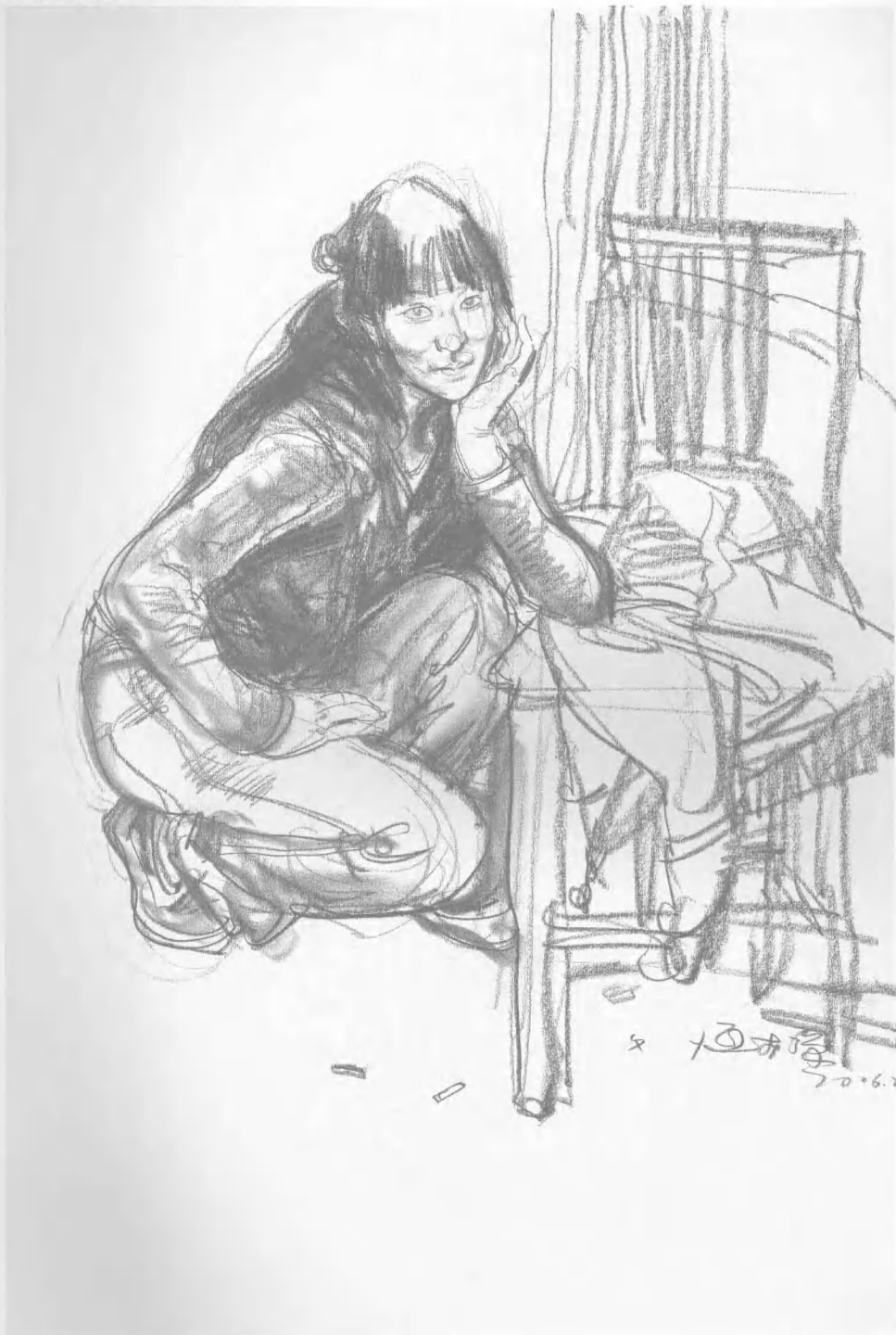
《画室中的女士》速写范例