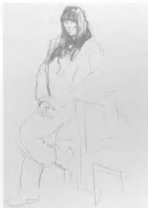
3 头发可以粗放一些, 但要注意头发的造型与纹理结构, 不要乱了章法, 且要与脸部很好地反衬与配合。