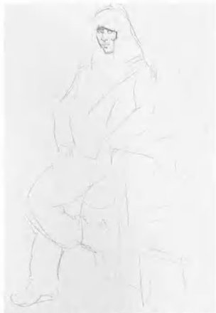
2 待基本感觉已隐约可见, 便可先从脸部开始加以确定, 要注意传达脸部的神情, 画女性的用线可柔和一些。