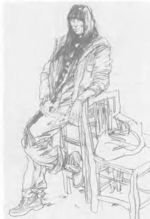
7. 再画出椅子等, 根据通幅的整体要求做适当的补充或构图上的调整, 画面的布局应有松紧虚实的研究。