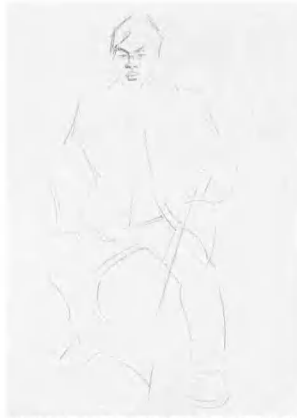
2 待对象的基本比例及骨架大体确定,再从头部开始具体勾画,注意头的位置与大小。