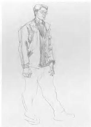
4. 依次把上半身全部画出, 应注意头、手的空间位置, 线条要注意其穿插的疏密关系。