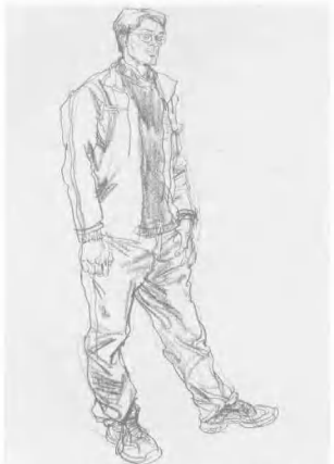
7. 根据画面的艺术要求, 进行适当的深入调整, 使画面效果更显厚重与丰富, 整体感觉要很像对象, 具体对照又无一处完全相同。