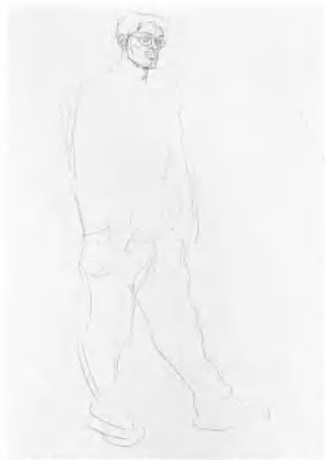
2. 略作调整后由头部画起。头部要写其大意, 画出对象的面部特征与神情, 可以与对象有一定的游离