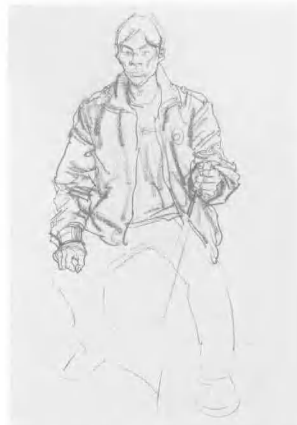
5 再用同样的方法画出上部右半,线条要有粗有细,穿插进退,主次分明。画手要注意其手形与手势,捕捉手的“表情”。