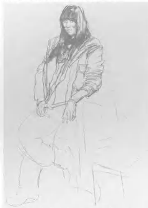
4. 画出上半身及手部, 要注意两肩的高低及头部的构成角度, 把握好胳膊、手腕, 及手二者间的转折、屈伸的节奏关系, 勾画出女性手指的特有的感觉。