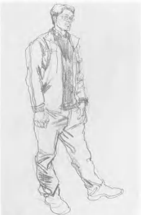
6. 至此, 已把主要的轮廓与纹理全部画出, 要特别注意两脚的位置及大小, 应不断地与头部进行比较来加以确定。