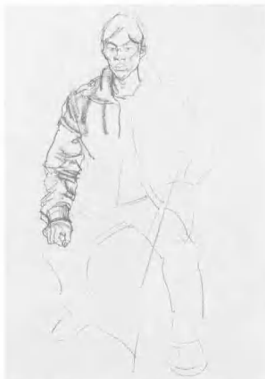
4 以头部作参照画出左边手臂,要通过与头部的比较,来确定手的位置、大小,要注意手与头部的呼应。