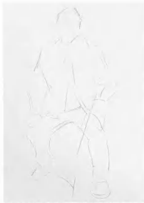
1 用概括的线条轻轻勾画出对象的基本形态与姿势,注意头、手、脚的位置及肢体间的比例。