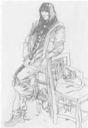
8. 应特别注意头、手、脚三者的整体位置及相互间的节奏关系, 衣纹不要杂乱无序, 应从内在结构与肢体动作的表现。