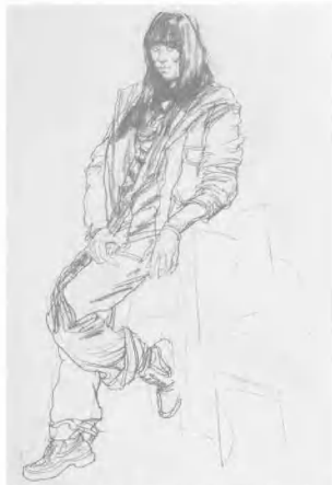
6 线条应表现出肢体的结构与动作, 通过疏密的对比与处理显示出前后、进退关系, 同时又富有线条本身的美感。