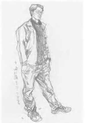
8. 至此, 画面已较为完整, 画者不可被动模仿, 表现整体效果的生动应当更为重要。