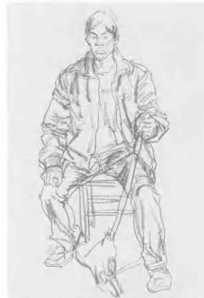
8 做最后补充与丰富,线条要有虚实,侧锋的配合及虚实的映衬,既有书写的快意又不失之草率与轻浮,道具可虚虚地画出。