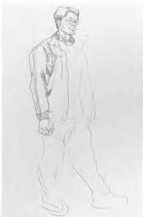
3. 以头部为准, 画出左边手臂, 手臂与头部在气势上要贯通, 对线的勾勒应放松一些, 要强化线条的