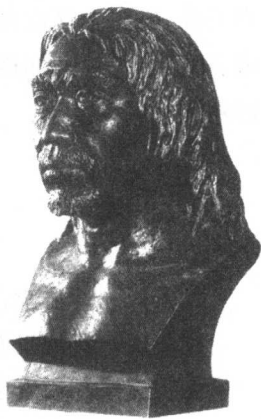
“山顶洞人”复原胸像

始于禹,终于桀,历经 17 帝。夏朝姒姓。定都安邑(今山西夏县北)、阳翟(今河南禹县)等地。这一时期,开始出现私有制,王位世袭制取代了禅让制。逐渐进入到奴隶制社会。现存有关夏代的史料十分匮乏,考古与历史学家希望通过各种手段发现更多的夏代遗存,尽可能地还原夏代历史。