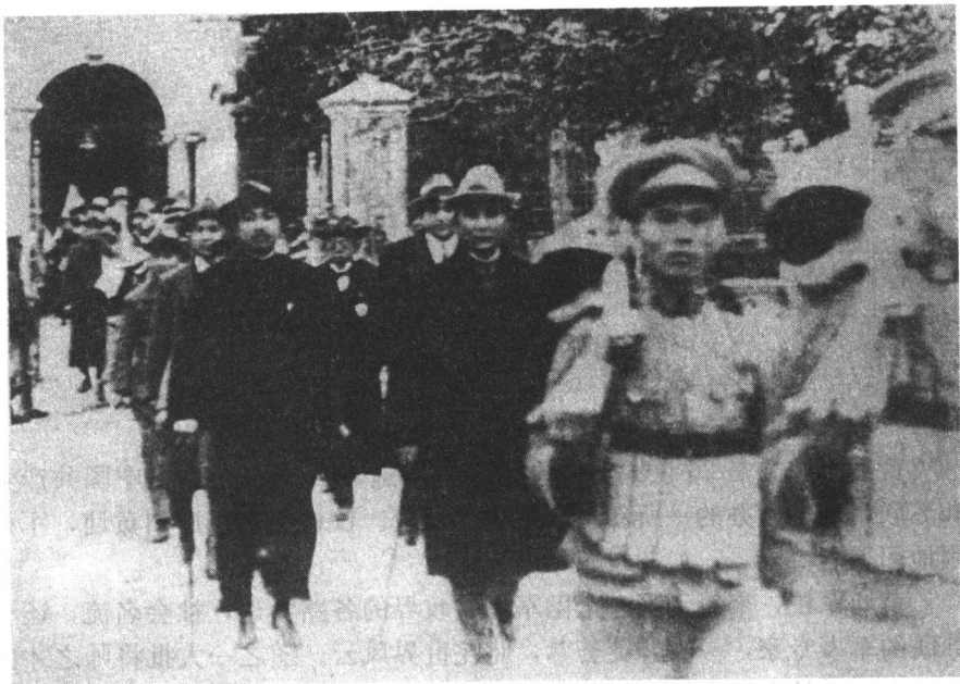
1924年1月底，孙中山等步出国民党“一大”会场。

争时期的西南联合大学（北京大学、清华大学、南开大学等联办），受教的这群学生中后来产生了数位诺贝尔奖获得者。一个“联”字，成就了许多有志青年。反之，名校也会褪去光彩，很难再有昔日辉煌。早期黄埔军校也好，西南联大也罢，其成功教育的秘诀显然与这个“联”字有极大关系。