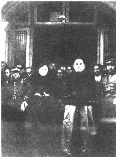
1924年元旦，孙中山和夫人宋庆龄在广州。

1921年12月，此时正值第一次国共合作时期，孙中山通过中国共产党人的介绍，会见了共产国际代表马林，对其提出的改组国民党、谋求国共两党合作和建立军事学校等建议十分赞赏。1923年8月，孙中山派蒋介石率领由国民党人和共产党人