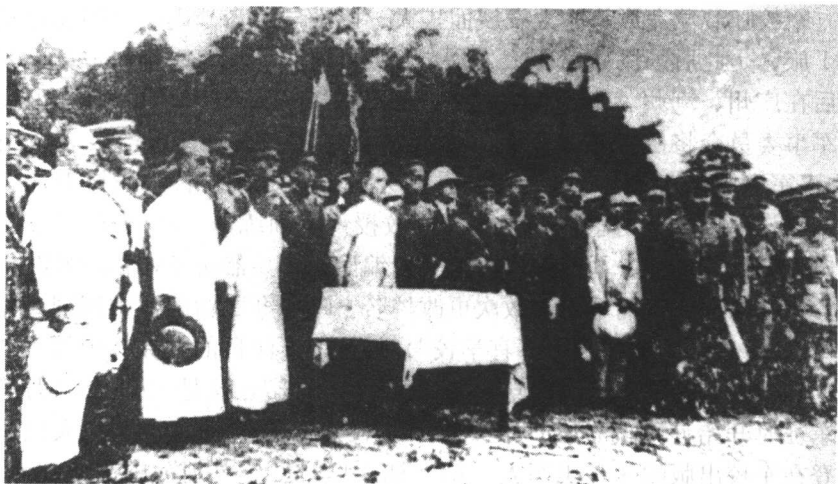
孙中山视察黄埔军校时，向师生发表演说。

阅读三民主义和马克思主义等书籍。《政治教育大纲草案》规定，政治课包括三民主义、帝国主义、社会主义、各国革命史、军队政治工作、政治学、经济学等 18 门。教学方式，以讲授政治课为主；同时，定期举办政治讲演会、政治讨论会、政治问答等。国共两党及社会著名人士谭延闿、张静江、毛泽东、刘少奇、鲁迅等曾到校讲演。军校为加强对师生和群众的宣传教育，大量出版期刊、专刊、文集、丛书等，向校内外发行。此外，还制定了《革命军刑事条例》、《革命军惩罚条例》、《革命军连坐法》等军法，以严格军事纪律。