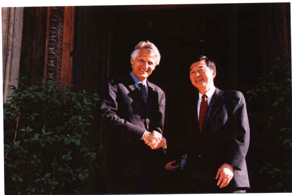
2003年5月，吴建民向当时的法国外长德维尔潘辞行