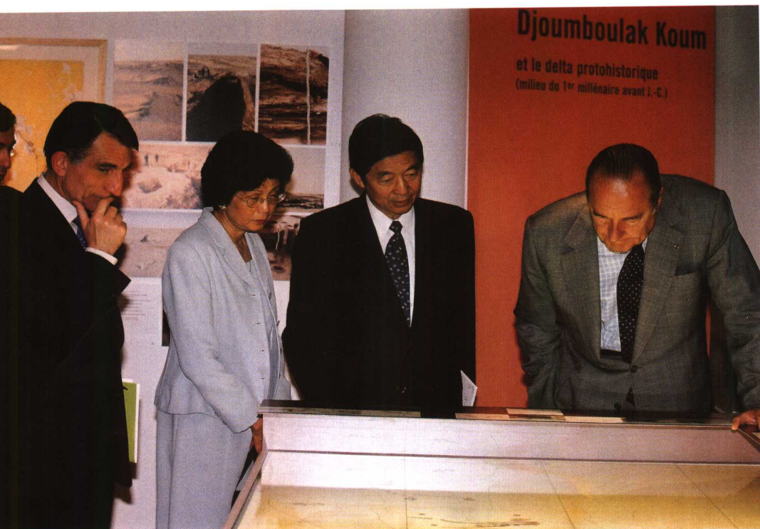
2001年5月，吴建民、施燕华陪同希拉克总统参观中国新疆出土文物展