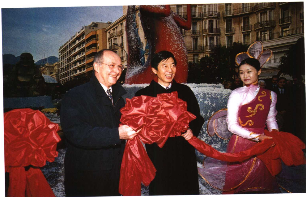
2000年12月24日吴建民出席法国芒东市中国式圣诞节开幕式