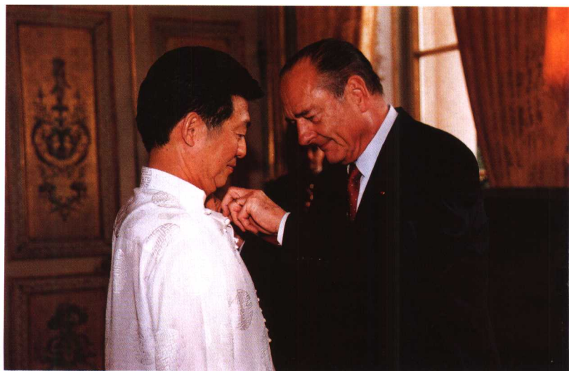
2003年6月27日希拉克总统 亲自为吴建民戴上勋章