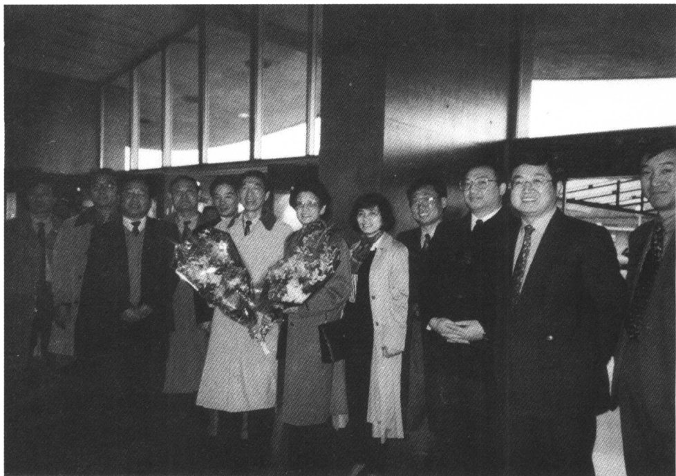
▲ 抵达巴黎，在机场受到华侨的热烈欢迎（1998年11月6日）

日内瓦机场横跨瑞、法两国，跑道共享，候机楼也是同一个，只不过中间有一扇门表示国界。国界两边是瑞、法的边防。我们在瑞士一边的窗口办完离境手续，推开“国界门”，就到了法国领土，要办理入境手续。几分钟的时间完成了出境和入境的手续，真是方便。