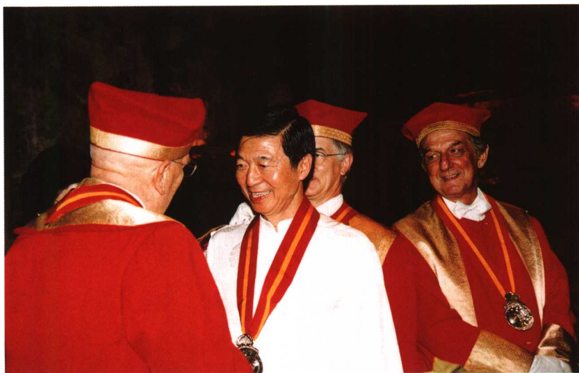
2003年6月第戎酒商为吴建民隆重“授勋”