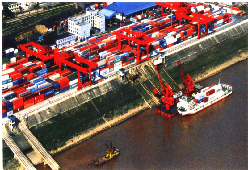
重庆九龙坡集装箱码头鸟瞰