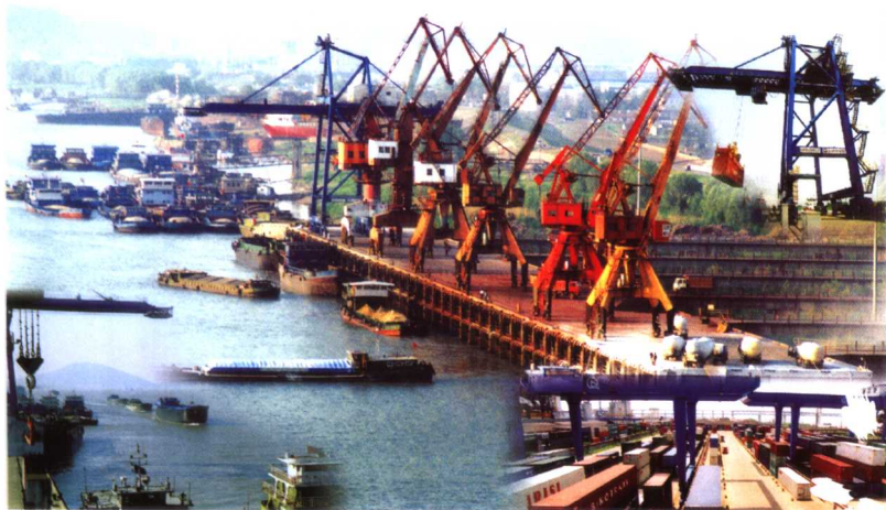
芜湖港外贸码头鸟瞰