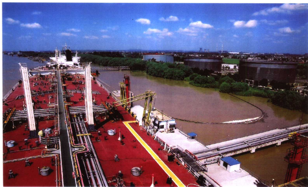
南京仪征油运码头