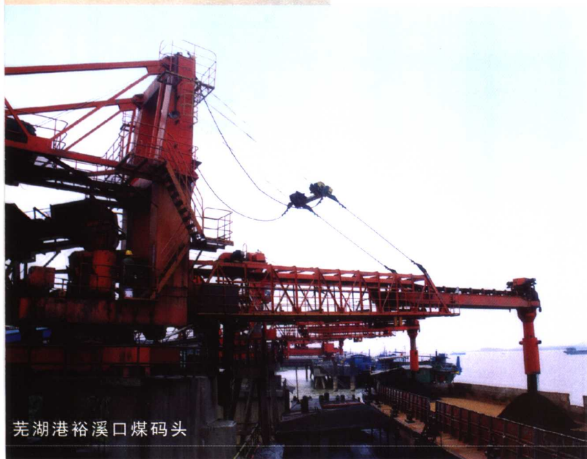
芜湖港裕溪口煤码头