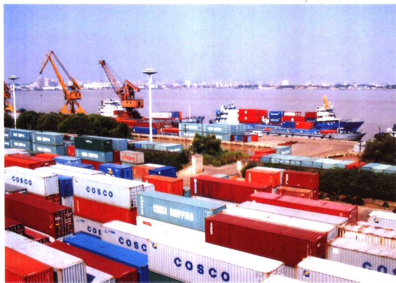
武汉港集装箱码头