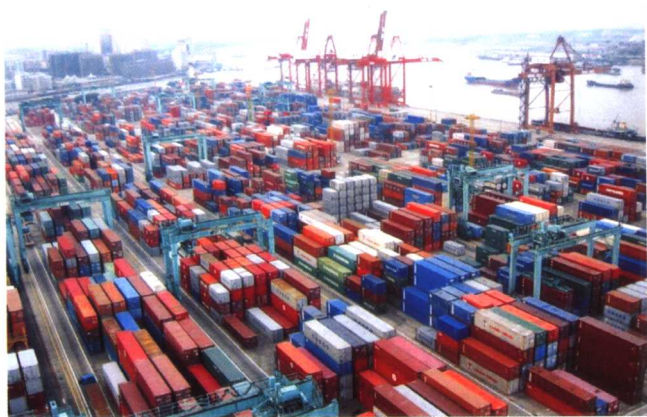
上海外高桥集装箱码头