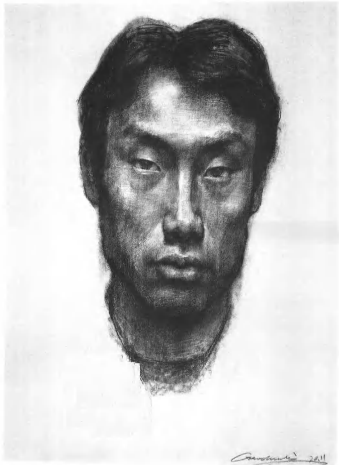
素描头像，炭笔，宣纸，40cm×54cm