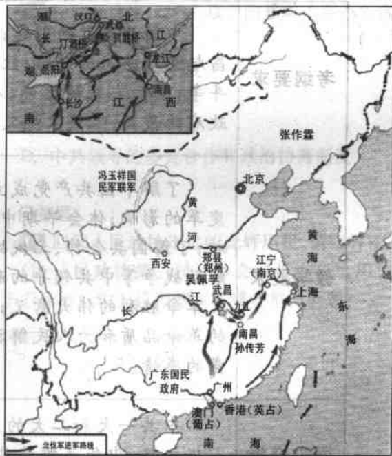
图一 北伐战争形势示意图