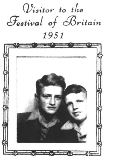
特里·法雷尔（右）及其兄弟 (参加不列颠节，伦敦，1951年)

特里·法雷尔，1938年生于英国曼彻斯特市，1961年以一级荣誉学位从家乡纽卡斯尔的杜伦大学建筑学院毕业。在大伦敦市政府的建筑部门短暂工作之后，法雷尔获得了宾夕法尼亚大学研究生院建筑和城市规划硕士学位（1962~1964），在此作为一名建筑学的狂热追随者，他师承于路易斯·康、丹尼斯·斯科特·布朗、罗伯特·文丘里、和伊恩·麦克哈格。在这期间，特里·法雷尔广泛地游历于欧美各国，随后在日本学习住宅和城市规划时，获得过RIBA Hunt奖和罗斯·什普曼奖学金（1964）。1965年，法雷尔-格里姆肖合作事务所成立，1980年，法雷尔开始自己执业。