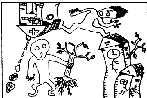
“房树人测验”的某些特定意义

漏,如不画门、窗、树叶,人物缺乏耳朵、鼻子等主要器官,还有的在表达手法上,表现出矛盾,古怪的形象,图形结构不完整,描绘时间过短而草率等。