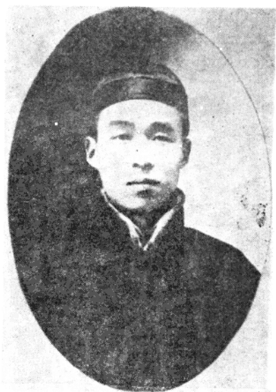
辛亥革命人物 陆翰文