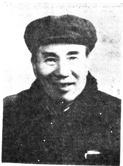
辛亥革命人物 丁任生