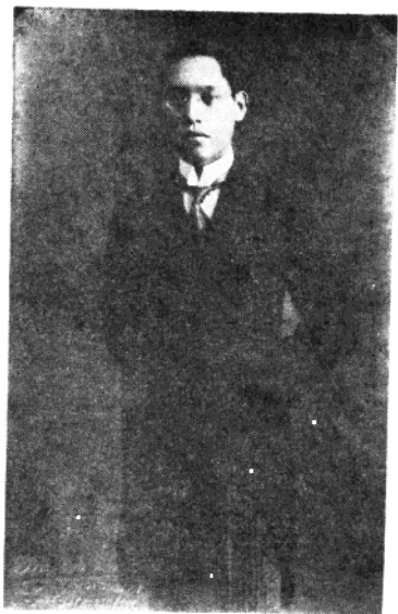
辛亥革命人物 许积民