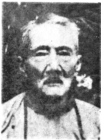
辛亥革命人物 杨镇毅