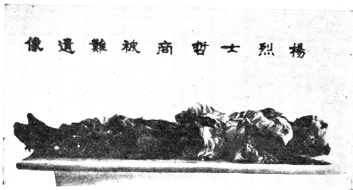
楊哲商烈士被難后之遺骸