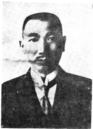
辛亥革命人物 张 翹