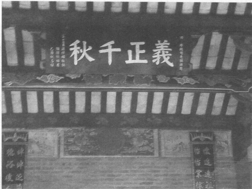
湛怀德祠横额：义正千秋

当地湛、麦、谢三姓村民，保卫乡村百姓的生命财产安全，进行村民自卫，并接受当地官员何真授予的“元帅”称号。明初洪武年间，湛怀德曾帮助南雄侯赵庸讨伐苏友兴，并取得成功。事后赵庸邀请他出来做官，但他不愿出来做官，被赵庸封为“义士”。后来在增城的新塘建立了纪念湛怀德的“义士祠”。“义士祠”现在保存较为完好，祠中陈列湛怀德等义士捍卫家乡、保卫百姓生命财产的英雄事迹，深受当地百姓的敬仰和爱戴。如今“义士祠”成了教育青少年爱国爱乡的爱国主义教育基地。湛怀德生果成，果成生湛江。湛江是湛若水的祖父，字宗远，号樵林。此时，湛江的家境较为富裕，拥有较多的田产、鱼塘，是当地有名的小康之家。湛江隐居乡间，与当时广东的著名学者丘濬、陈白沙都有交往。湛江与陈白沙的交往可能是后来湛若水拜师陈白沙的原