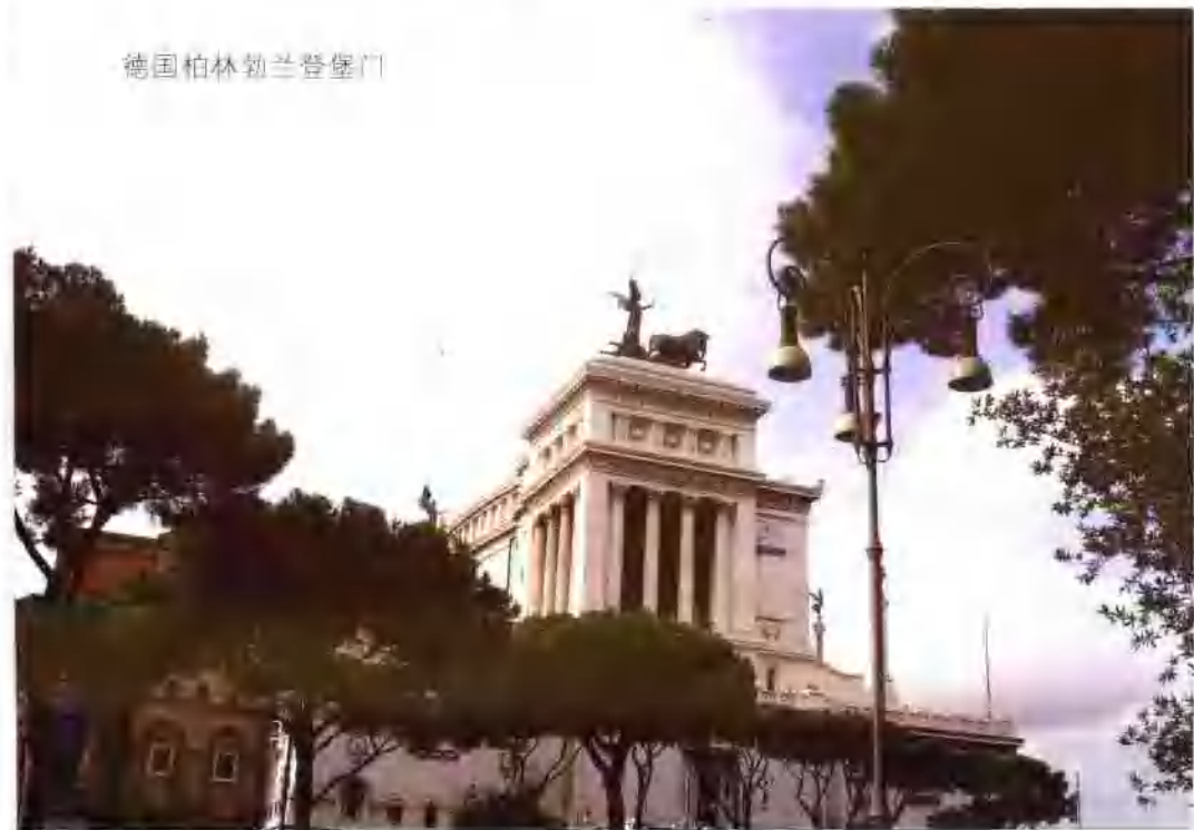
德国柏林勃兰登堡门

园。先说都市风光。法国首都巴黎，波光粼粼的赛纳河穿城而过。河两岸，有高耸入云的埃菲尔铁塔，巍峨庄严的巴黎圣母院，藏满珍宝的罗浮宫，宽阔漂亮的香榭里舍大街、辽阔惊人的协和广场，气势雄伟的凯旋门。城郊不远处有金碧辉煌的凡尔赛宫。风车之都——荷兰的阿姆斯特丹，草地广阔，渠道纵横。水都威尼斯有一百多座小岛，像珍珠一样撒在海面上，是一个令人魂绕的地方。此外，音乐之都维也纳，峡谷之都卢森堡、号称露天历史博物馆的“永恒之城”罗马，从公元前八世纪到现在各种历史时期的城址、宫殿、教堂、墓葬、花园等文物古迹遍布全城。再说河流风光。夜晚的赛纳河两岸灯火辉煌；德国莱茵河两岸，山峦起伏，层林尽染；奥地利多瑙河在灿烂的阳光下，像一条蓝色的飘带，真不愧是一条“蓝色的多瑙河”。置身于欧洲的都市、河流、田园、湖泊，会令人有如神仙一般融入大自然中。西欧八国不仅有着旖旎的自然风光，