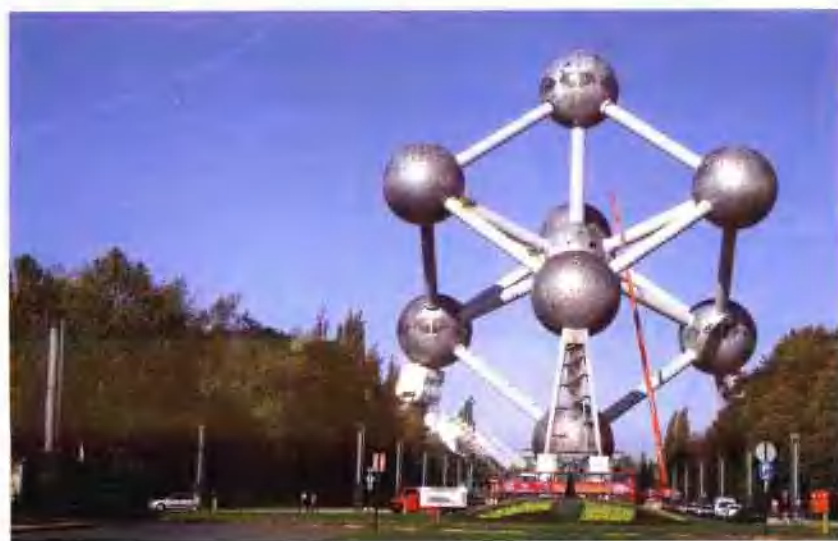
比利时原子球铁塔