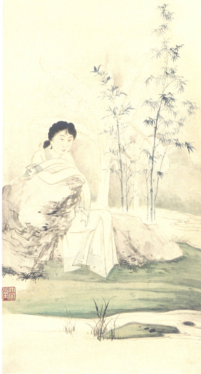
仕女蕉竹（一九三七年）四川翰雅文化珍品拍賣行供稿