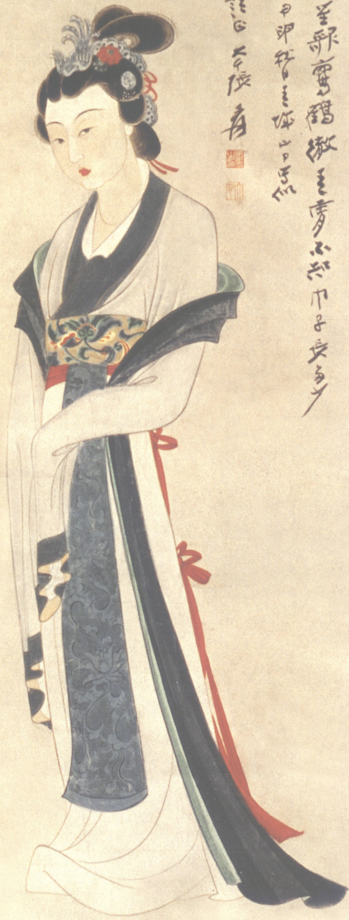
金城玉女（一九四四年）

玉關生輝未是遙 聖歌靈鶴傲 三秀不亦下 子長多 日之輝光化 律橋 甲申 年 月 日 畫 會傑 作 方 家 并 題 詩 句 長 青