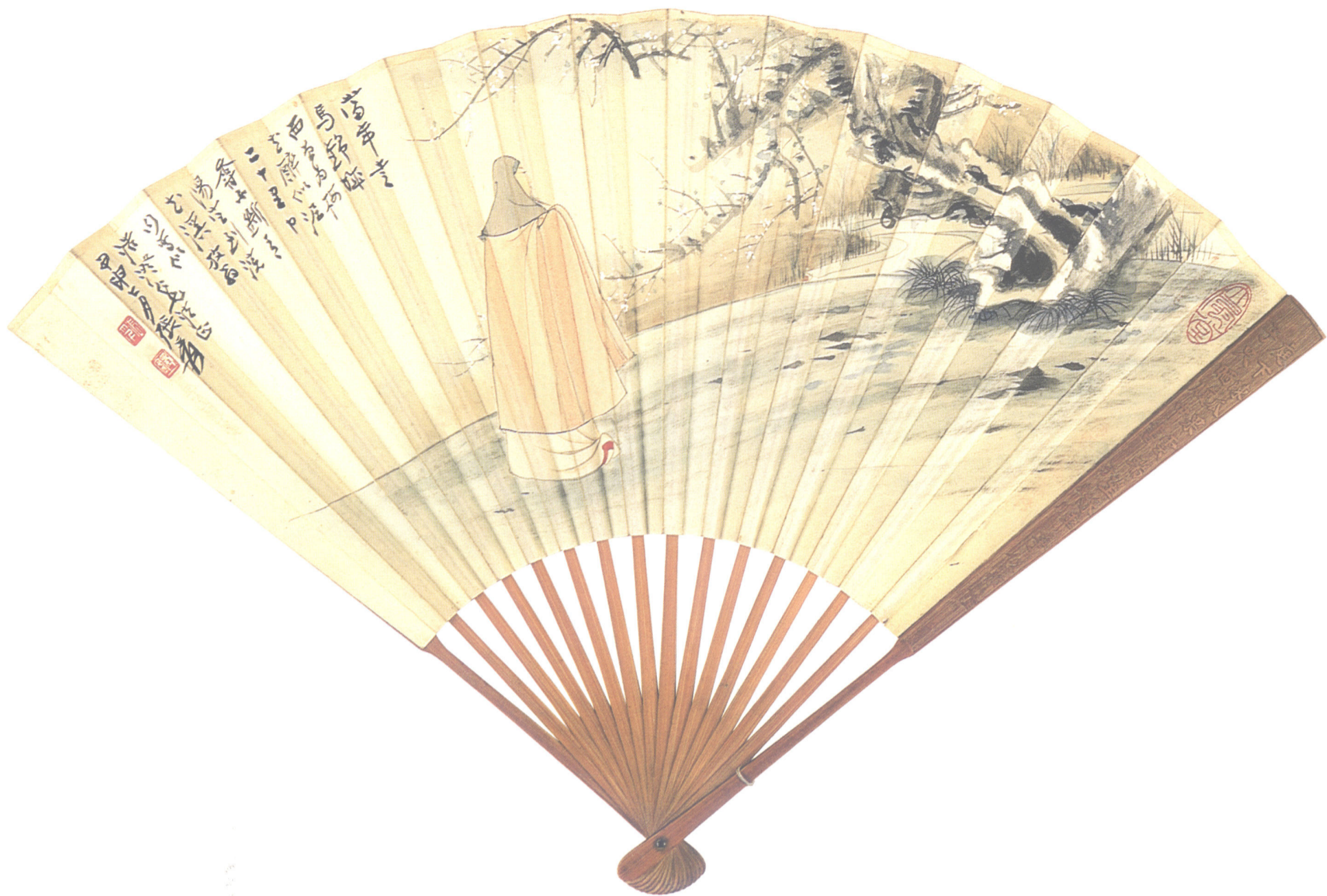
高士梅花 (扇面) (一九四四年)