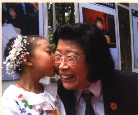
» “法官妈妈”与小朋友