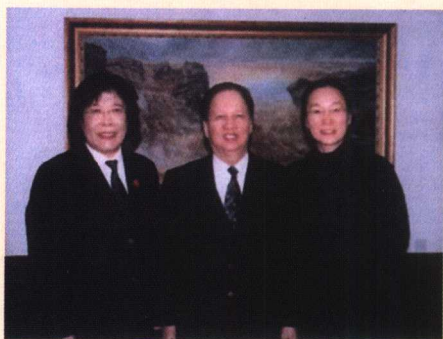
» 最高人民法院院长肖扬接见尚秀云法官和电影《法官妈妈》扮演者奚美娟