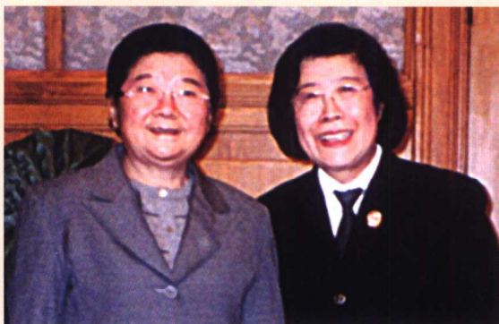
» 全国人大常委会副委员长、全国妇联主席顾秀莲 与“法官妈妈”尚秀云合影