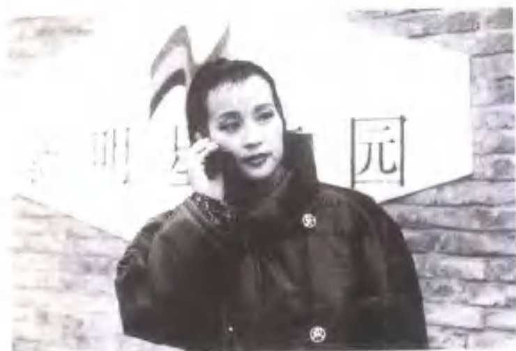
刘晓庆在投资兴建落成的一新明星花园一前。