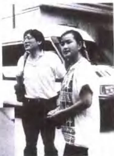
刘晓庆与“法国男友”亚丁。