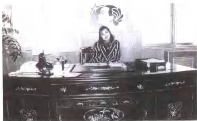
刘晓庆坐在自己的董事长红木大办公桌后。