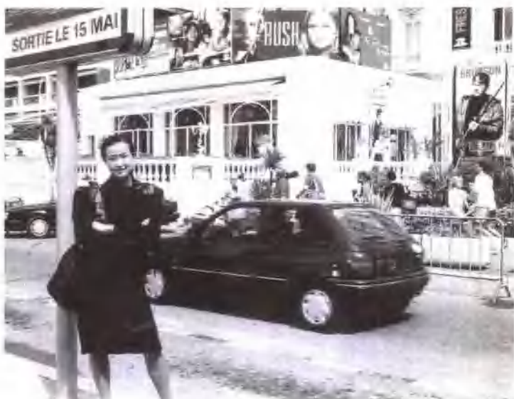
刘晓庆赴法国参加戛纳国际电影节在街头留影。