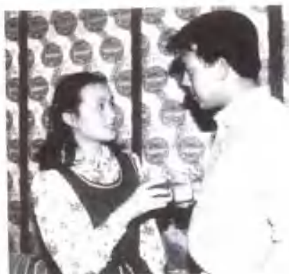
刘晓庆与中国影帝姜文。