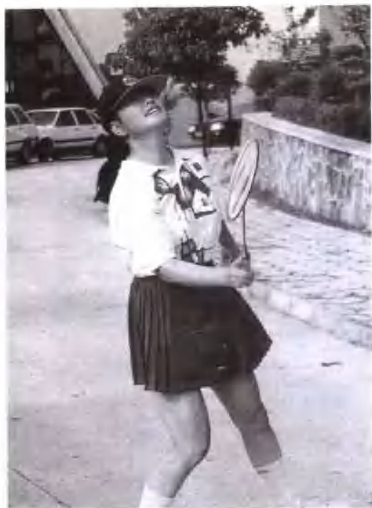
刘晓庆在江苏溧阳天目湖静泊山庄晨练。