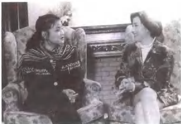
刘晓庆与电视节目主持人笑谈女性。