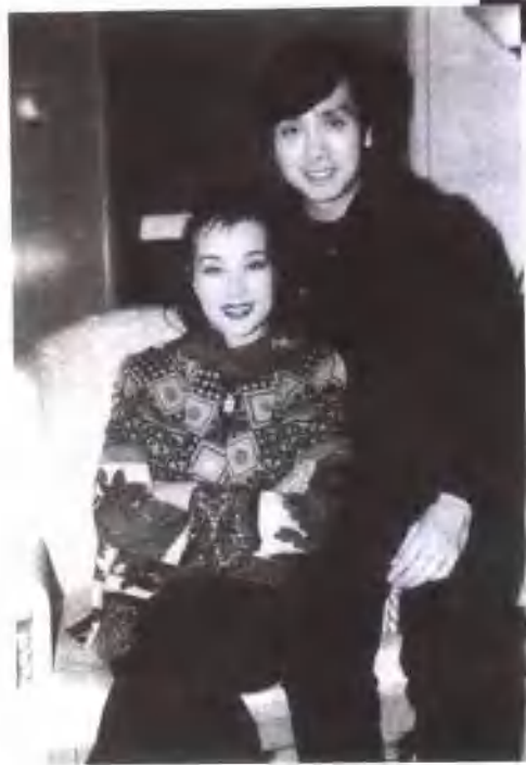
刘晓庆与香港影星伍卫国。