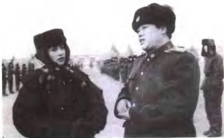
刘晓庆出自军队文艺团体，此番重返军营探访。