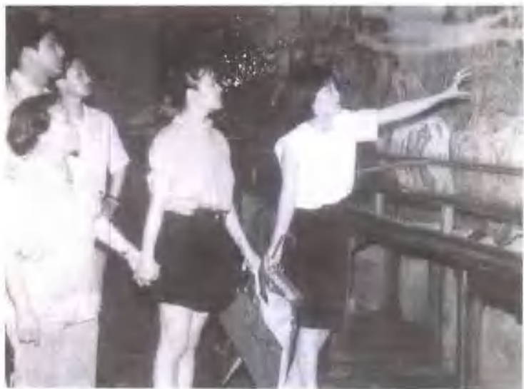
刘晓庆与妈妈(左一)及其家人一起参观画展。