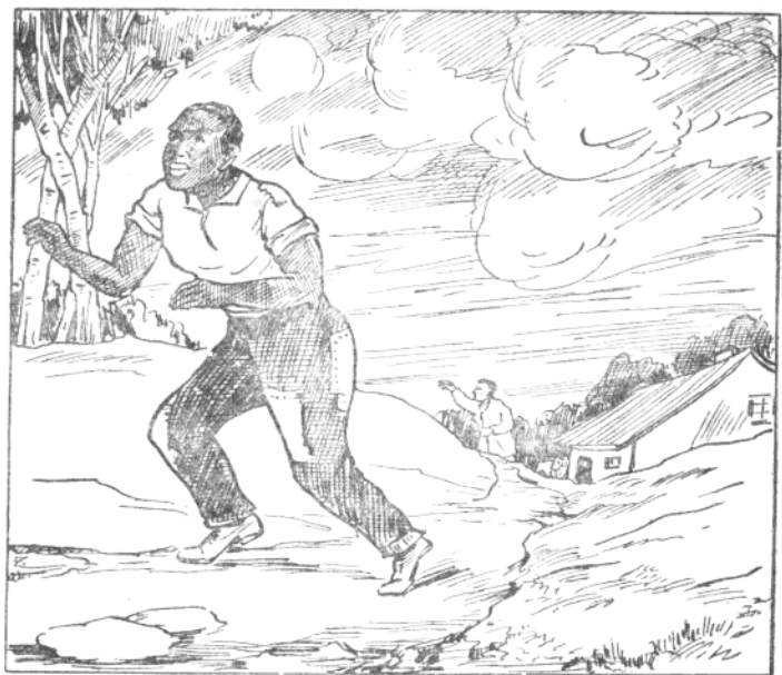
羅伯遜父親的逃跑情形

個農場主。他不願跟着新主人到遙遠的地方去，就在中途逃跑了。他的主人緊緊的跟在他後面追，還放出惡狗去咬他；並且宣誓說，如果把他抓了回來，一定要重重的處罰他。但是他父親始終是一刻不停的跑，終於逃脫了虎口，逃到了 新澤西州 。這地方離開老家已經很遠很遠了。他也不再怕主人追來，這才停留下來。這就是他的故鄉了。