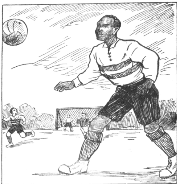
足球是羅伯遜的拿手好戲

在二年級時，他參加校隊，以十四比零，打敗了遠近聞名的 新港海軍後備隊 的足球隊。