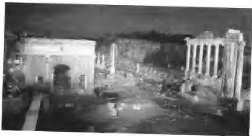
罗马凯旋门及维斯帕西亚诺神庙

克莱门七世于1523年被推崇为教皇,他和利奥十世一样出身于美第奇家族。罗马人认为是利奥黄金时代的重返而欢欣不已,却不知道罗马将因克莱门错误的政策而遭逢大难。因为1519年,当强大的西班牙国王查理当选为神圣罗马帝国皇帝后,便亟欲和其表兄弟法国国王法兰西斯一世争夺意大利的控制权,而克莱门七世夹在这两大强权之中左右为难,政策摇摆不定,一会儿和法国结盟,一会儿又靠向西班牙。1524年,法军占领米兰时,克莱门原是和查理五世结盟,但他却又秘密和法国签订同盟以求自保,并同意法军通过罗马,攻击西班牙的属地那不勒斯。查理五世因此大怒,决意惩罚欺骗他的教皇。结果两个月后,法军在帕维亚惨败,查理五世的军队将法国势力逐出了意大利,克莱门压错了筹码。查理五世接下来就是要惩罚罗马。