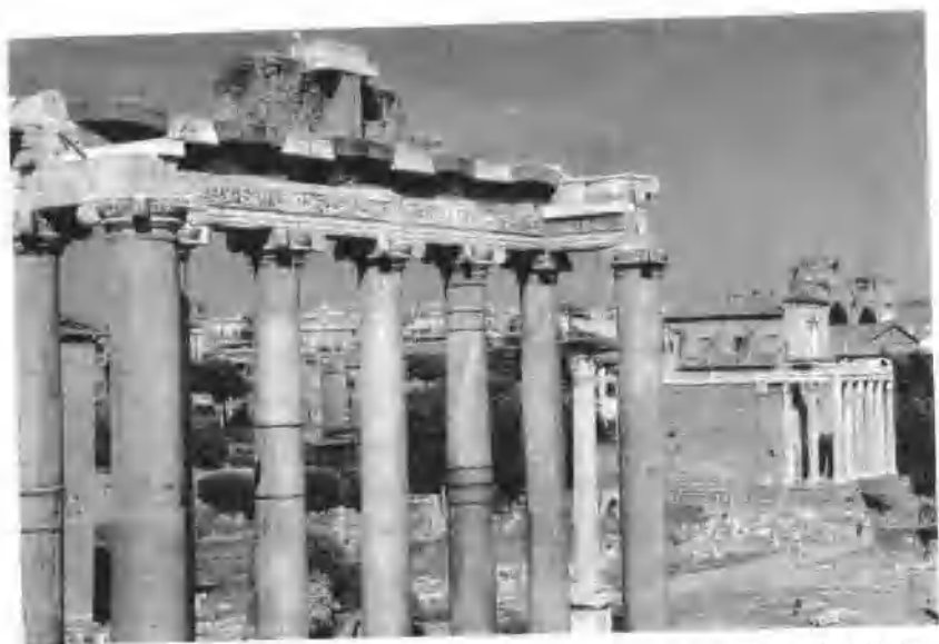
罗马萨图尔诺农神庙

公元 1527 年，查理五世的军队包围了罗马，罗马在勇猛的抵抗后依然被攻破，两万名敌人涌入城中，其中有半数是路德新教派的德国兵，他们早就愤恨罗马的腐败了。因此，他们毫不留情地破坏一切、烧杀掳掠，遭强奸活埋者不计其数。这样的劫掠持续了八天，罗马死尸遍地，世界之都瞬间成了地狱。教皇则被囚禁在圣安吉罗城堡内达七个月之久，而罗马几乎成了空城。当克莱门被释放时，已是一个憔悴的人。