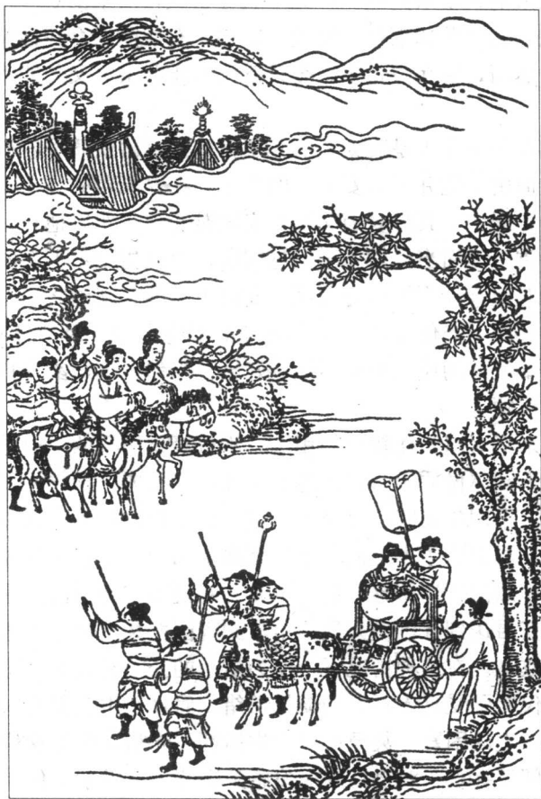
王孙异人入赵为人质

光和美景。异人心里清楚，秦军虽然失利于邯郸城下，然而迟早会再次派大军进攻赵国。到那个时刻，自己只能客死他乡，难以回到秦国。思前想后，异人感到来日归国的希望十分渺茫。