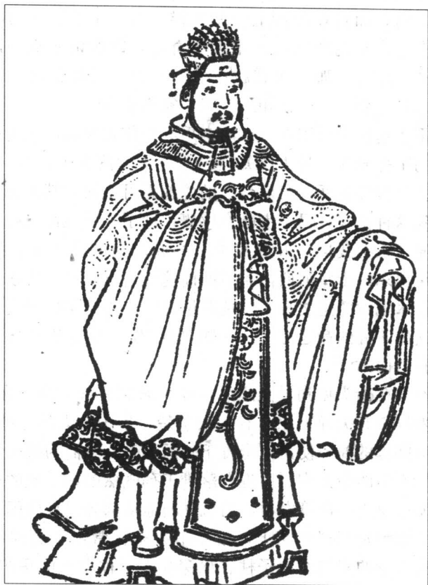
大商人、大政治家吕不韦