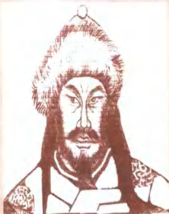
辽太祖·耶律阿保机