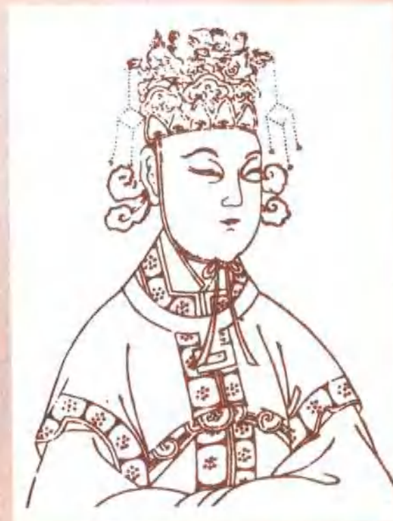
武周圣神皇帝·武则天