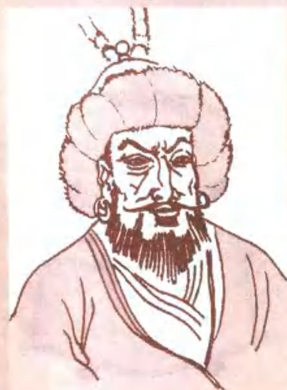
金太祖·完颜阿骨打