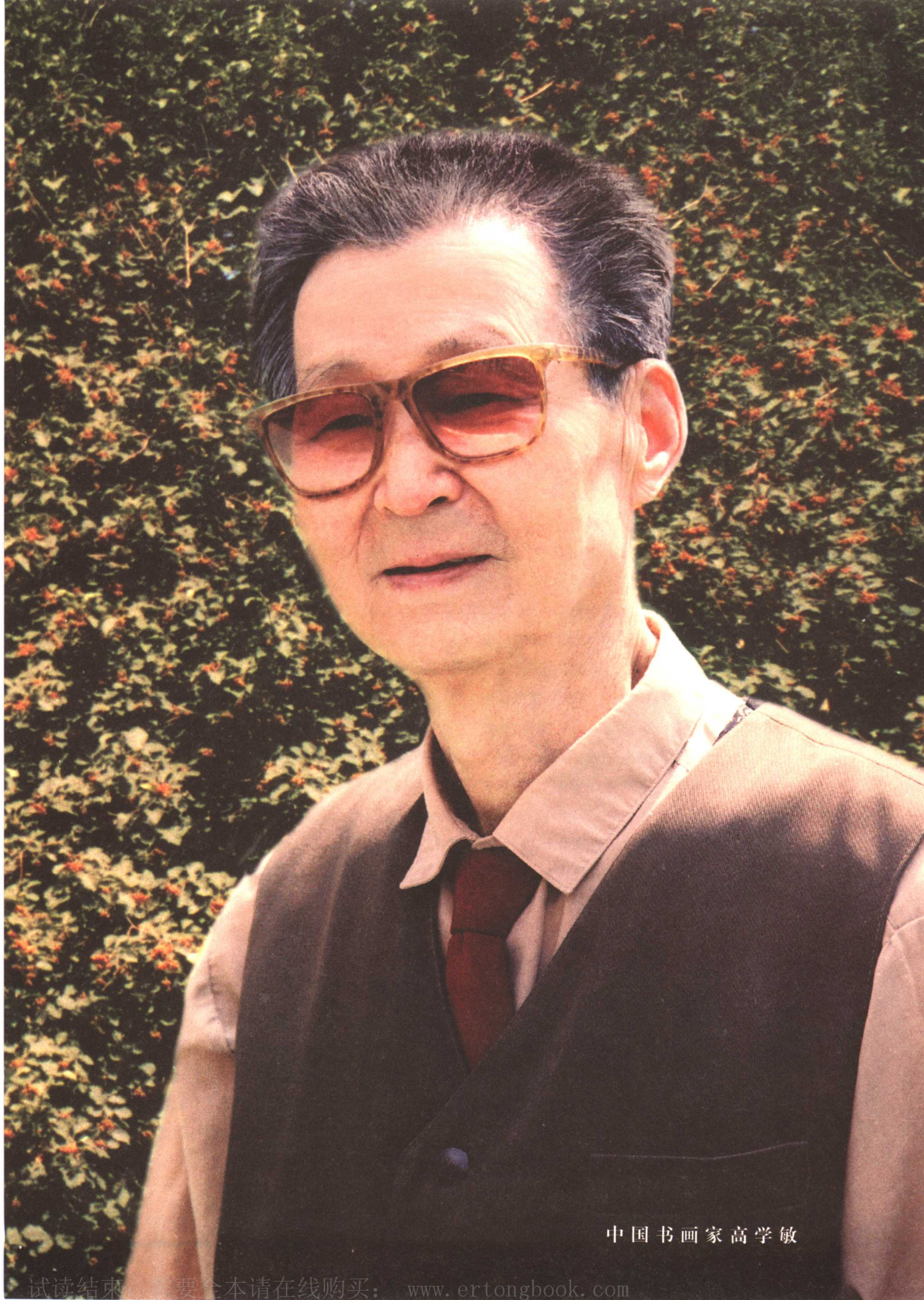
中国书画家高学敏