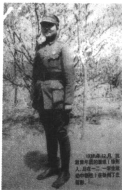
抗日战争时期的潘琰

“一二·一”运动是在中国共产党领导下，于1945年由昆明学生发起并得到全国各地响应的反内战、争民主的伟大爱国民主运动，是中国新民主主义革命史和中国青年运动史上的光辉篇章。年轻的女共产党员潘琰女士，就是此次运动牺牲的四位烈士之一，也是其中唯一的女性。