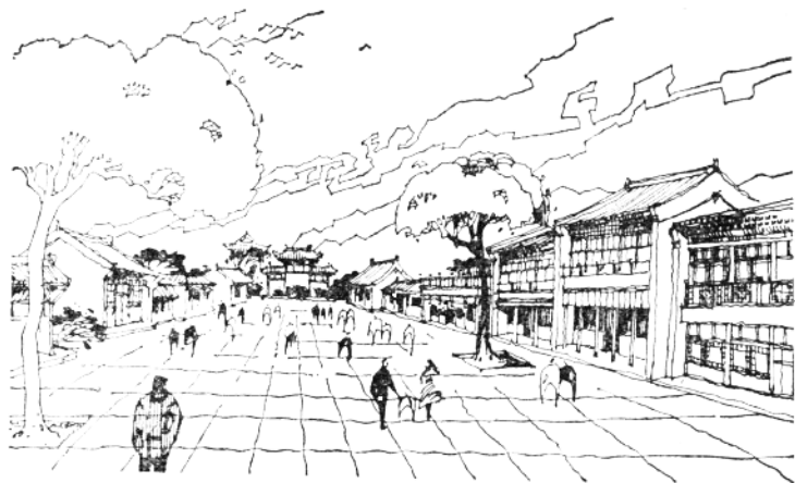
蓟县城内的渔阳古街

蓟县不仅历史悠久，而且具有光荣的革命传统。抗日战争时期，英雄的蓟县人民在共产党领导下，参加了震惊中外的冀东大暴动，开创了著名的盘山抗日根据地。