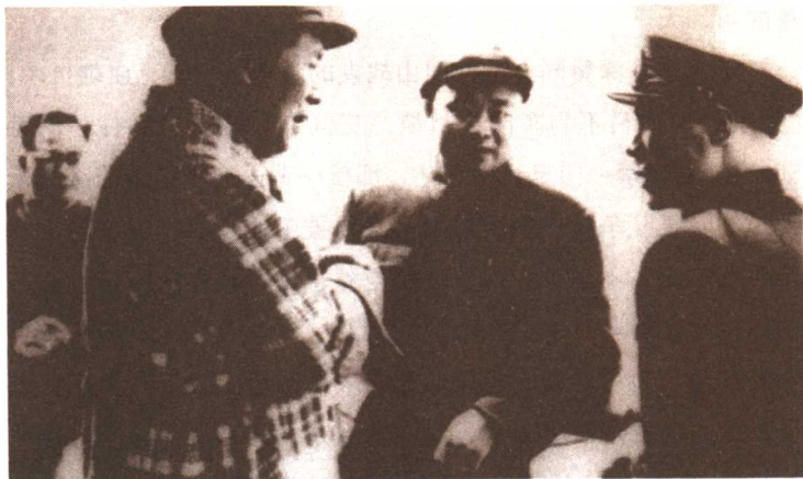
1958 年，毛泽东与谢滋群（右二）在江峡轮交谈。