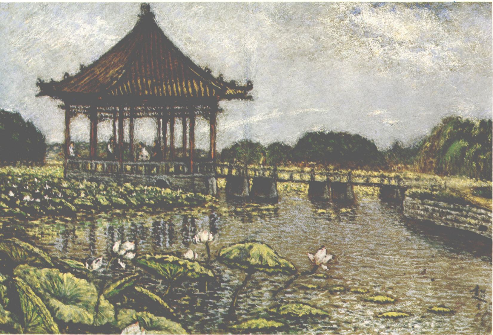
5. 大明湖风景（七曲亭）（66×44cm） 1964