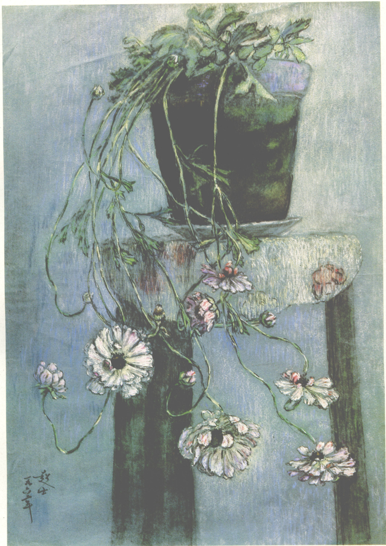
1. 吊兰 (56×38cm)