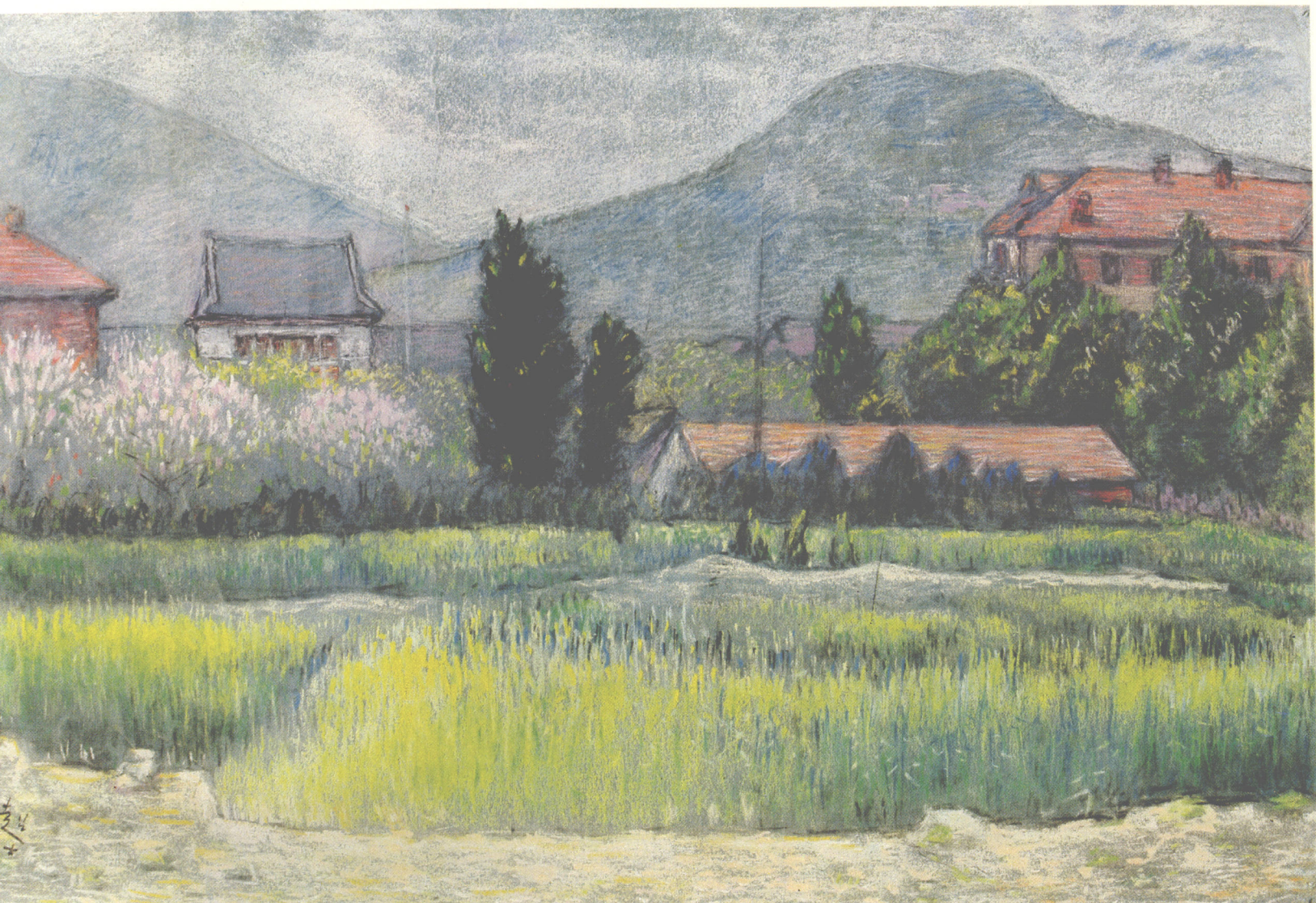
6. 济南北园公社（毛主席到过的地方）（35×45cm） 1962