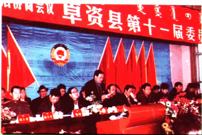
政协卓资县十一届委员会第一次会议开幕式