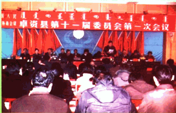
政协常委在主席台上