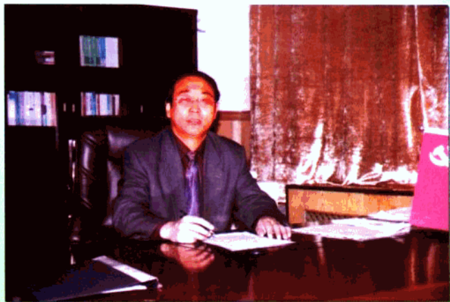
中共卓资县委书记 吴永锋