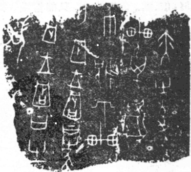
甲 骨 文

中國文字 最古的字體是殷朝的甲骨文體，那時候，沒有筆，沒有紙，文字是用刀子刻在烏龜殼或者野獸的骨頭上的。