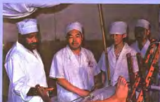
斯里兰卡骨科专家来院参观考察