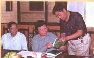
2004年9月15日国家中医药管理局副局长吴刚（中）视察洛阳正骨医院