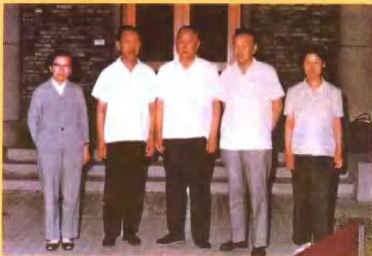
1983年4月16日国家主席李先念（中）与郭维淮（左二）合影