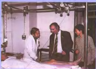
意大利骨科专家来院参观考察