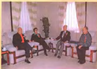
2004年4月26日河南省副省长王菊梅（左二）亲切接见郭维淮同志（右一）