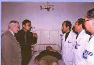
法国骨科专家来院参观考察