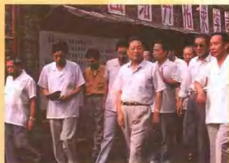
1992年7月19日河南省副省长范钦臣(右四)到洛阳正骨医院现场办公