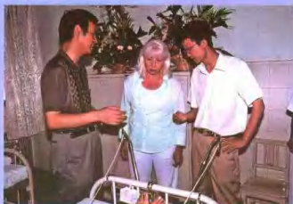
俄罗斯骨科专家来院参观考察