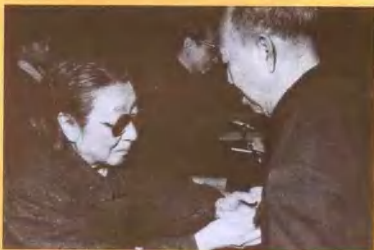
1995年1月21日，在人民大会堂全国卫生系统“白求恩奖章”获得者表彰大会上，全国政协副主席钱正英（左）向郭维淮（右）颁发“白求恩奖章”