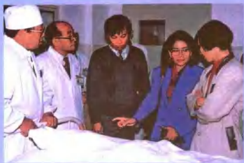
印度尼西亚骨科专家来院参观考察