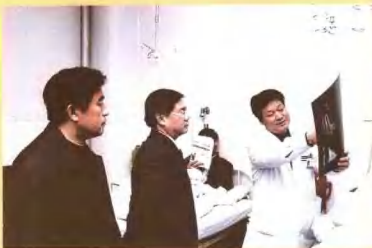
2004年12月13日河南省卫生厅厅长马建中(中)视察洛阳正骨医院