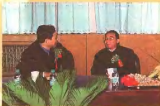
2004年10月18日,中共河南省委常委、中共洛阳市委书记孙善武(右)与河南省卫生厅副厅长夏祖昌(左)在洛阳正骨医院高等级病房大楼奠基仪式会前交谈