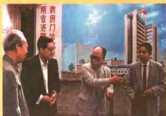
1992年5月中共河南省委书记侯宗宾(右二)视察洛阳正骨医院