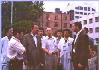
加拿大骨科专家来院参观考察