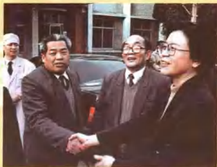
1996年3月15日国家卫生部副部长、国家中医药管理局局长余靖（右一）视察洛阳正骨医院