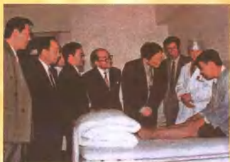
1997年4月国家卫生部部长张文康(右四)视察洛阳正骨医院期间在病房与患者交谈