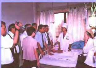
香港骨科专家来院参观考察