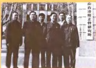
1982年4月国家卫生部部长崔月犁(左二)视察洛阳正骨医院时与河南省卫生厅厅长苏挺(右二)、院长郭维淮(左一)等人合影