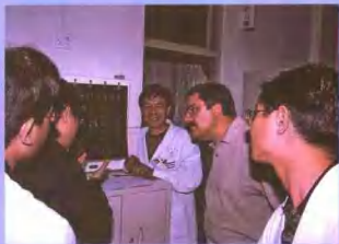
美国骨科专家来院参观考察