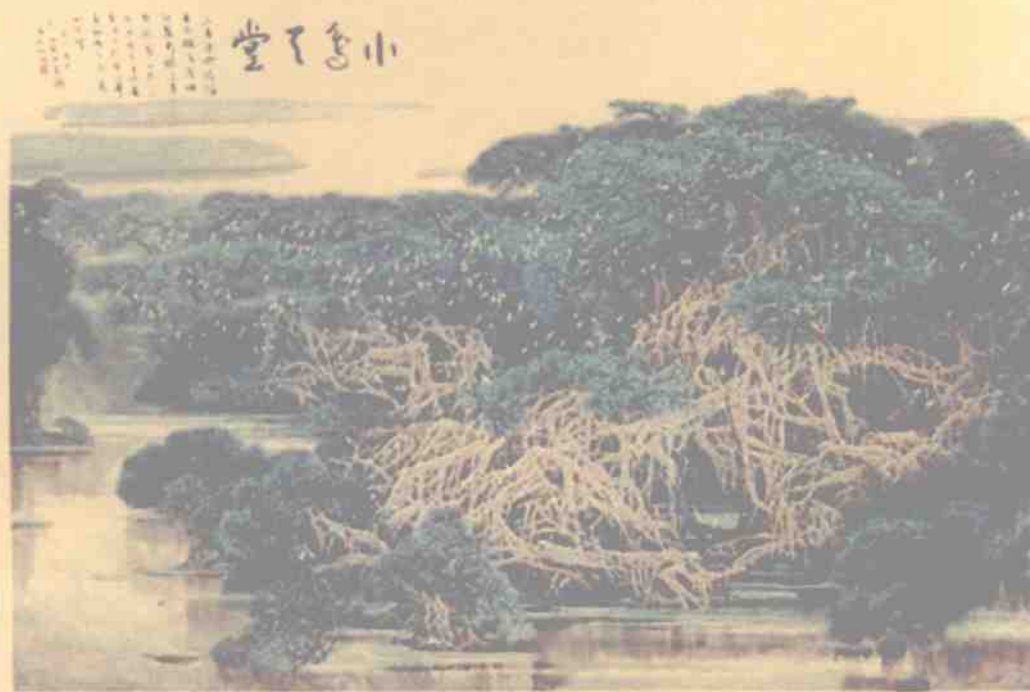
国画《小鸟天堂》 作者：伍启中