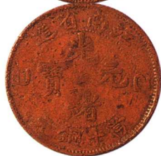
江南省造乙巳光绪元宝当十 铜圆合背，红铜，美品 市场参考价：RMB 1,000 成交价：RMB 880