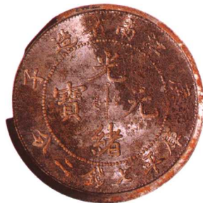
江西省造庚子光绪元宝七 钱二分 正面钢模,少见,底部有损,极美品 市场参考价:RMB 5,000 成交价:RMB 5,500