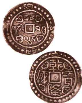
乾隆六十年乾隆寶藏中型 极美品 市场参考价: RMB 500 成交价: RMB 1,210