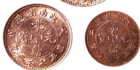
江西省造光绪元宝银币 一组三枚,包括:戊戌一钱四分四厘和 七分二厘,美品,庚子三分六厘,极美品 市场参考价:RMB 400 成交价:RMB 440