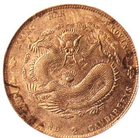
辛丑江南省造光緒元寶 七钱二分