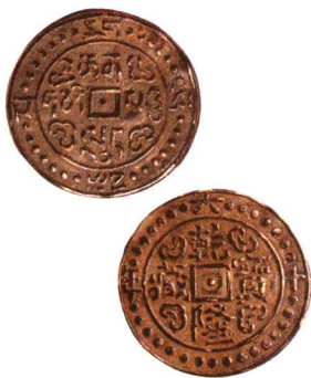
乾隆寶藏六十年中型銀幣 一枚, 极美品 市场参考价: RMB 1,000 成交价: RMB 2,310