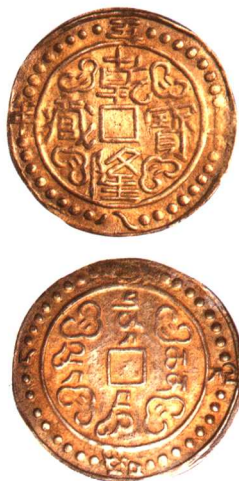
乾隆寶藏五十八年大型銀幣 一枚, 近未使用 市场参考价: RMB 1,000 成交价: RMB 4,510