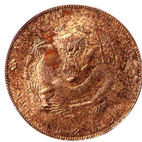
江南省造(老江南)光緒元寶 七錢二分 齒邊, 極少見, 極美品 市場參考價:RMB 8,500 成交價:RMB 13,200