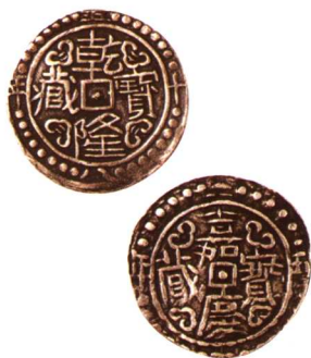
乾隆五十八年乾隆寶藏小型 嘉慶二十五年嘉慶寶藏小型 各一枚, 极美品 市场参考价: RMB 1,000 成交价: RMB 1,100