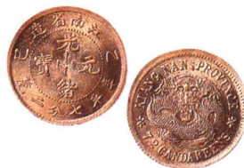
乙巳江南省造光緒元寶 七分二厘

原光，完全未使用，难得 市场参考价：RMB 1,500 成交价：RMB 3,080