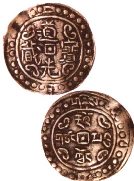
道光二年道光寶藏中型 美品 市场参考价: RMB 800 成交价: RMB 990