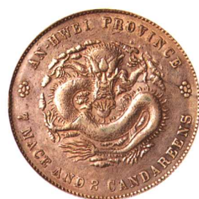
二十四年安徽省造光緒元寶 七錢二分 美品 市場參考價：RMB 1,500 成交價：RMB 2,090