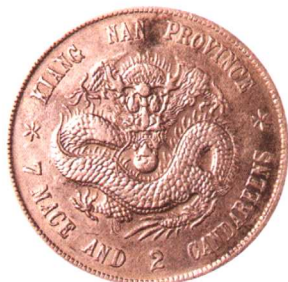
江西省造戊戌光绪元宝 七钱二分 满文中心有点版,极美品 市场参考价:RMB 1,000 成交价:RMB 2,750