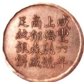
咸豐六年上海縣號商郁森盛 足紋銀餅壹兩 少見，極美品 市場參考價：RMB 25,000 成交價：RMB 38,500