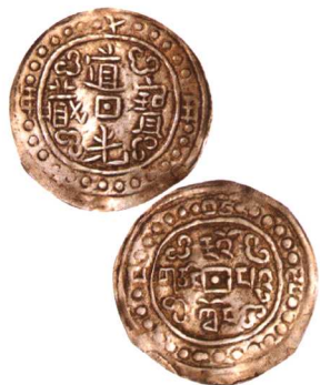
道光十五年道光寶藏中型 美品 市场参考价: RMB 800 成交价: RMB 2,200