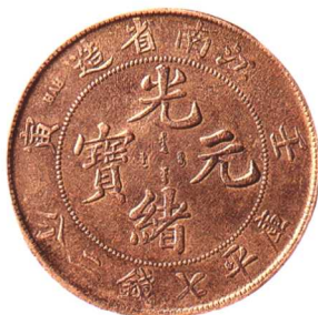
江南省造(老江南)光緒元寶 一錢四分四厘