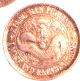
江西省造光绪元宝一钱 四分四厘 极美品 市场参考价:RMB 1,200 成交价:RMB 1,980