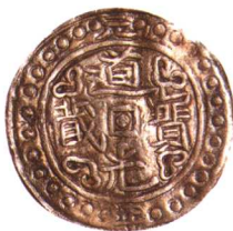
道光寶藏元年大型銀幣 一枚，極美品 市場參考價：RMB 1,000 成交價：RMB 4,510