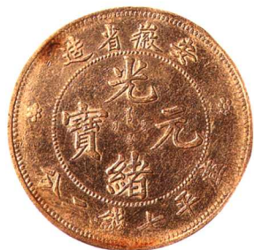
二十四年安徽省光緒元宝七錢二分 (A.S.T.C.)版,俗稱高“四”版,少見,極美品 市場參考價:RMB 6,000 成交價:RMB 10,120