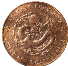
二十四年安徽省造光緒元宝 七钱二分