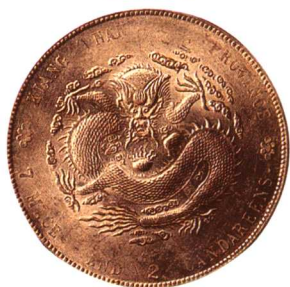
甲辰江南省造光緒元寶 七錢二分 有點版, 原光, 近未使用至完全未使用 市場參考價:RMB 1,000 成交價:RMB 1,760