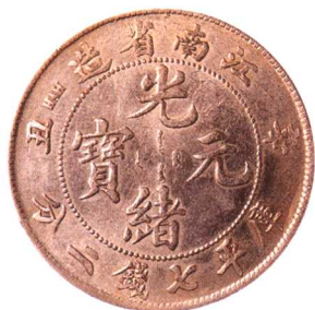
江南省造辛丑光緒元寶 七錢二分 極美品 市場參考價:RMB 3,500 成交價:RMB 3,850