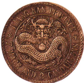
江南省造光緒元寶(老江南) 七錢二分

鷹洋邊，極少見，美品 市场参考价：RMB 5,000 成交价：RMB 9,900