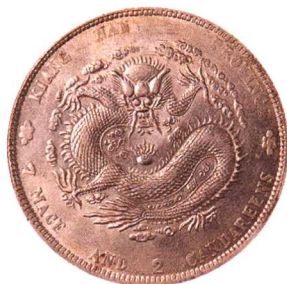
江南省造辛丑(无HAH版)光緒元寶七錢二分 普品 市場參考價:RMB 100 成交價:RMB 110