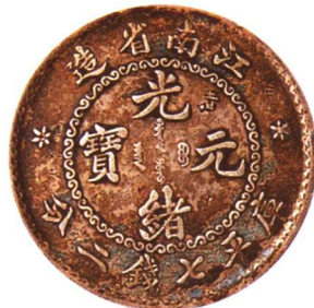
江南省造(老江南)光緒元寶 七钱二分

齿边,少见,面有钱庄打印数处,美品 市场参考价:RMB 2,000 成交价:RMB 8,250