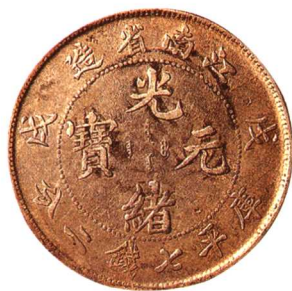
戊戌江南省造光緒元寶 七錢二分 極美品 市場參考價:RMB 1,500 成交價:RMB 2,750