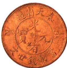
奉天省造甲辰光绪元 宝二十文 黄铜，极美品 市场参考价：RMB 800 成交价：RMB 990