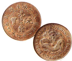
江南省造戊戌光绪元 宝壹钱四分四厘 近未使用至完全未使用 市场参考价：RMB 600 成交价：RMB 1,870