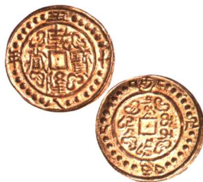
乾隆寶藏五十八年小型銀幣 一枚, 近未使用 市场参考价: RMB 1,000 成交价: RMB 2,200