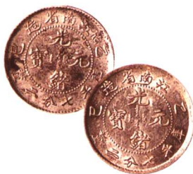
江西省造乙巳光绪元宝 两枚七分二厘 近未使用,一枚美品 市场参考价:RMB 800 成交价:RMB 880