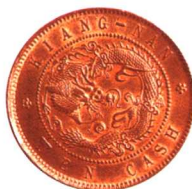
江西省造壬寅光绪元宝 当制钱十文 错配江苏版红铜币一枚,上美品 市场参考价:RMB 1,000 成交价:RMB 3,850