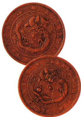
江南省造光绪元宝当十 飞龙合背，红铜，较少见，美品 市场参考价：RMB 1,500 成交价：RMB 5,280