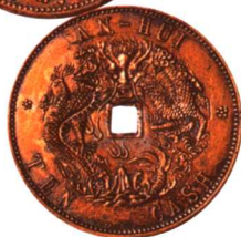
安徽省造光緒元寶十文 中心方孔, 红铜, 极罕见 市场参考价: RMB 80,000 成交价: RMB 88,000