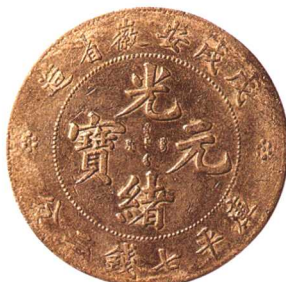
戊戌安徽省造光緒元宝 七钱二分