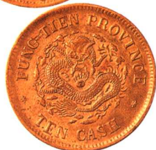
奉天省造甲辰光绪元宝十文 黄铜，极美品，近未使用 市场参考价：RMB 600 成交价：RMB 2,420