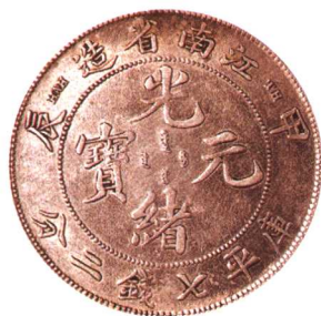
江西省造甲辰光绪元宝 两枚,英文分别为“CH”、“TH”, 极美品 市场参考价:RMB 100 成交价:RMB 1,540