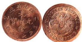
乙巳江南省造光緒元寶 七分二厘

鷹洋邊，極少見，美品 市场参考价：RMB 5,000 成交价：RMB 9,900