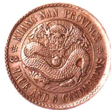
江南省造辛丑光緒元寶 七錢二分 原光, 難得 市場參考價:RMB 1,000 成交價:RMB 6,380