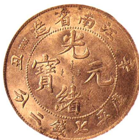
辛丑江南省造光緒元寶 七钱二分