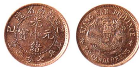
江南省造乙巳光緒元寶 七分二厘