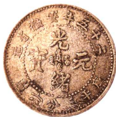
二十五年安徽省造光緒元寶 三分六厘 美品 市场参考价: RMB 500 成交价: RMB 770