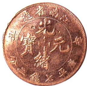
江南省造甲辰光緒元寶 七錢二分 帶原光, 極美品, 至近未使用 市場參考價:RMB 5,000 成交價:RMB 5,500