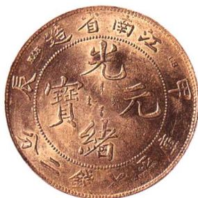
甲辰江南省造光緒元寶 七錢二分