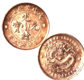
戊戌安徽省造光緒元寶 七分二厘 美品 市场参考价: RMB 500 成交价: RMB 1,100