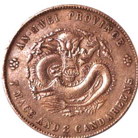
二十四年安徽省造光緒元宝 七钱二分