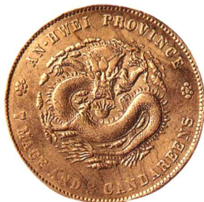
二十四年安徽省造光緒元寶 七钱二分 高四版, 较少见, 美品 市场参考价: RMB 2,000 成交价: RMB 4,180