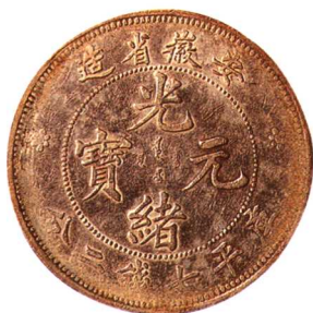
安徽省光緒元宝七錢二分 極美品 市場參考價:RMB 3,500 成交價:RMB 4,180