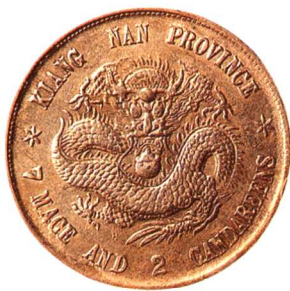
甲辰江南省造光緒元寶 七錢二分 四點花版, 美品 市場參考價:RMB 2,500 成交價:RMB 2,750