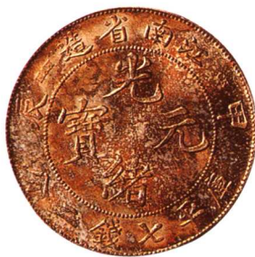
甲辰江南省造光緒元寶 七錢二分 五彩銀光, 完全未使用 市場參考價:RMB 1,200 成交價:RMB 1,980