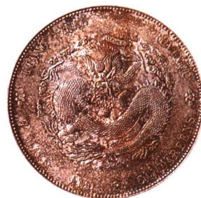
江南省造甲辰光緒元寶 七錢二分 極美品, 至近未使用 市場參考價:RMB 1,600 成交價:RMB 1,760