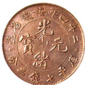
二十四年安徽省造光緒元寶 七錢二分 普品 市場參考價：RMB 3,000 成交價：RMB 3,300