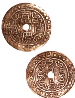
嘉慶寶藏二十五年大型銀幣 一枚, 极美品 市场参考价: RMB 1,000 成交价: RMB 3,630