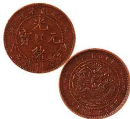
安徽省造光緒元寶五文 红铜, 极美品 市场参考价: RMB 5,000 成交价: RMB 7,700