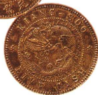
江苏省造光绪元宝五文 黄铜,美品 市场参考价:RMB 800 成交价:RMB 3,520