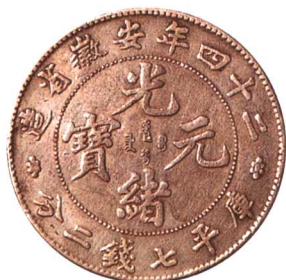
二十四年安徽省造光緒元宝 七钱二分