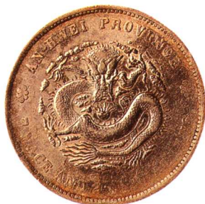
安徽省造光緒元宝七錢二分 美品 市場參考價:RMB 2,500 成交價:RMB 4,620