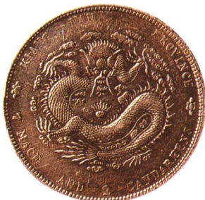
乙巳年江南省造光緒元寶 七钱二分