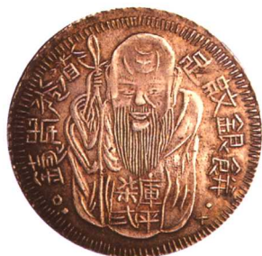
清代台灣道光年造老公銀餅 其中“論”是官府驗證的戳記，非常 少見 市場參考價：RMB 8,000 成交價：RMB 10,120