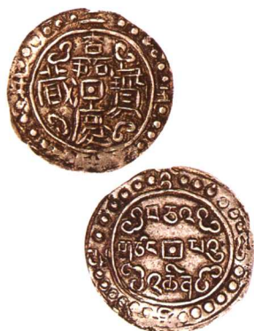
嘉慶二十五年嘉慶寶藏中型 美品 市场参考价: RMB 900 成交价: RMB 990