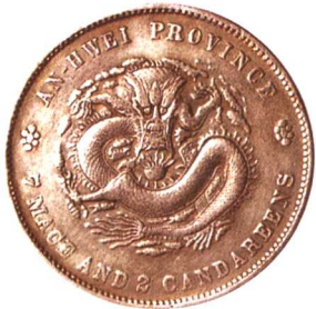
戊戌安徽省造光緒元宝 七钱二分