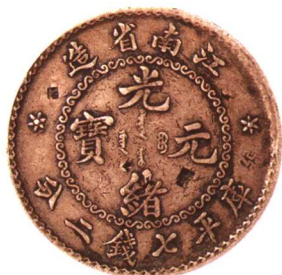
江南省造(老江南)光緒元寶 七钱二分

齿边,少见,面有钱庄打印数处,美品 市场参考价:RMB 2,000 成交价:RMB 8,250