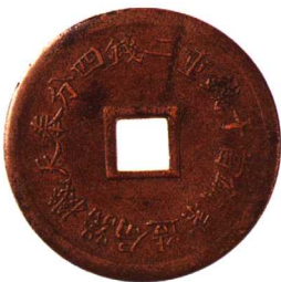
奉天机器局造光绪通宝当十 大字版，红铜，极美品 市场参考价：RMB 800 成交价：RMB 990