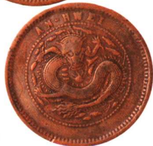
安徽光緒銅元龙紋 合背, 红铜, 普品 市场参考价: RMB 800 成交价: RMB 1,650