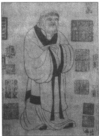
老子像(元代赵孟頫作)

云。”《史记》认定孔子曾向老子请教过关于“礼”的问题，却并未指明老子即老聃。不过根据高亨先生的考证，《礼记·曾子问》载孔子述老聃之言四事，其二事云：“昔者吾从老聃助葬于巷党，及桓，日有食之。老聃曰：‘丘，止柩就道右，止哭以听变’。”而《庄子·天道》篇、《天运》篇、《田子方》篇皆载孔子见老聃的故事，《知北游》篇、《天地》篇又见孔子老子相问答，另外，《吕氏春秋·当染》篇亦记“孔子学于老聃”。可见，《史记》所记接受孔子问礼的老子就是老聃，老子和老聃是一个人。