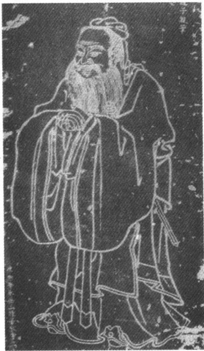
老子像(唐代吴道子作)

且直” ① ，“仲山甫之德，柔嘉维则” ② ，“敬尔威仪，无不柔嘉” ③ 。凡此皆可以说明贵柔的观念并非老子的独创，而是渊源有自。别不一一举证。须要指出的是，老子的思想有其历史的渊源和背景，但他不是抱残守缺，而是不断地加以改造和发挥、创新，从而形成自己的系统和特色，这是他所以能够成为一学派之