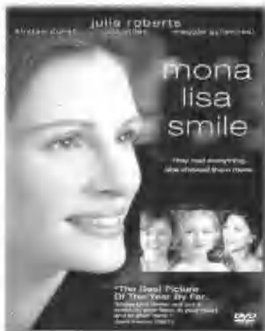
美国电影《蒙娜丽莎的微笑》 ②

六是美女老师。美女从母亲形象中派生出来。她意味着教育除了苦口婆心式的劝说和看护之外,尚需要有浪漫、可观、美感与想象力的介入。受学生欢迎的美女教师并不以性感取胜,她以轻松、欢快、甜美的姿态唤醒学生。在《蒙娜丽莎的微笑》这部教育电影中,那位美女老师让她的一群女学生因她的到来而独立、自尊。