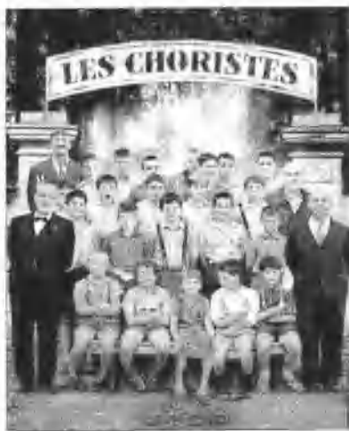
法国电影《放牛班的春天》 ②

一是像父亲一样严而有度的老师。父亲代表了教育中的“强硬派”、“鹰派”。父亲暗示了教育中的纪律、规则、秩序、惩罚甚至严厉的惩罚。没有父亲的教育是不完整的教育,这句话的另一个说法是:没有纪律和惩罚的教育也是不完整的教育。在《放牛班的春天》这部教育电影中,校长是一个严而无度的人,令学生憎恨并且逃跑;音乐老师克莱门特却以他的严而有度的教育方式改变了学生对