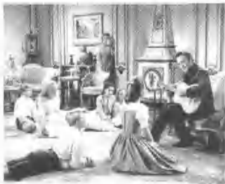
美国电影:《音乐之声》 ②

四是有 宽容精神的老师 。宽容并非教师的专业特征,宽容、接纳、谅解、同情等品质是人类最基本的“生活用品”。对教师来说,宽容意味着容忍学生的错误并对学生的错误持守望和等待的心态。如果孩子生活在教师的挑剔中,他长大之后,就学会了指责和抱怨。