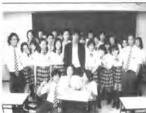
日本电影:《麻辣教师》 ①

在《麻辣教师》这部教育电影中,鬼塚英吉是一位代课教师。他受到学校老师和学生的排挤,几次面临被开除的威胁。但是,他每次都能化险为夷,用他那独特的教学方法赢得学生的爱戴,成为一个有特殊魅力的教师。