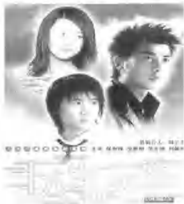
电影《十八岁的天空》 ①

仅需要严厉和智慧,而且需要激情与欢乐。人的长相多半由遗传决定,但激情、欢乐等精神品格与遗传没有太多的关联。长相好的男人并不见得就有出息,但他所暗示的激情与欢乐感是儿童成长的点心。