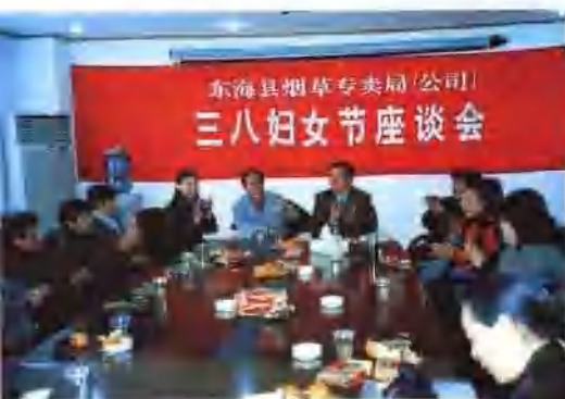
三八妇女节座谈会