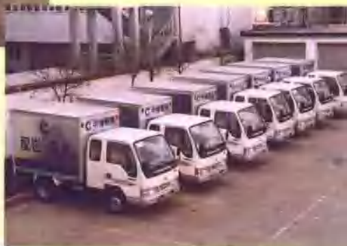
送货车辆标志统一