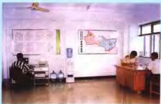
基层稽查中队办公场所