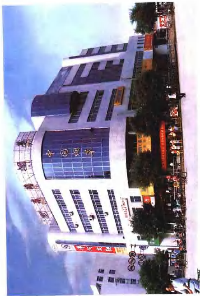
矗立在繁华地段的东海烟草大楼