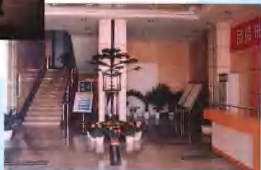
优美的办公楼大厅