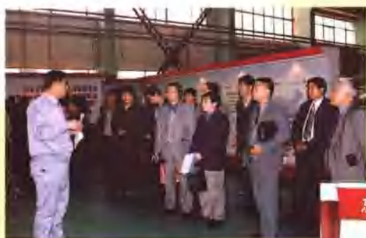
参观大连三洋企业文化