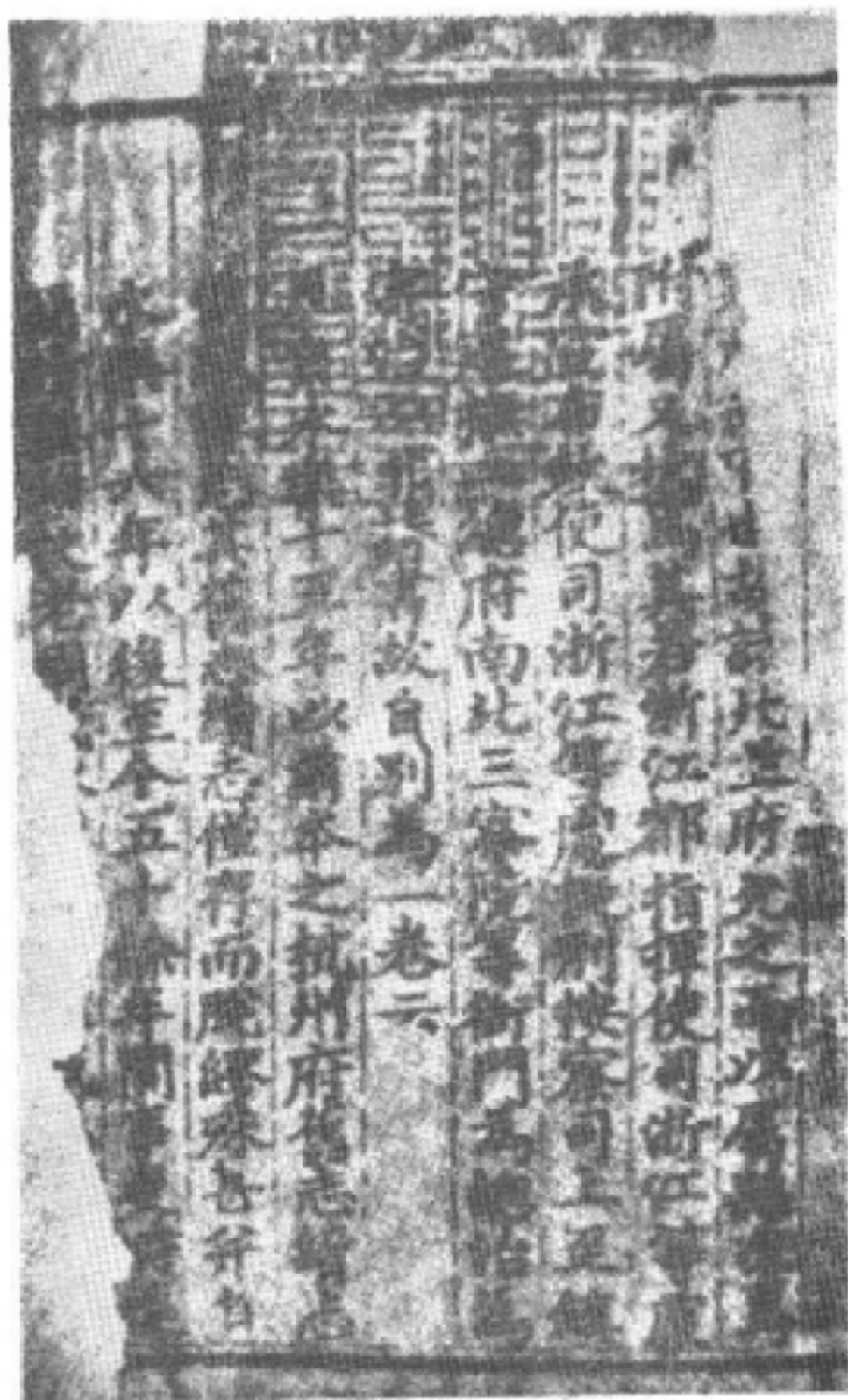
成化《杭州府志》书影