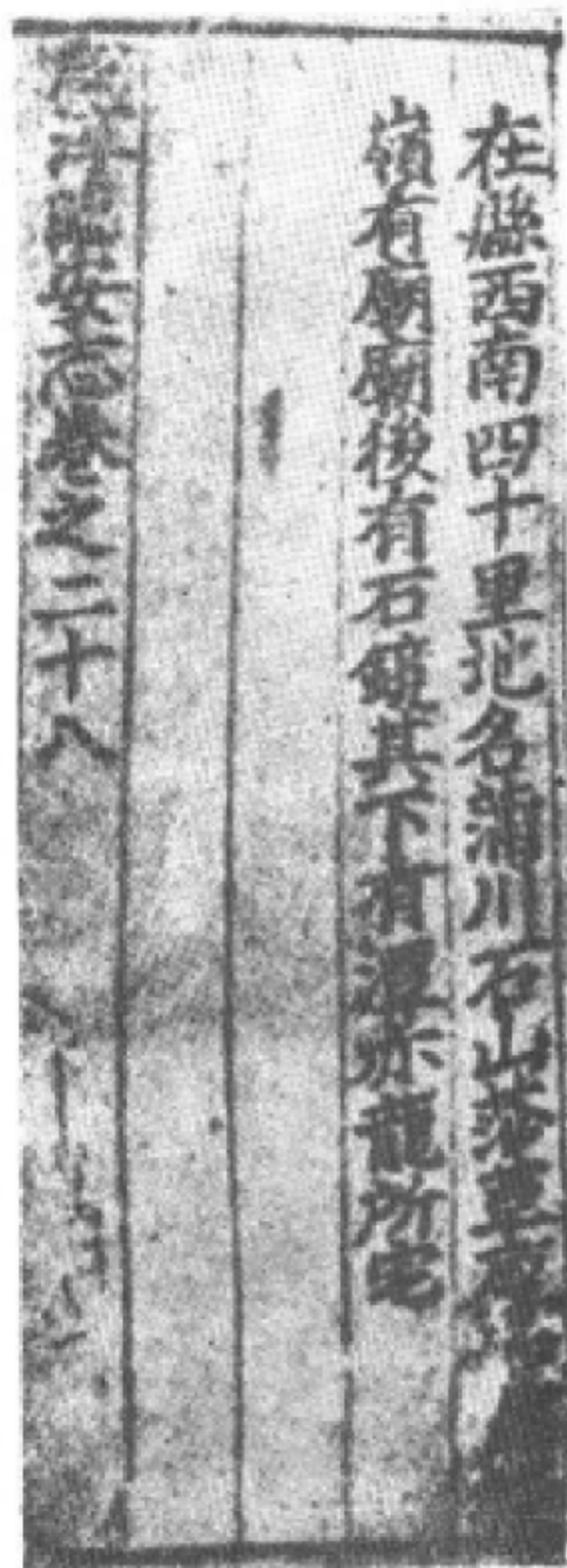
咸淳《臨安志》卷二十八書影