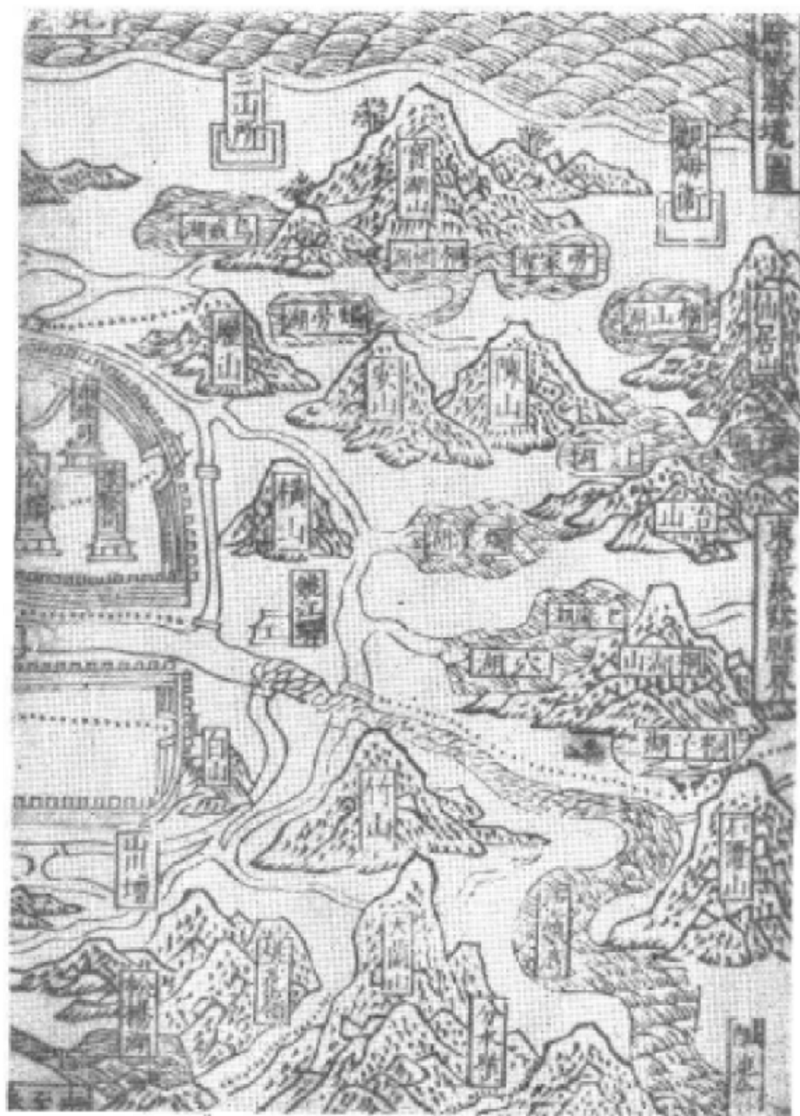
万历《绍兴府志》余姚县境图书影