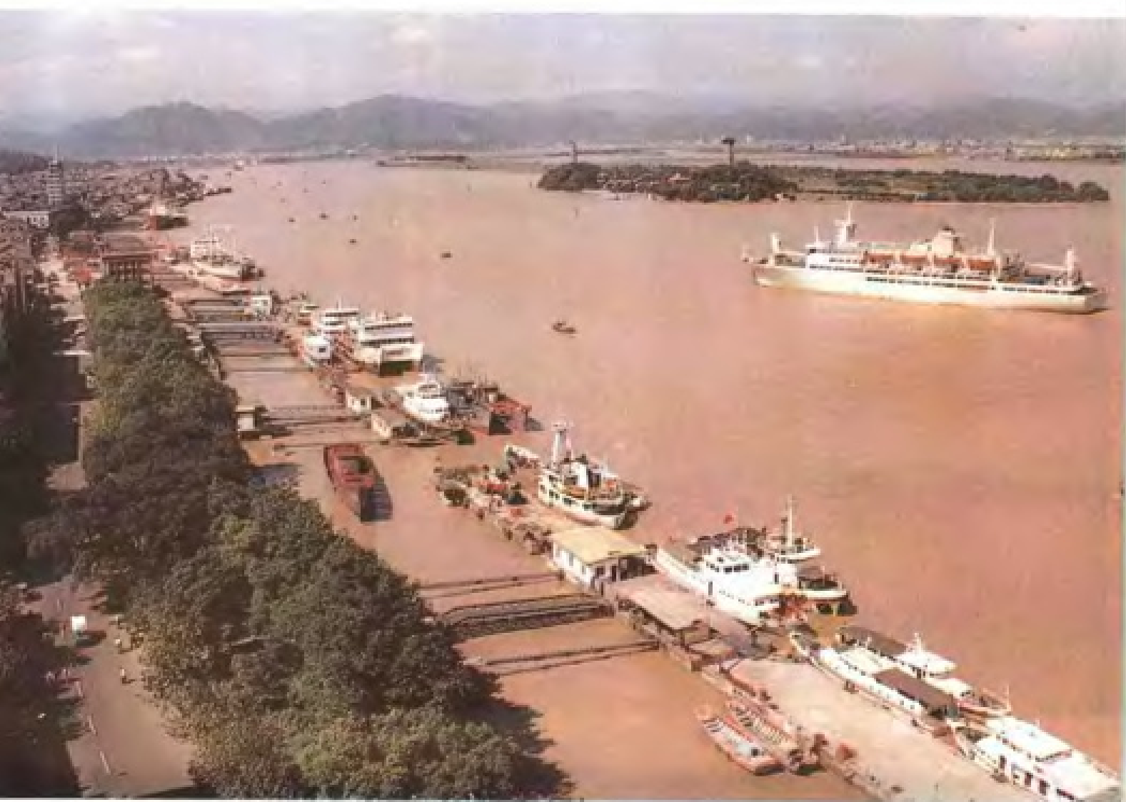
温州港朔门老港区新貌