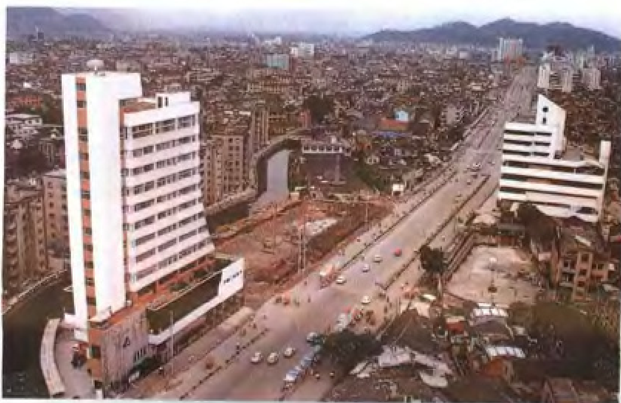
扩建中的雁城区人民路