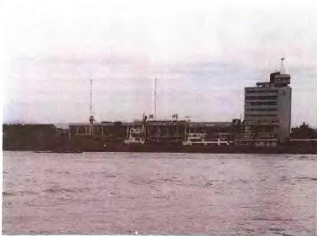
温州港务局客运站