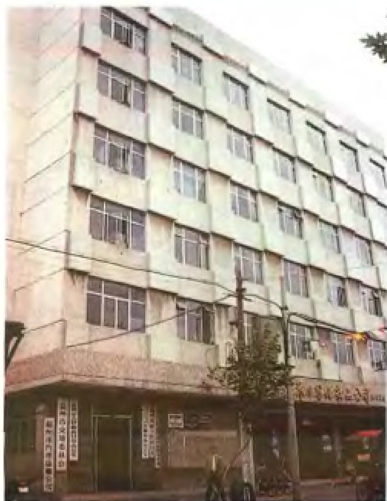
温州市交通委员会大楼