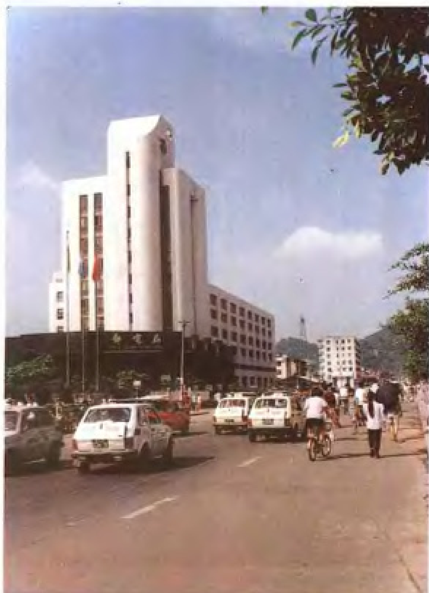
温州邮件处理中心