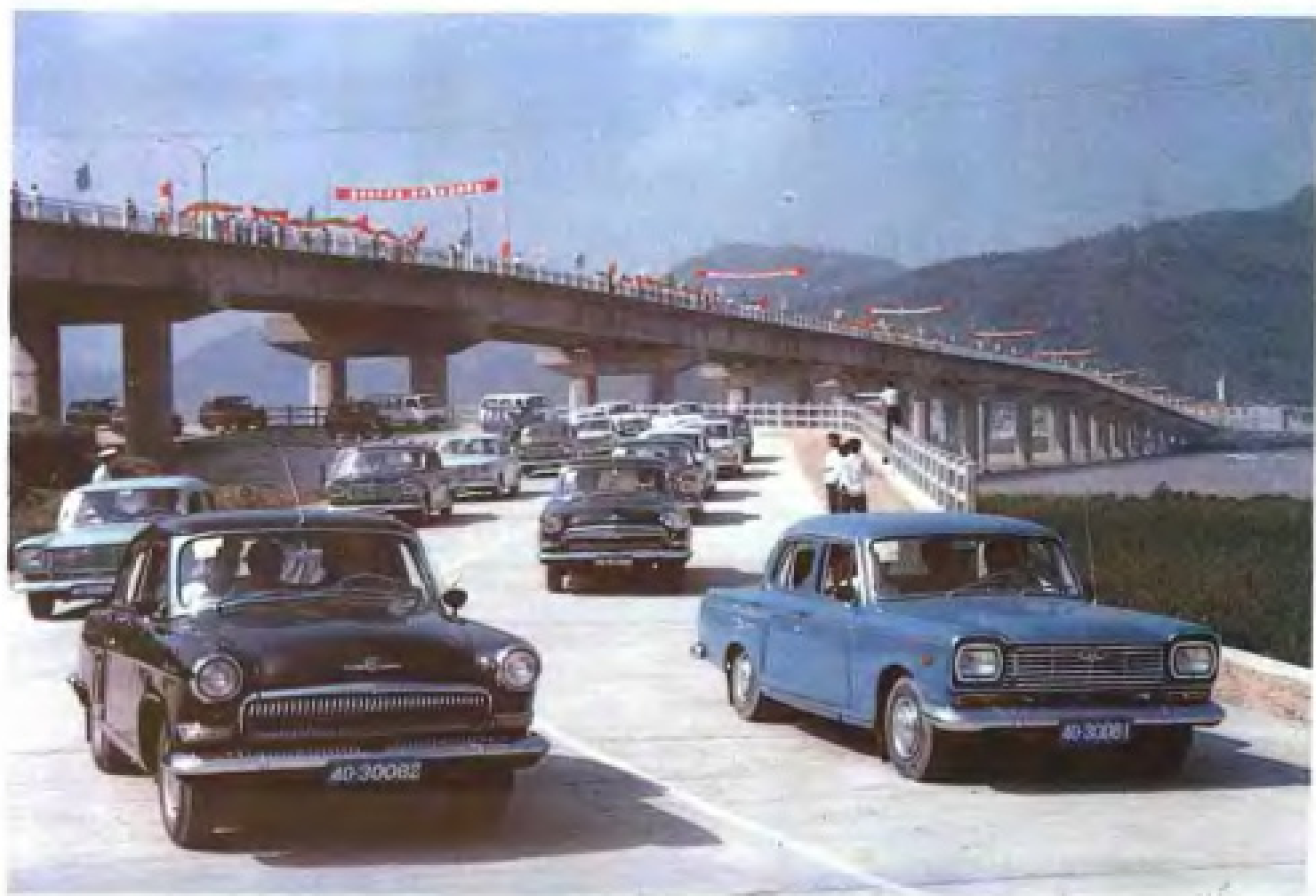
温州瓯江大桥通车典礼