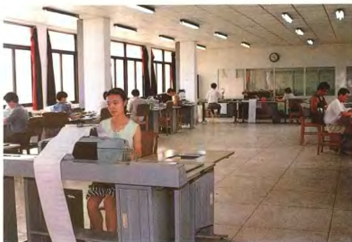
温州市邮电局报房