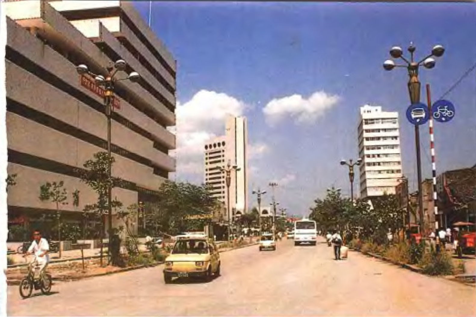
扩建中的鹿城区人民东路