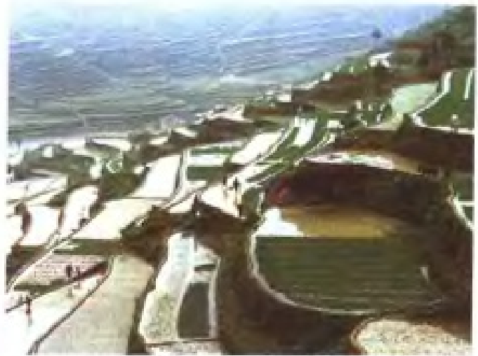
瓯海区五凤洋梯田一角