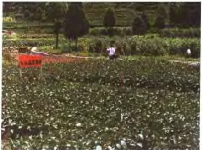
瓯海区高山蔬菜基地