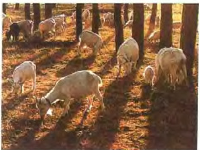
瓯海区洋胜牧场一角