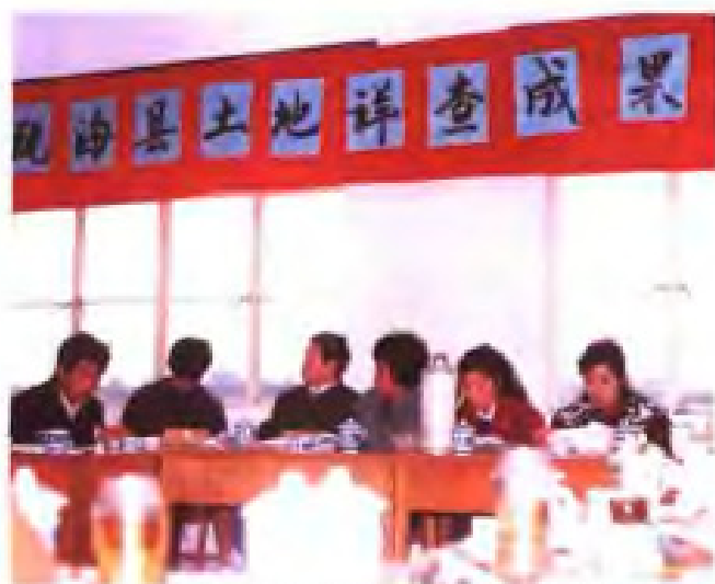
1992年11月23日，瓯海区召开土地详查验收鉴定会