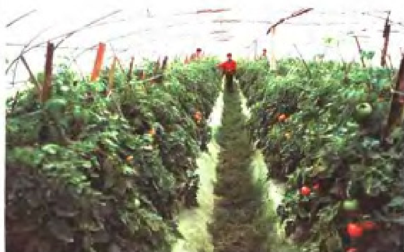
瓯海平原蔬菜基地