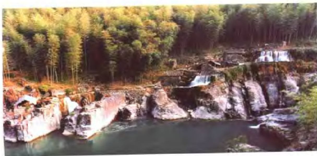
涇海澤雅毛竹林风光