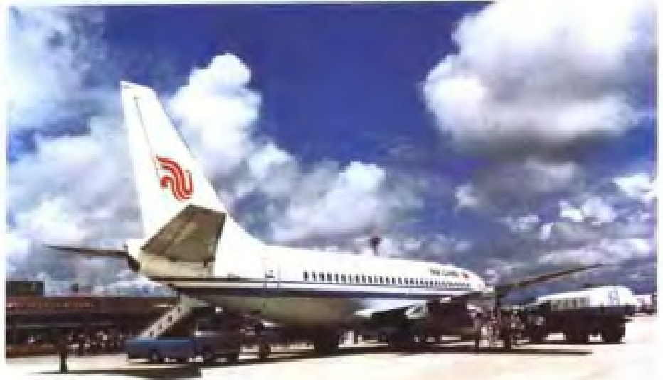
瓯海家强——温州机场一角