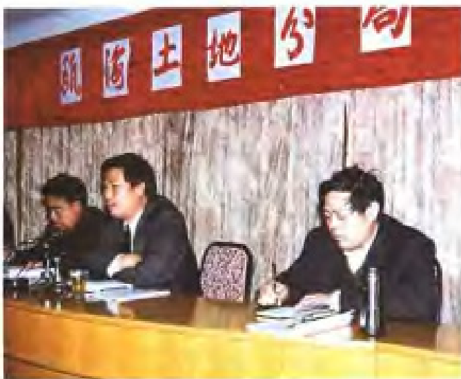
瓯海土地分局召开土地管理工作会议