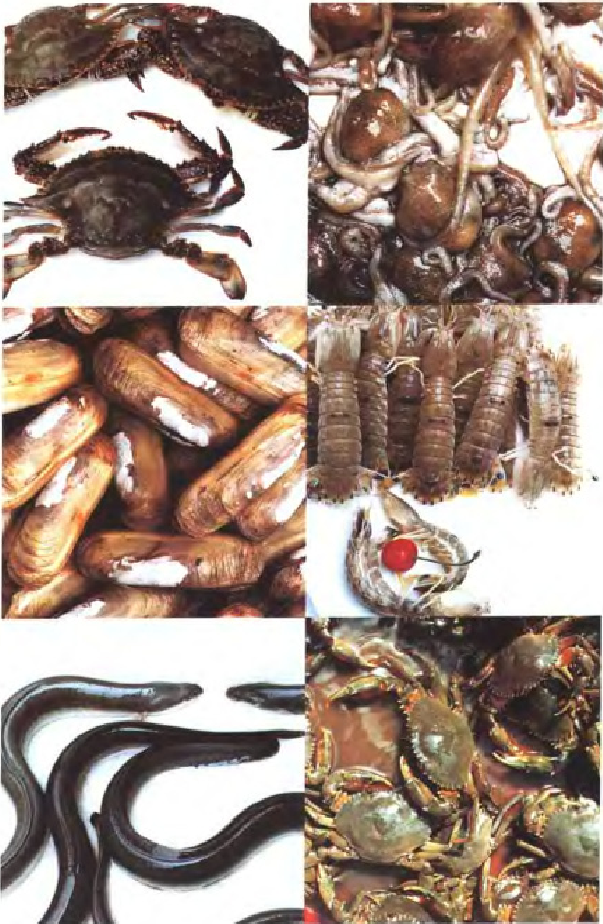
瓯海区部分水产品