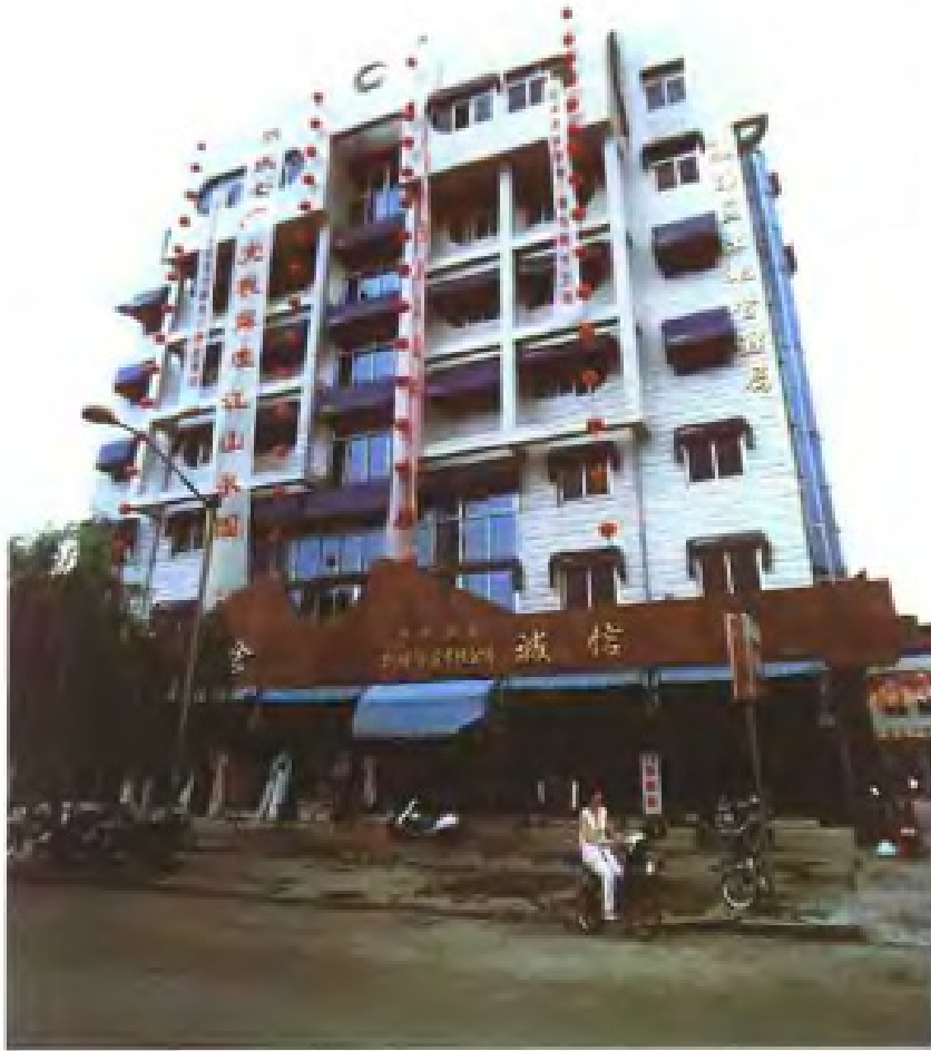
瓯海土地管理分局办公楼