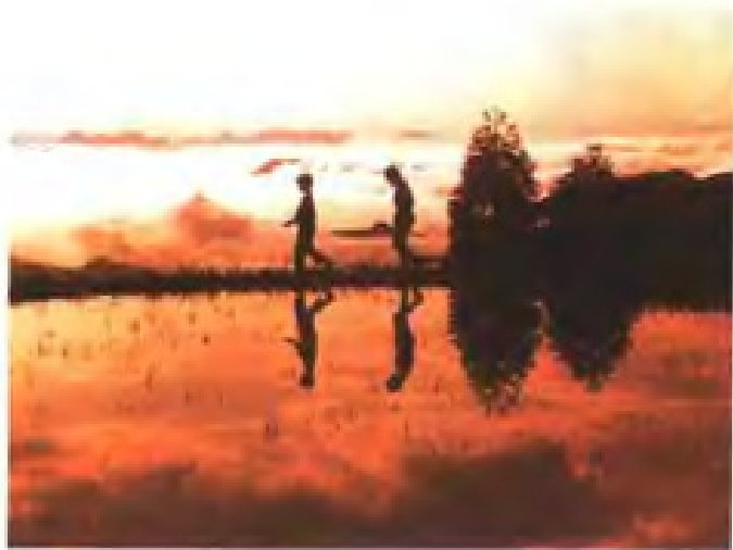
瓯海岙底乡高山水田