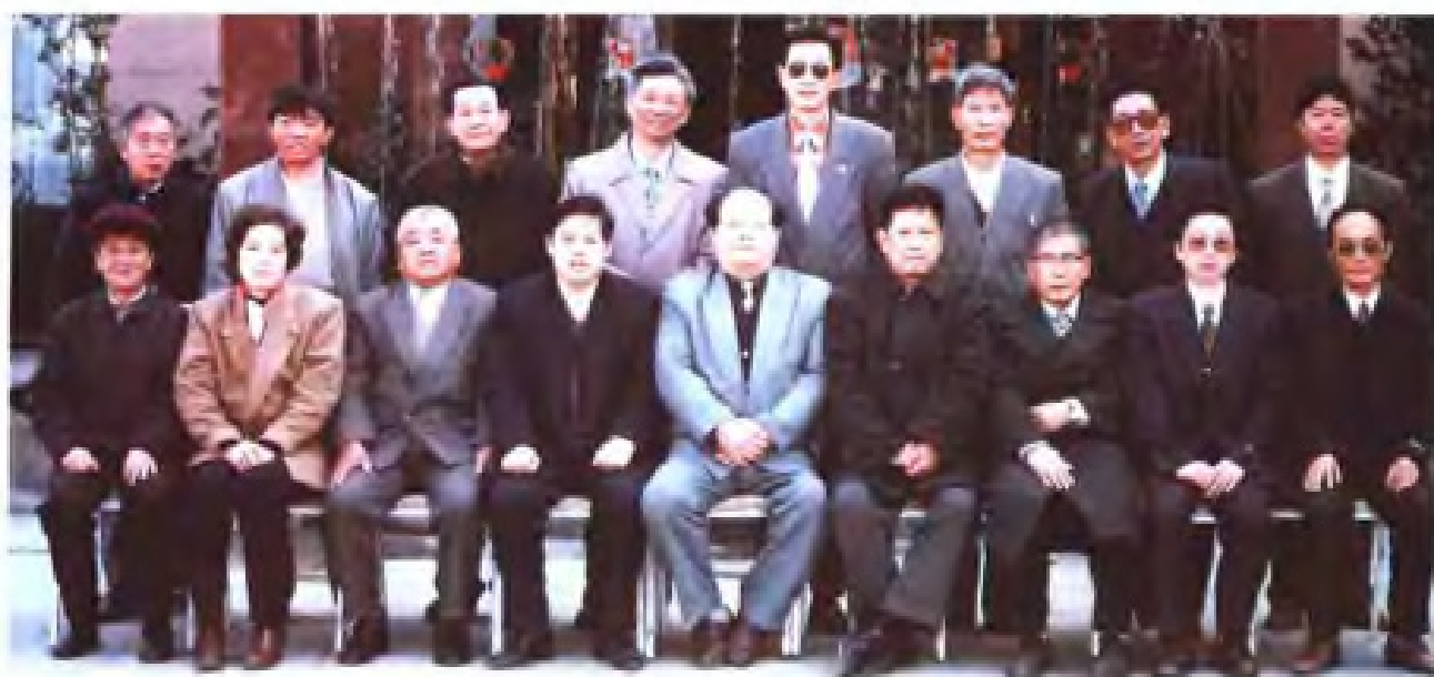
1998年元月7日，参加瓯海区土地志评审会人员合影