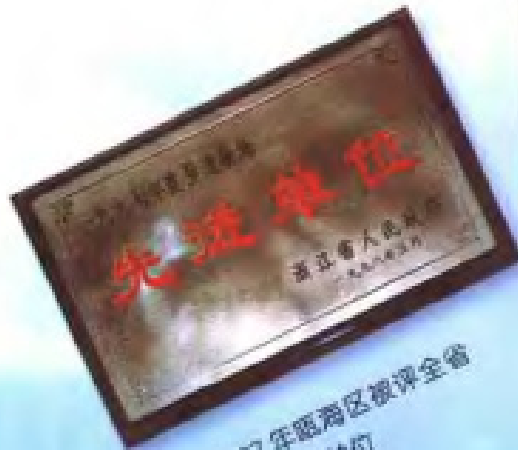
1997年甌海区被评为全省 垦造耕地先进单位