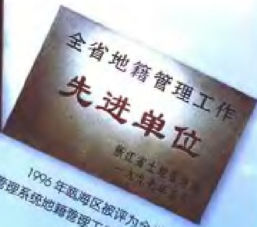
1996年甌海区被评为全省土地 管理系统地籍管理工作先进单位