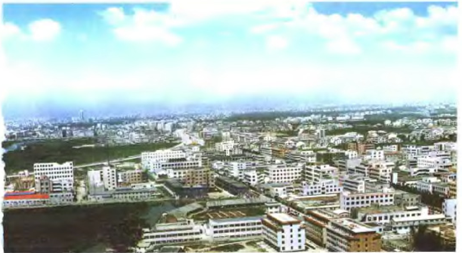
浙江省瓯海经济开发区一角