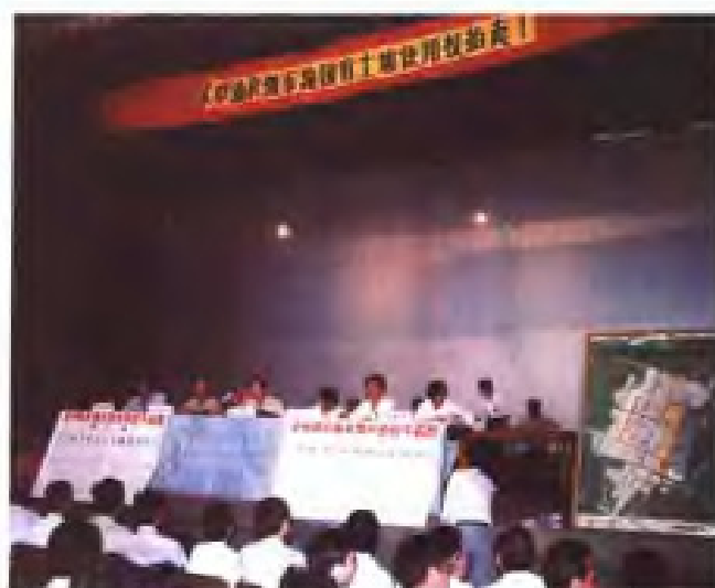
1993年6月18日，区政府在永中镇举行首次国有土地使用权拍卖会