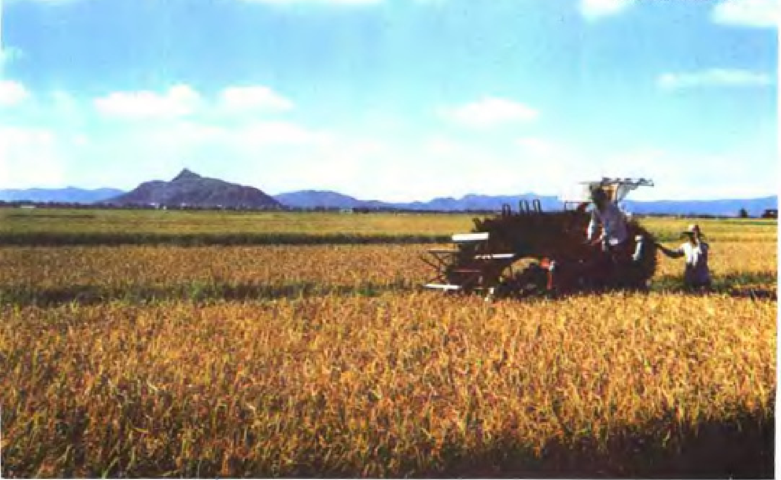
甌海区现代农业园区