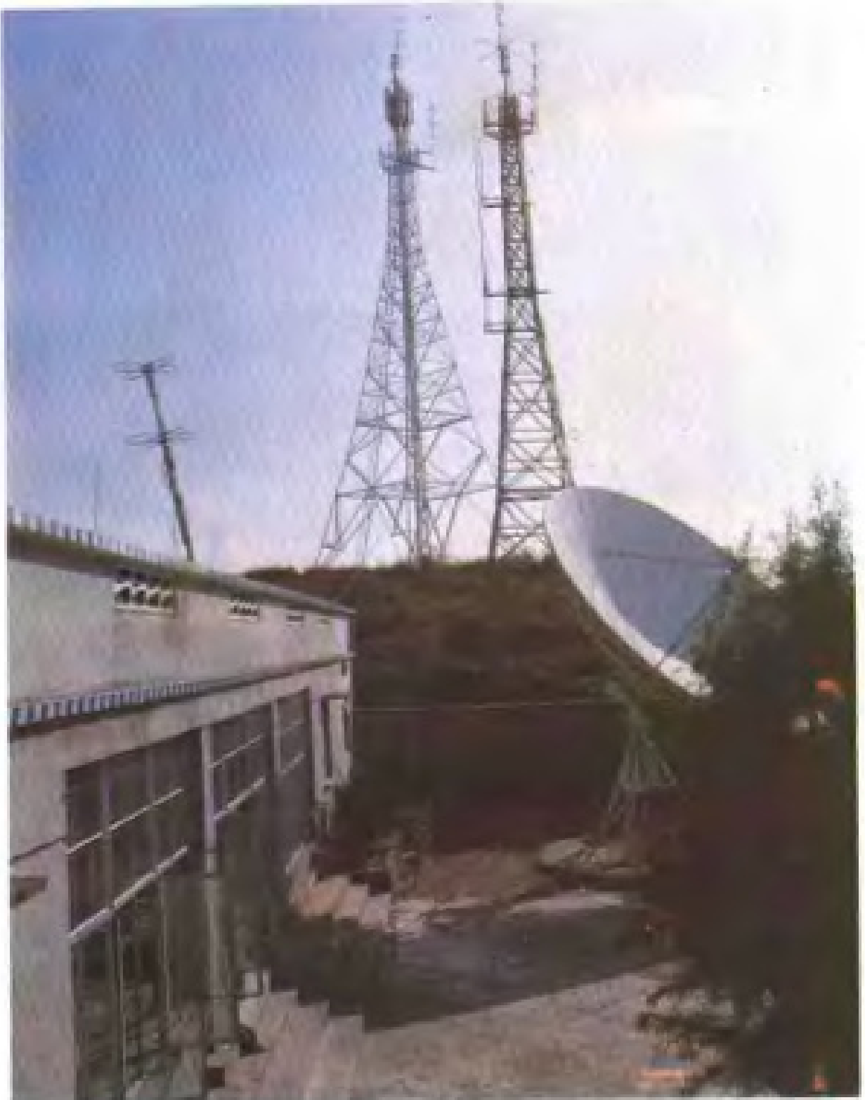
▲ 宁海杜鹃山电视转播台