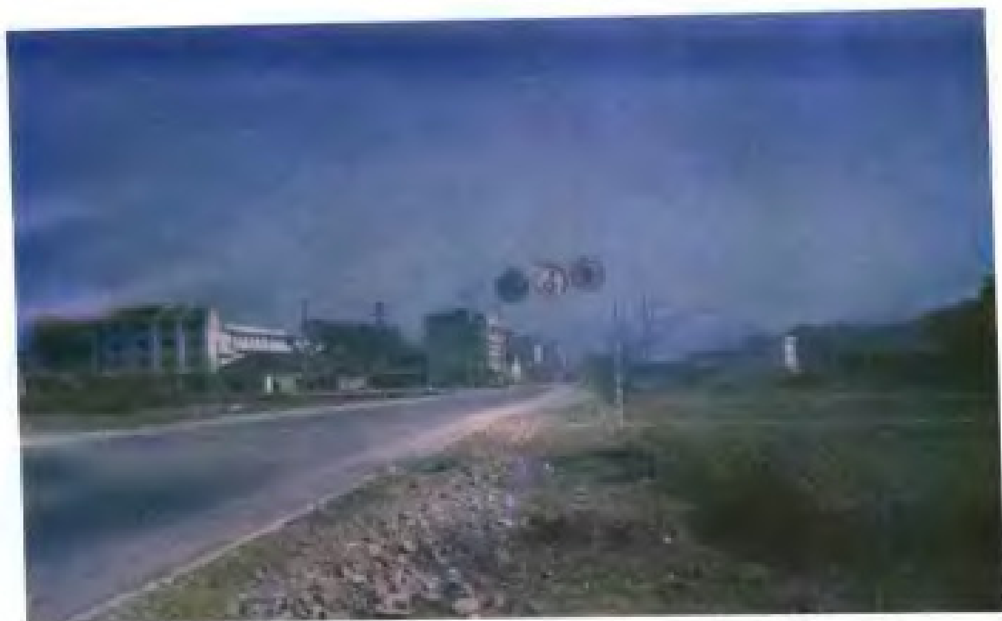
龙后公路 0K+060 段