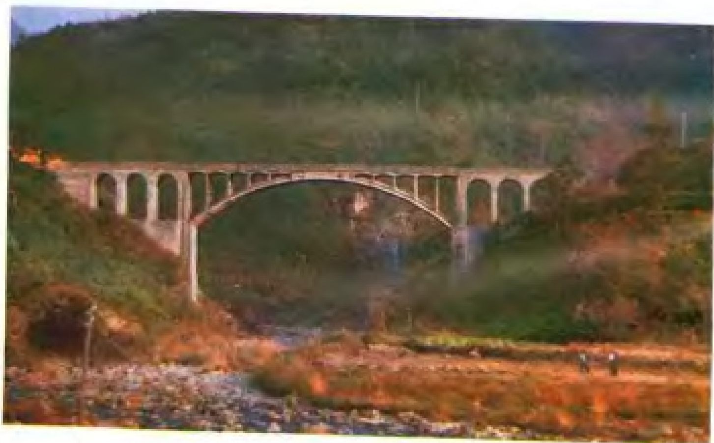
大赤公路鲤鱼大桥