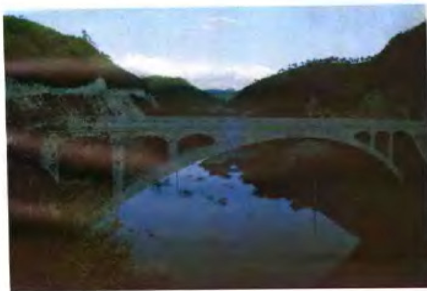
沿库公路管村大桥