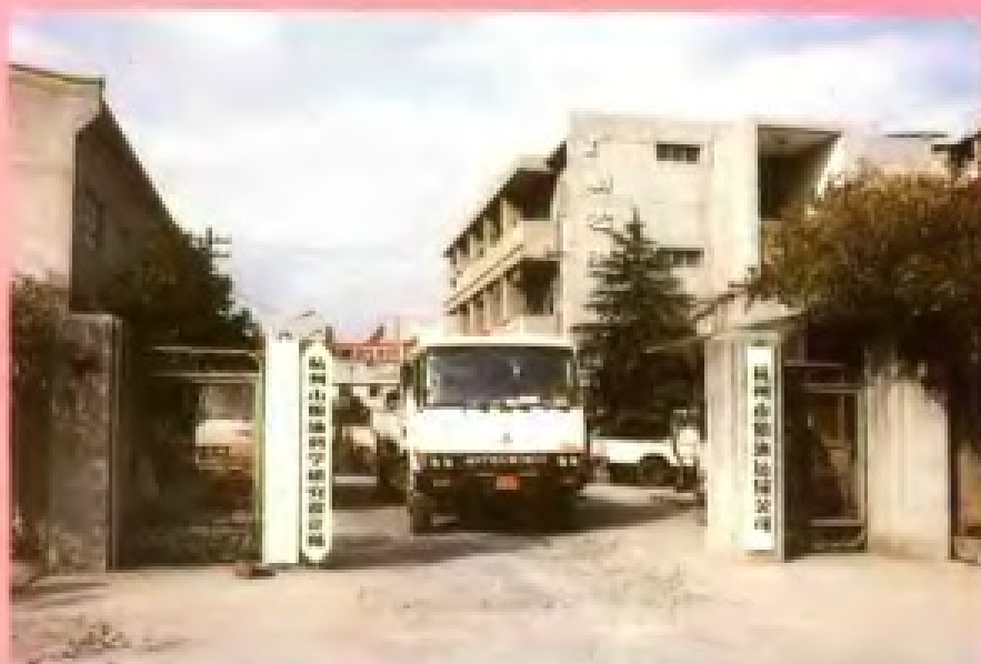
杭州市粮油运输公司 杭州市粮油科学研究设计所