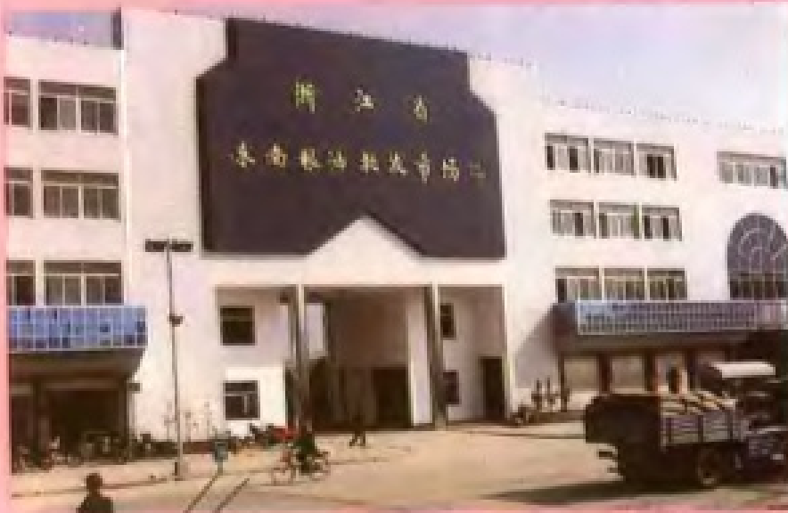
萧山市粮油总公司 东南粮油批发市场