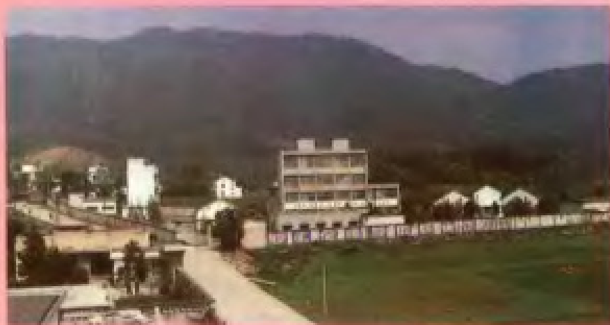
富阳预混合饲料厂