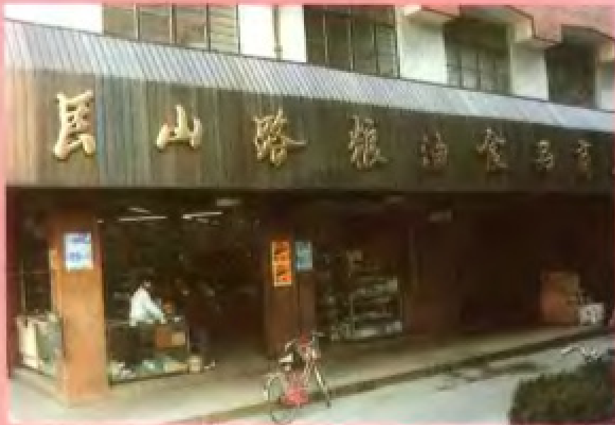
江干区粮食公司 良山路粮油食品商店