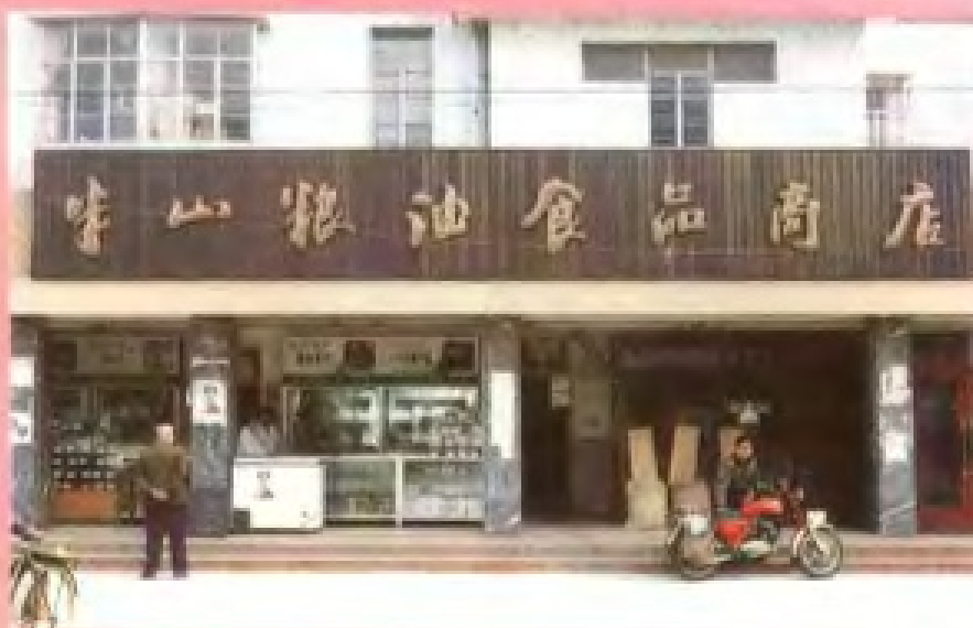
拱墅区粮食局 半山粮油食品商店