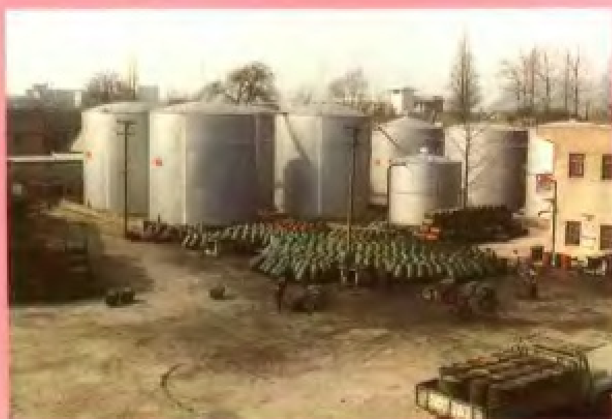
杭州市油脂公司油库