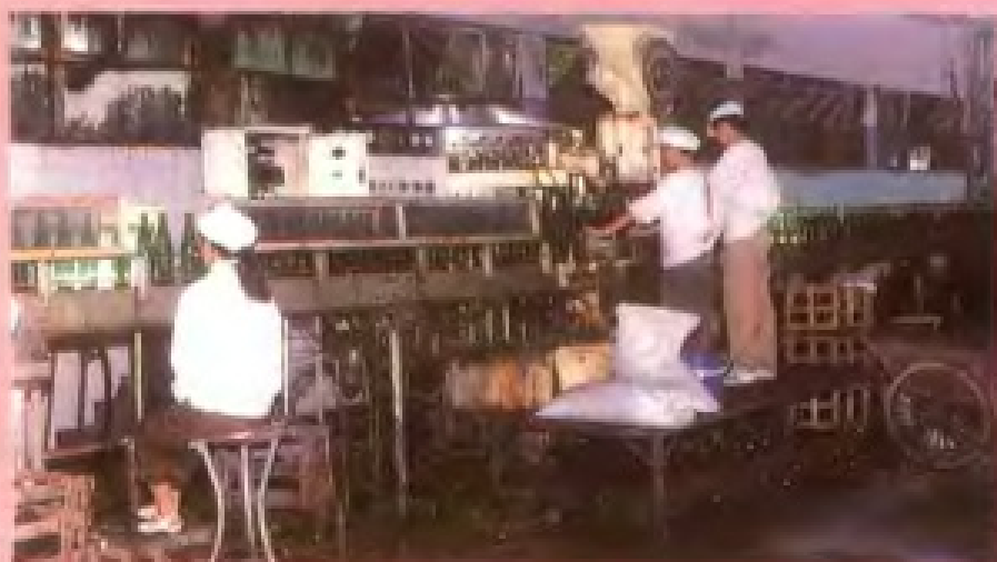
桐庐啤酒厂灌装线