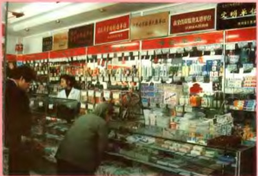
西湖区粮食局 松木场粮油食品商店