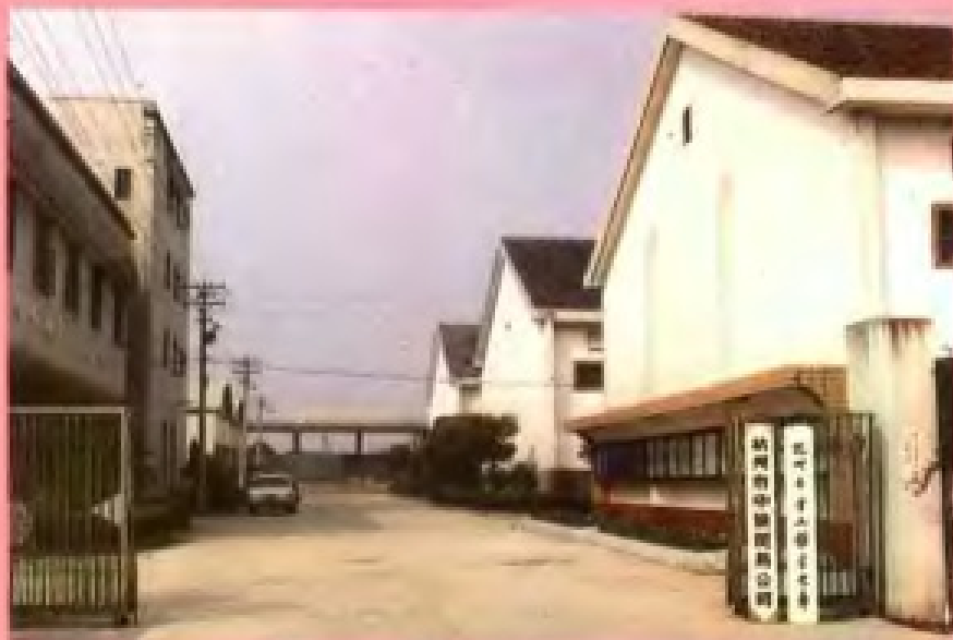
杭州市半山粮食仓库