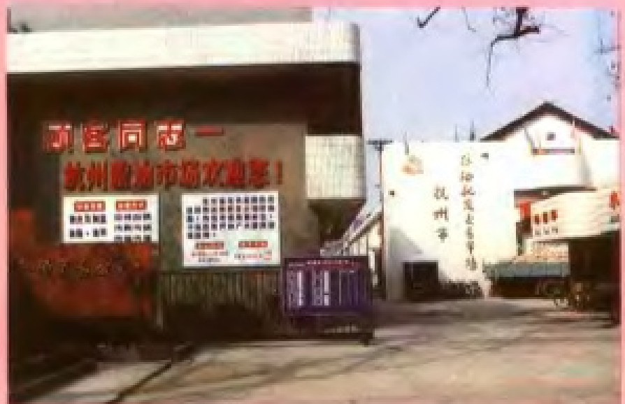
杭州市粮油贸易公司 杭州市粮油批发交易市场