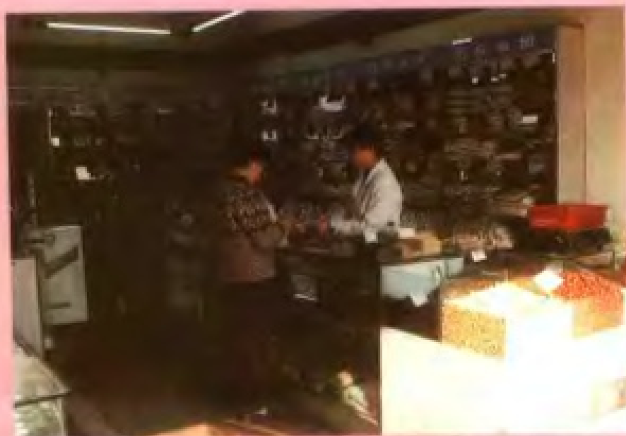
上城区粮食公司中山粮油贸易商行