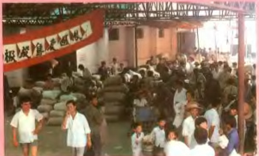
余杭县农民积极交售定购粮