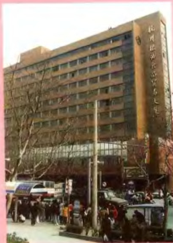
杭州粮油食品贸易大厦 (杭州市粮食局办公楼)