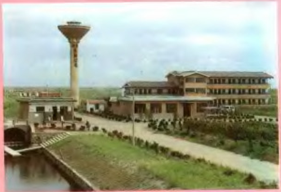
萧山市粮食局龙翔公司