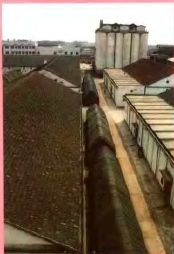
杭州市南星桥粮食仓库