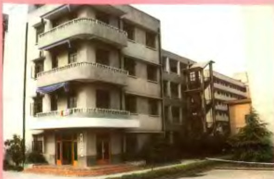
杭州粮食干部学校