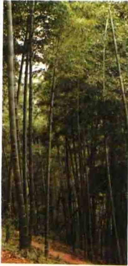
慈溪县国营林场毛竹林