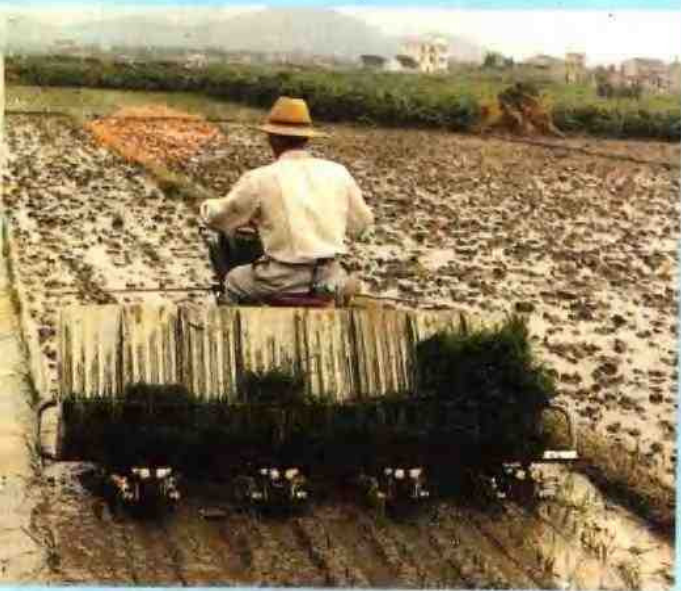
横河镇相土地村用机动插秧机插早稻