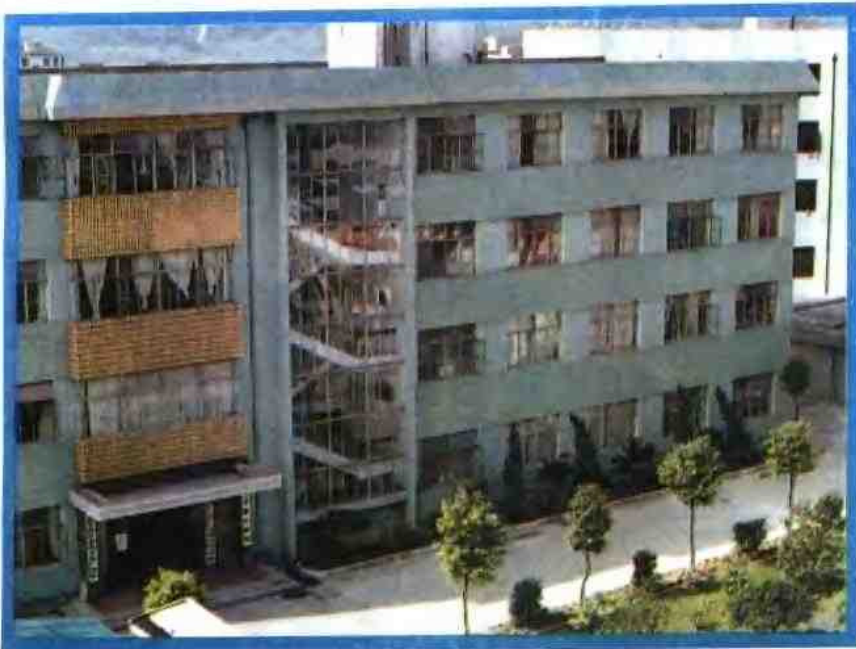
慈溪市农林局办公大楼