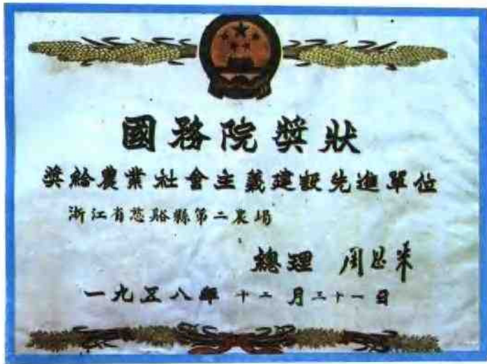
国务院颁发的奖状