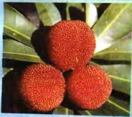
茅芥种中选出之特早熟 杨梅品系——早芥蜜梅