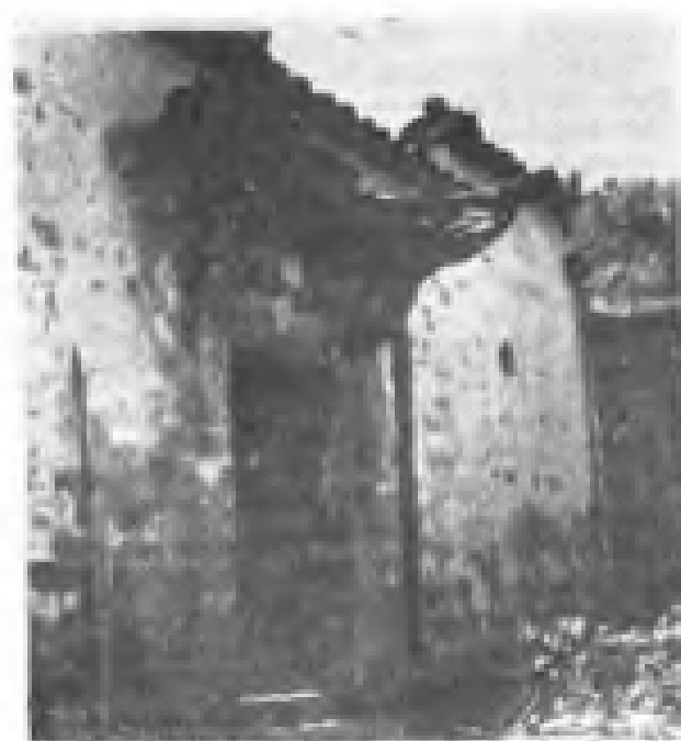
浙江省苏维埃活动旧址