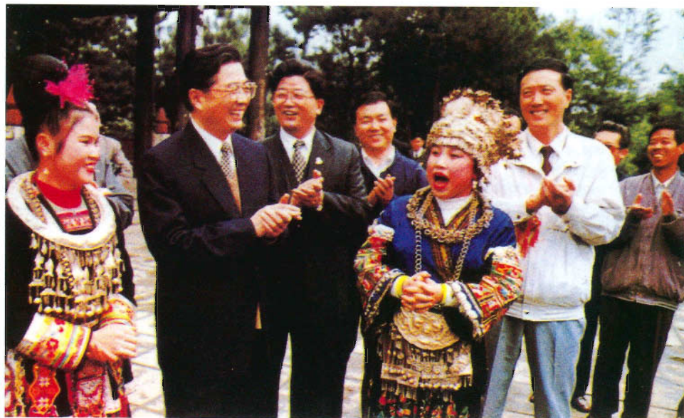
苗族、侗族群众唱起山歌迎接胡锦涛副主席