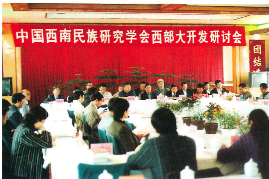
中国西南民族研究学会西部大开发研讨会