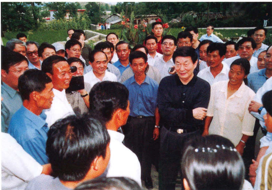
朱镕基总理视察贵州民族地区