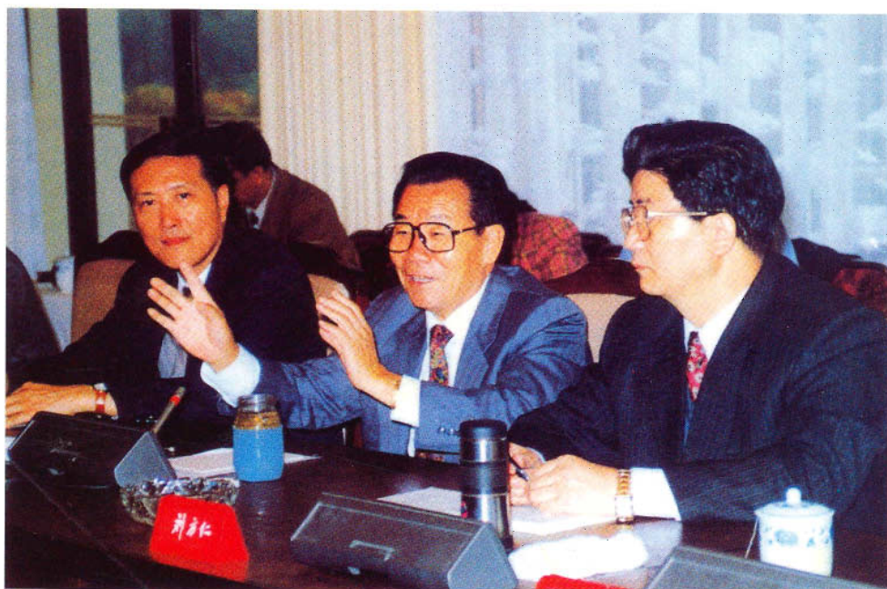
刘方仁书记、陈士能省长陪同全国政协主席李瑞环同志视察贵州