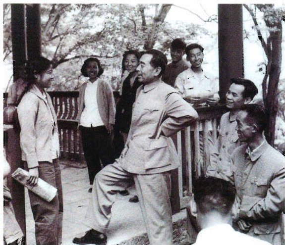
周恩来总理与贵阳市黔灵小学教师亲切交谈