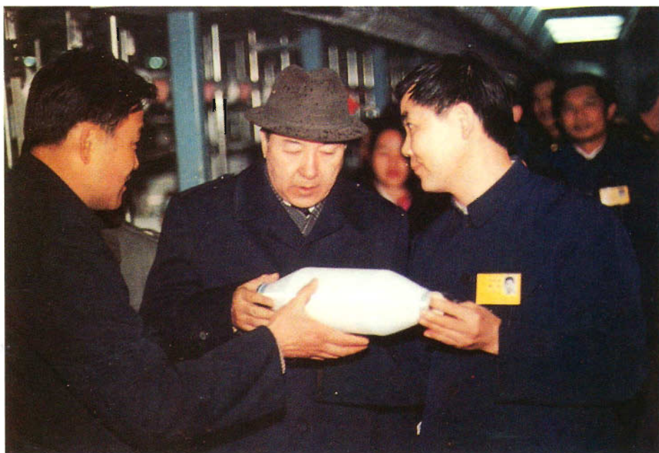
国家民族事务委员会主任司马义·艾买提视察黔东南苗族侗族自治州漆纶厂