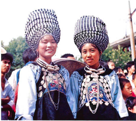
苗族东部方言服饰