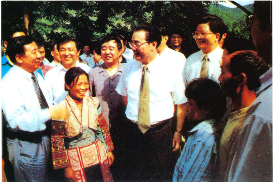
李鹏委员长看望息烽县河坎村苗族贫困农户，刘方仁书记、吴亦侠省长陪同