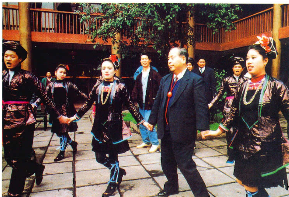
中纪委书记尉建行同志与贵州侗族群众共舞欢歌