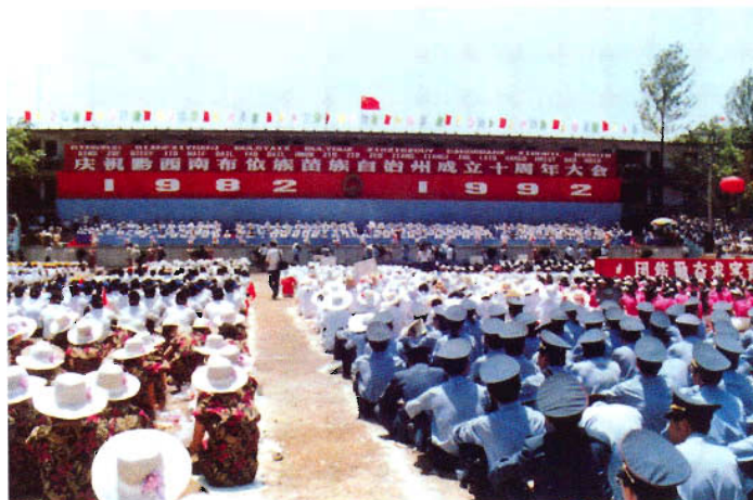
黔东南布依族苗族自治州成立10周年庆祝大会