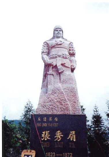
苗族起义领袖张秀眉塑像