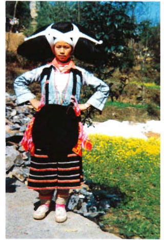
苗族西部方言服饰