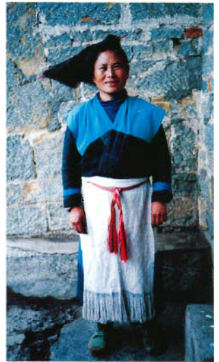
苗族西部方言服饰