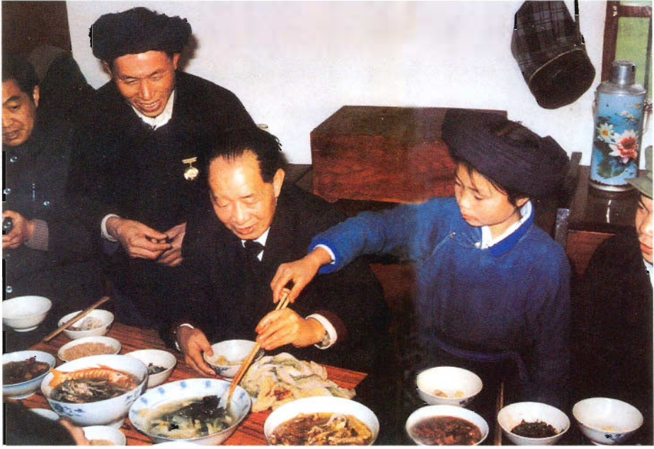
胡耀邦总书记在兴义布依族农民家共度除夕