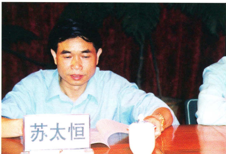
贵州省民族宗教事务委员会主任苏太恒作工作报告