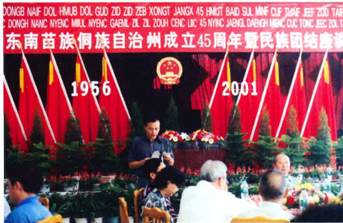
黔东南苗族侗族自治州成立45周年庆祝大会