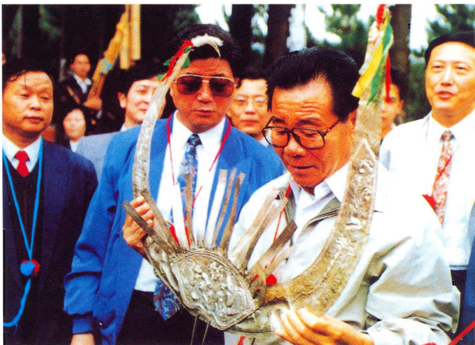
全国政协主席李瑞环同志视察红枫湖景区时观看苗族银饰