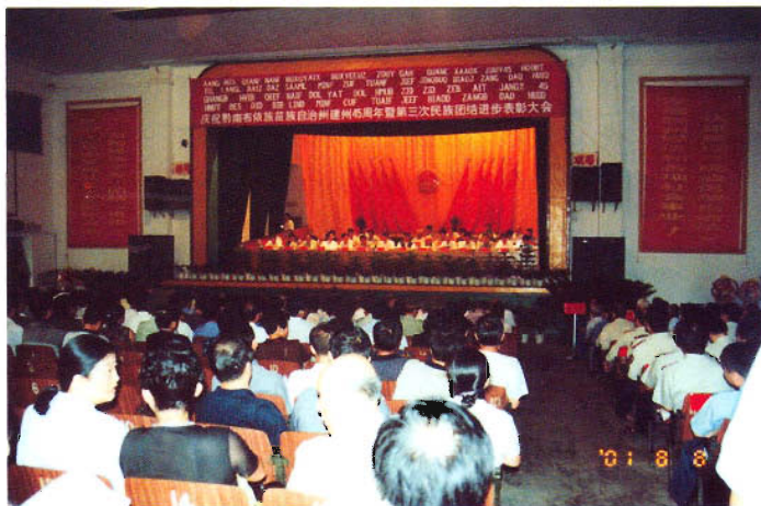
黔东南布依族苗族自治州成立45周年庆祝大会