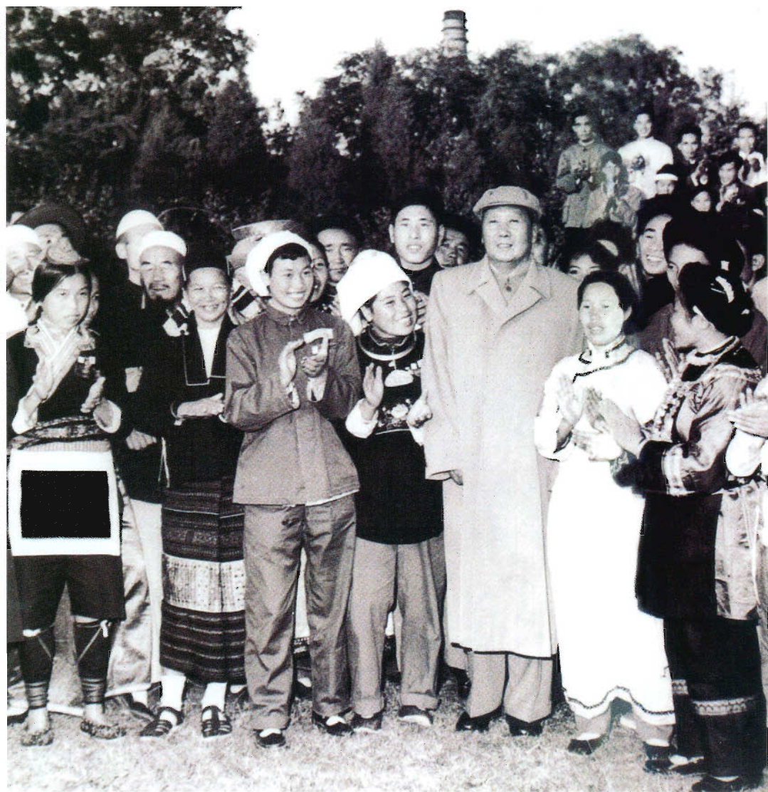
毛泽东主席在中南海接见贵州少数民族参观团