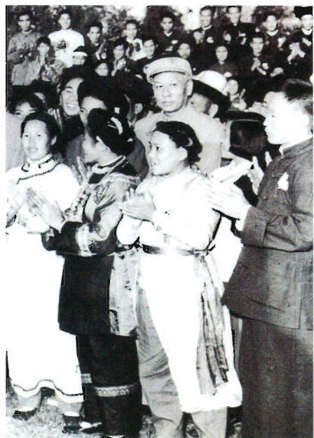
刘少奇主席接见贵州少数民族参观团