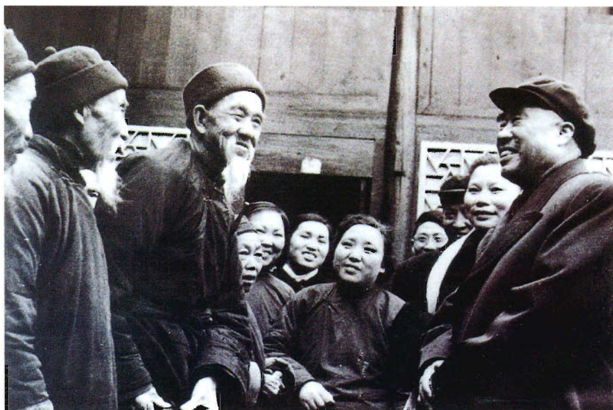
朱德委员长在贵阳花溪与布依族老人交谈