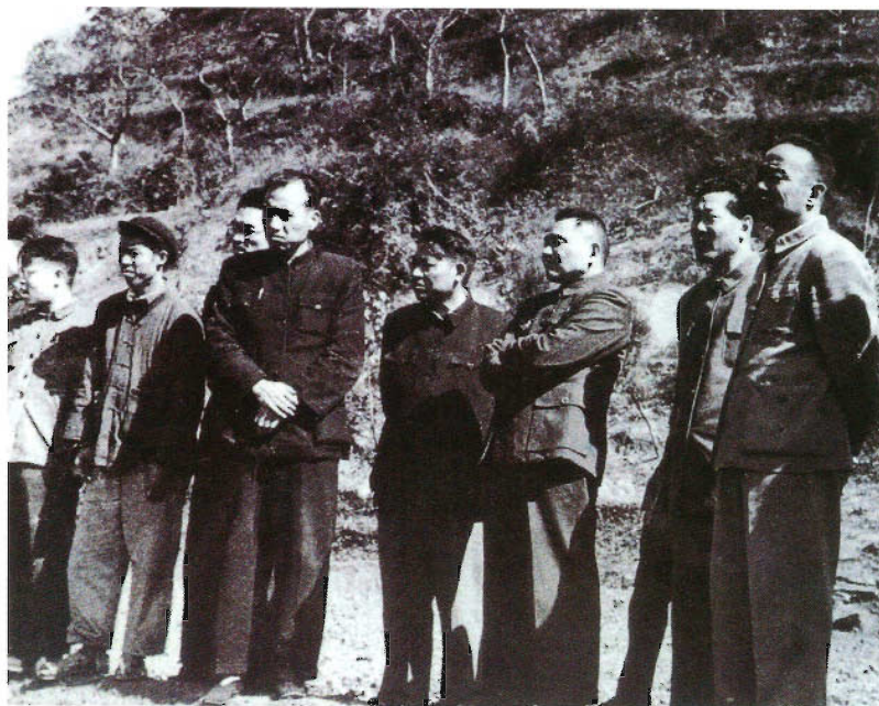
邓小平同志视察贵州民族地区