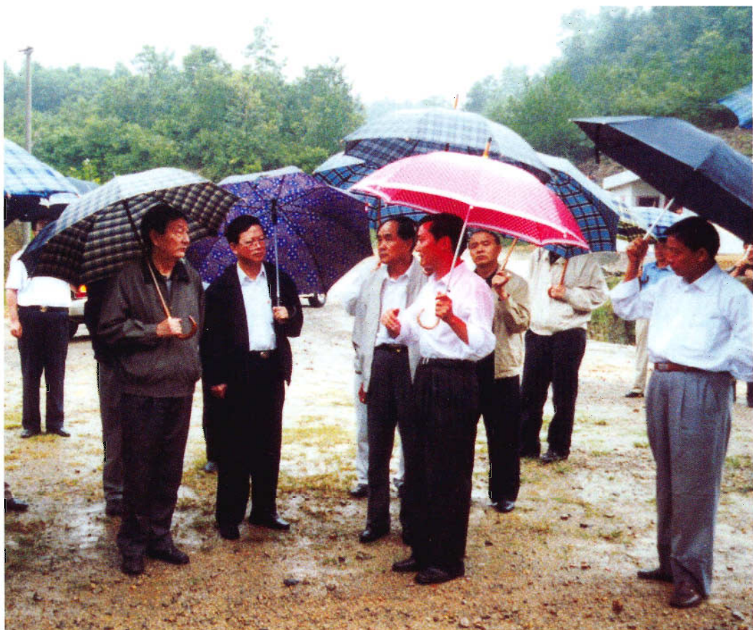
钱运禄书记、石秀诗省长陪同朱镕基总理视察贵州民族地区