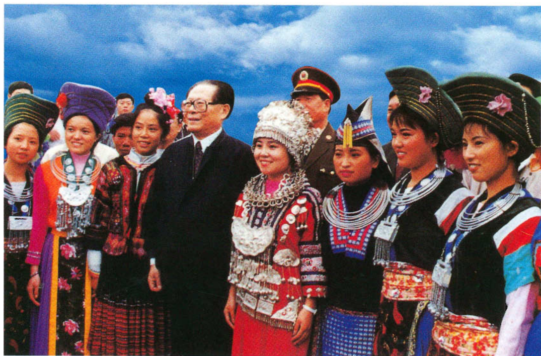
江泽民总书记与贵州少数民族群众在一起