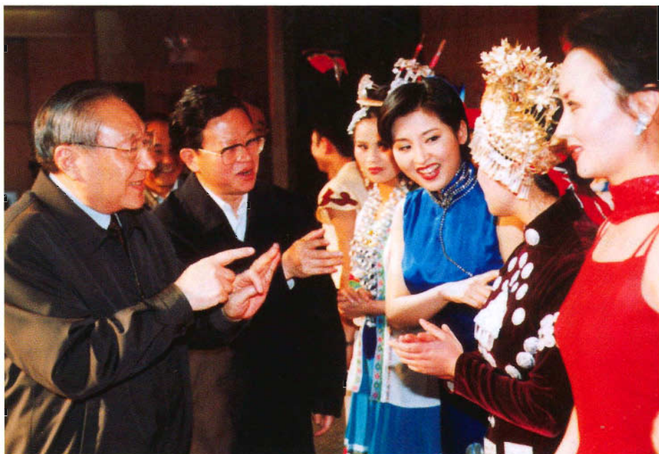
李岚清副总理接见贵州民族歌舞演员