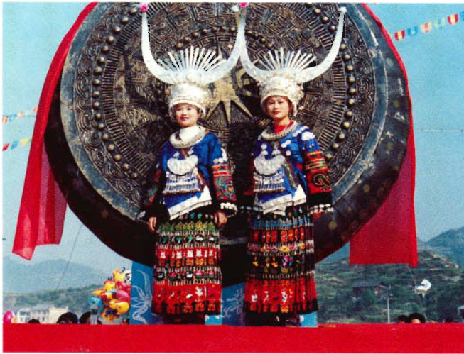
苗族中部方言服饰