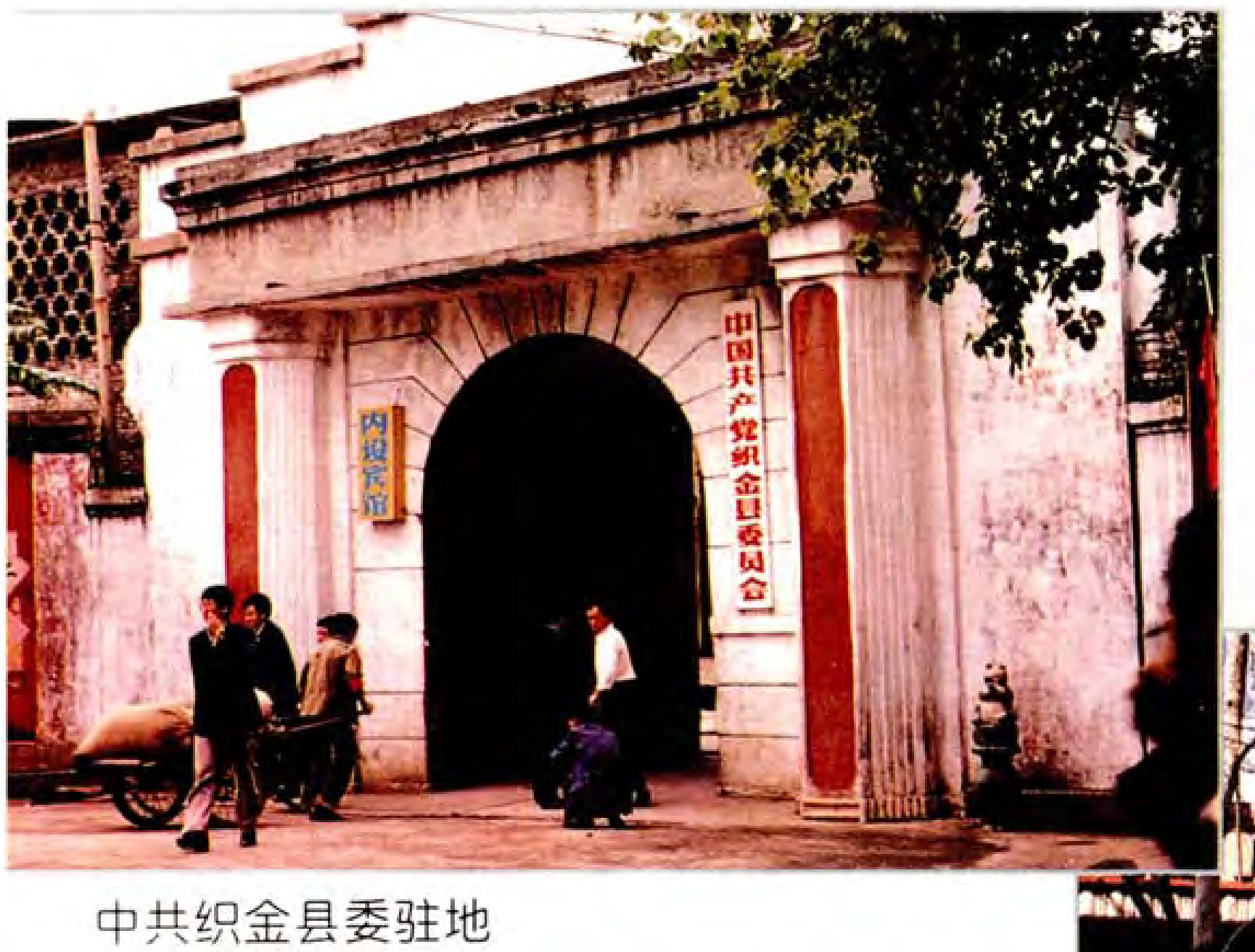
中共织金县委驻地