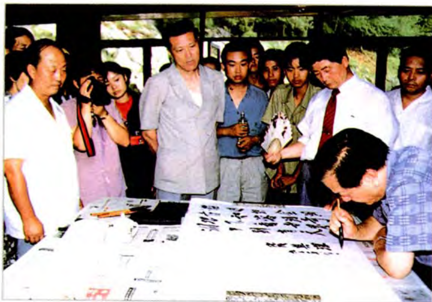
1994年8月10日国务院副总理 钱其琛(右前一)视察织金时为织金 洞题词