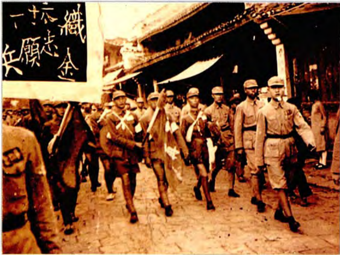
1939 年 10 月 1 日织金县 38 名志愿兵 开赴抗日前线