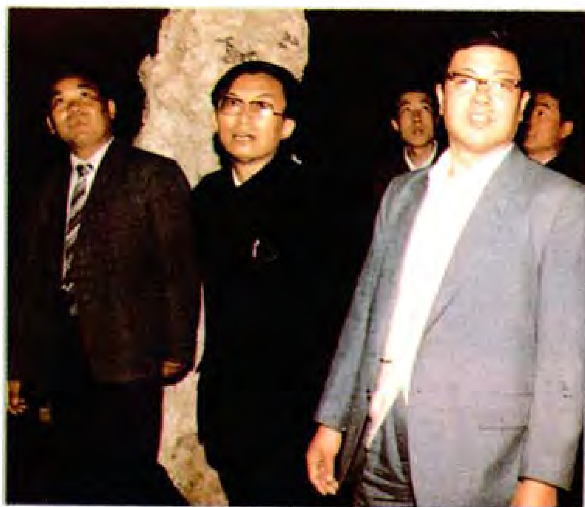
1986年5月23日中共中央书记处书记王兆国（右一）视察织金