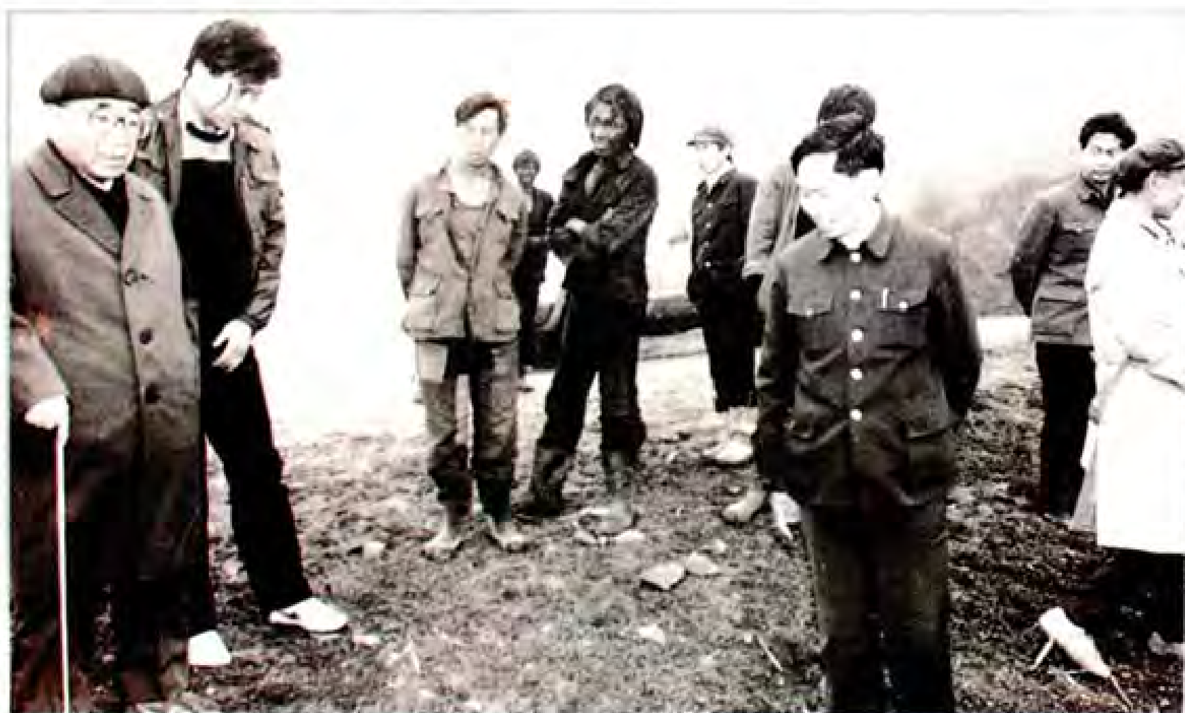
1990年4月14日全国政协副主席卢嘉锡（左一）视察织金“中国3356”造林工程