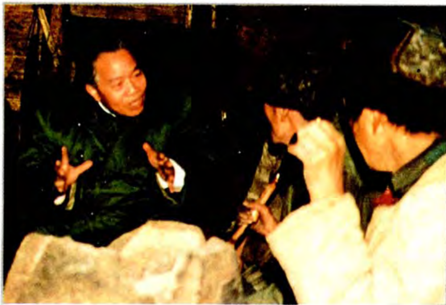
1992年贵州省省长王朝文 (左一)到织金扶贫