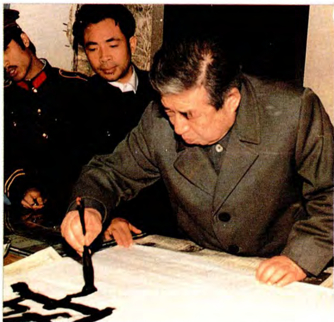
1987年3月18日全国政协副主席杨静仁视察织金