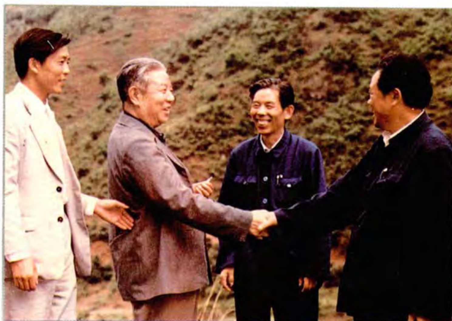
1985年5月27日中共中央书记处书记邓力群（左二）到织金视察