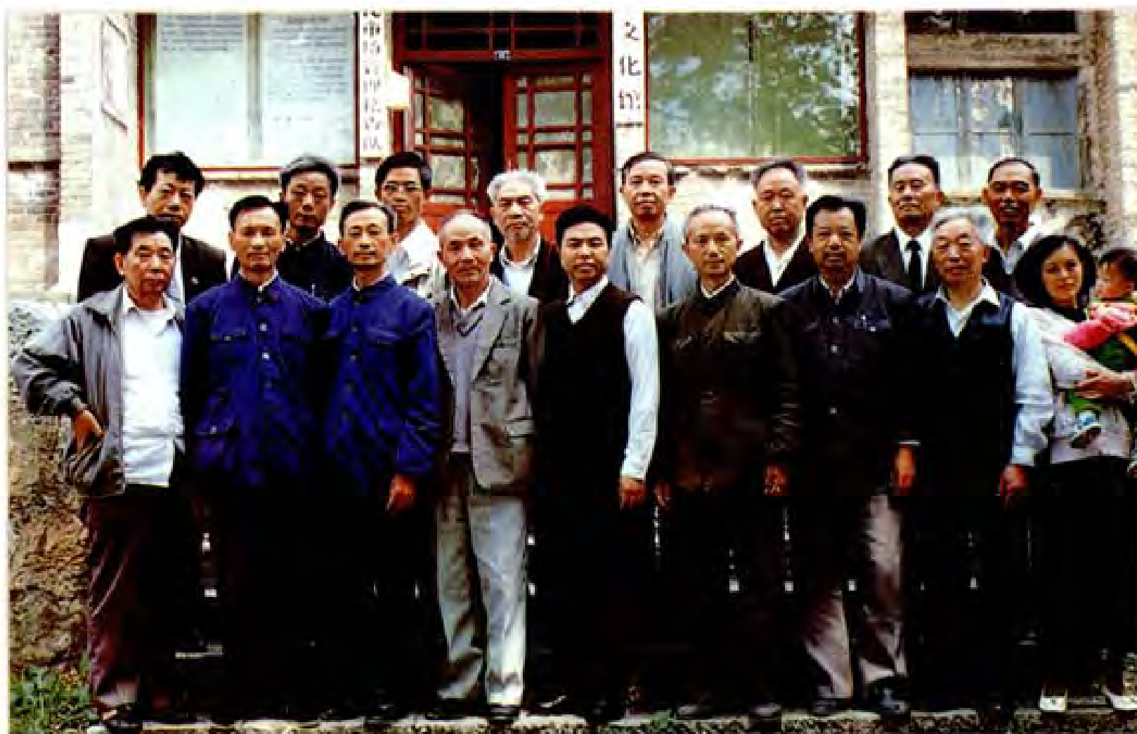
《织金县志》编纂人员