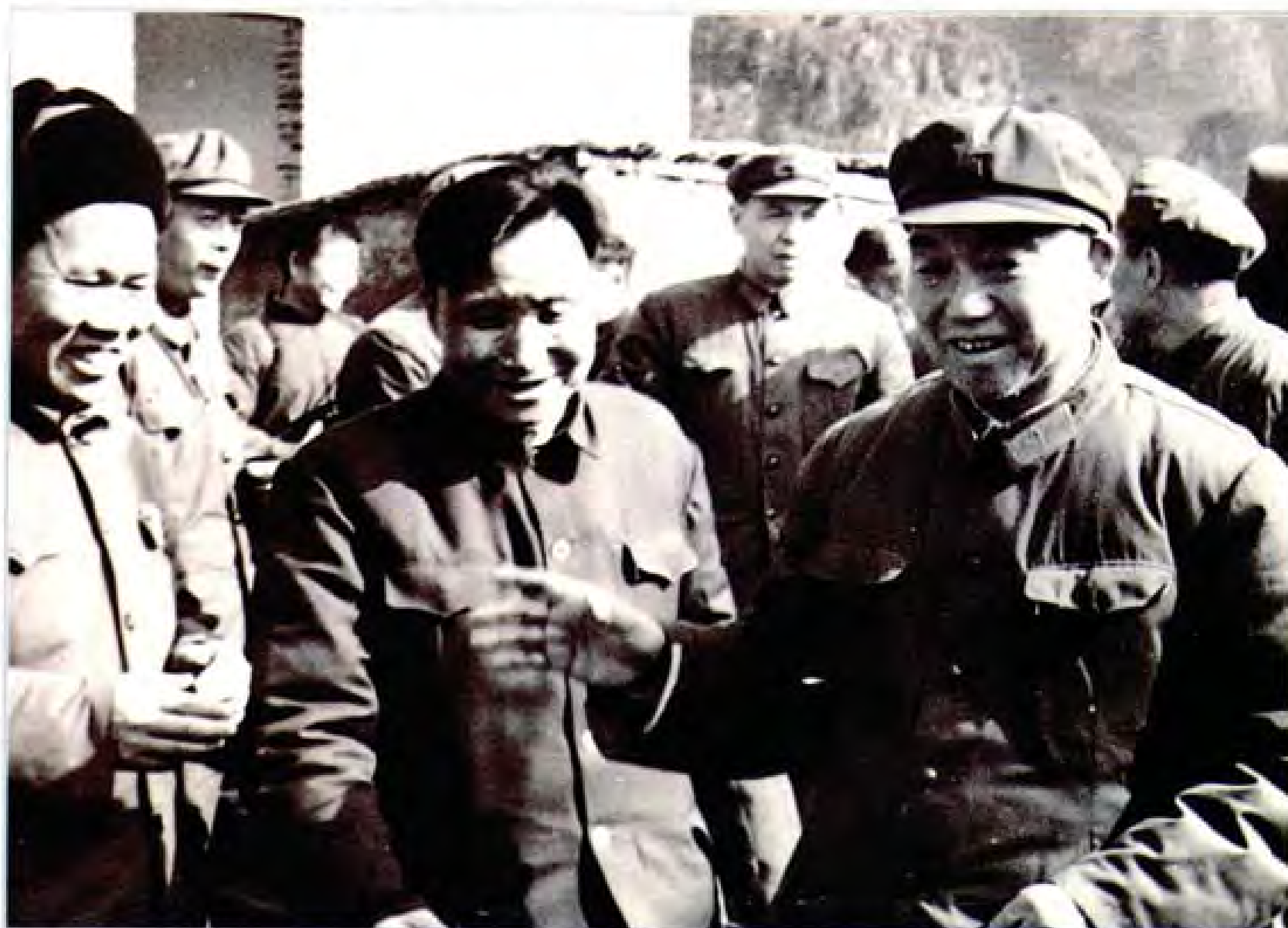
1983年1月8日中顾委常委肖克将军（右一）视察织金