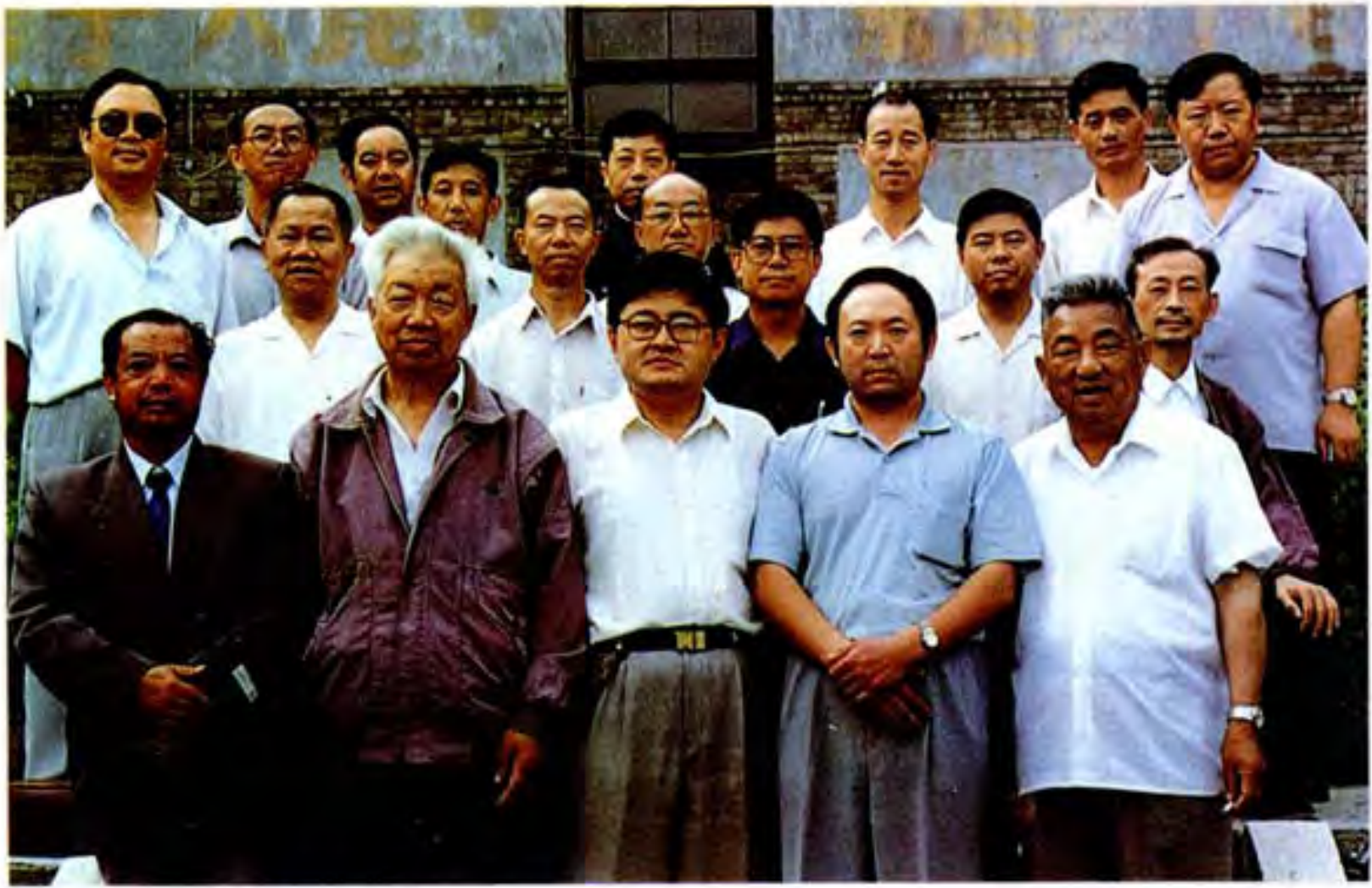
《织金县志》编纂委员会成员