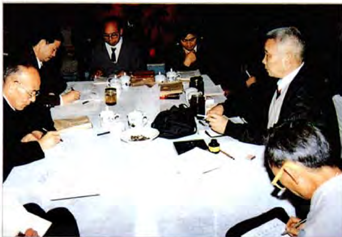
专家学者讨论 《织金县志》稿