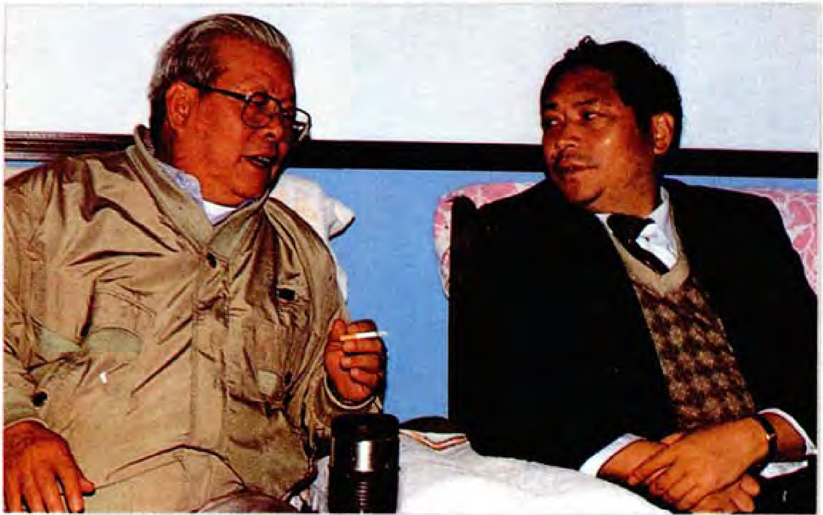
1996年4月21日全国人大副委员长李锡铭（左一）视察织金