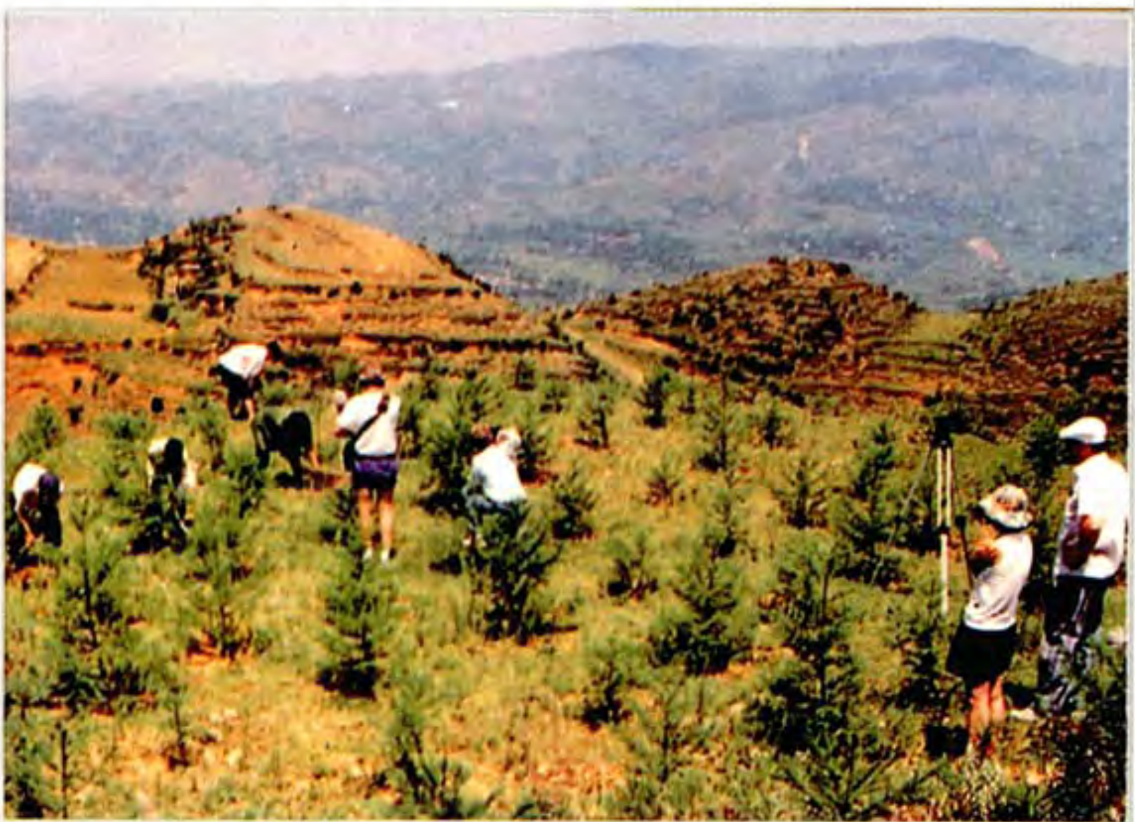
“中国 3356” 造林工程一角