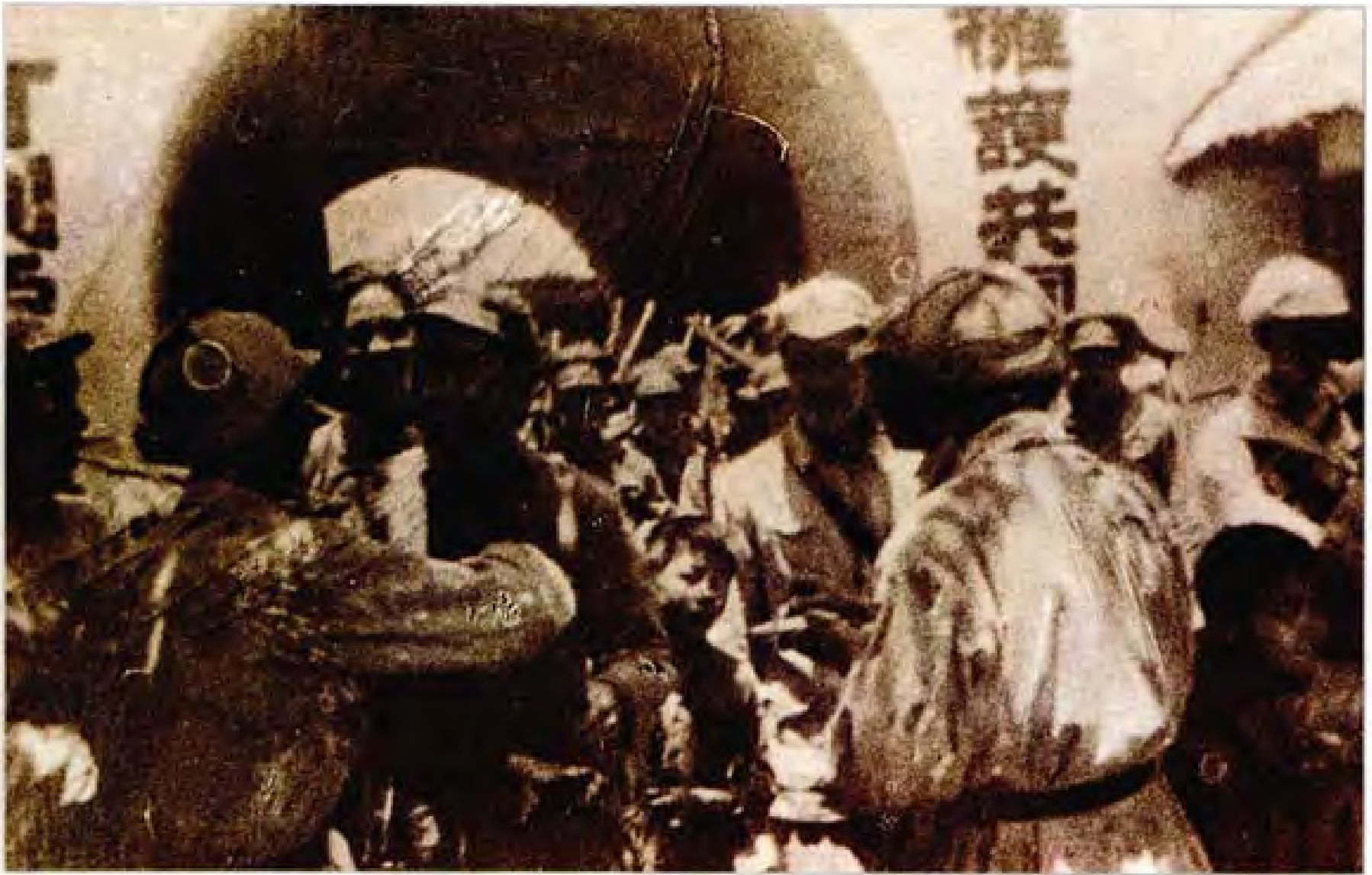
1950年1月8日人民解放军解放织金