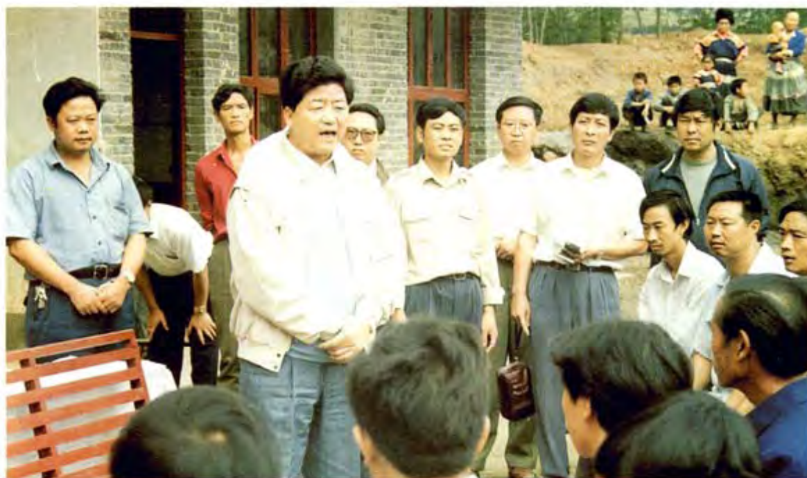
中共贵州省委书记刘方仁(前左一)1994年8月视察纳雍