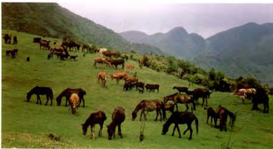
蒙岭镇坪山牧场一角