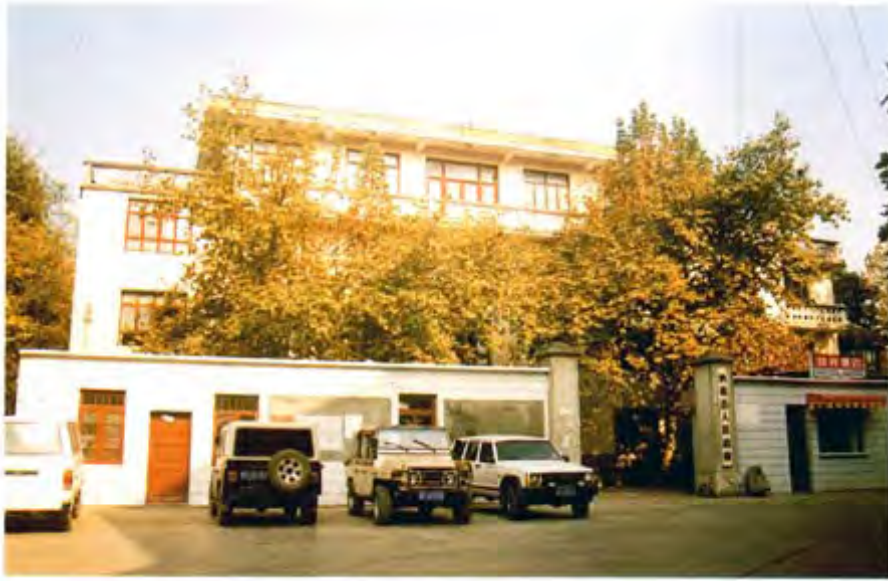
纳雍县人民政府办公楼