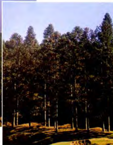
化作林场松林、杉木林