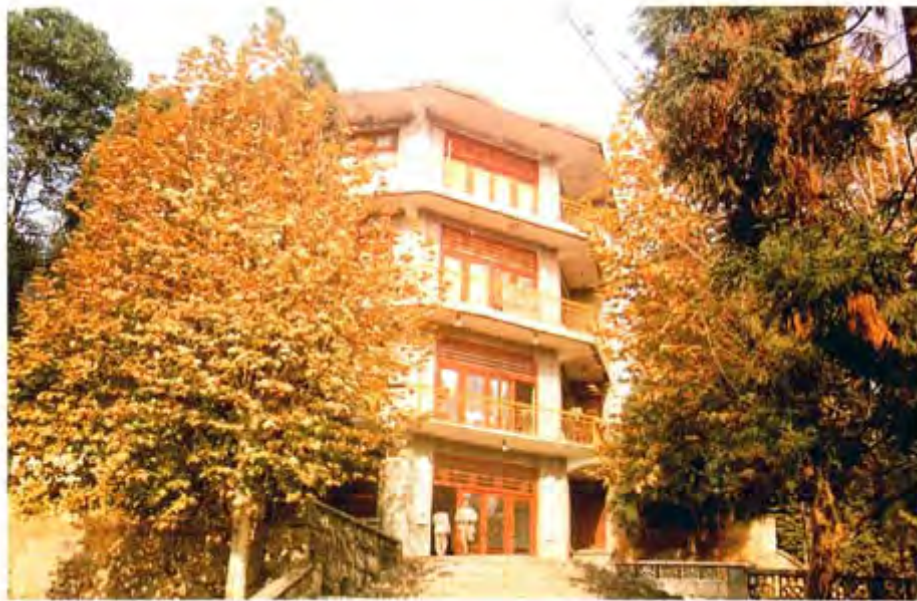
中共纳雍县委办公楼