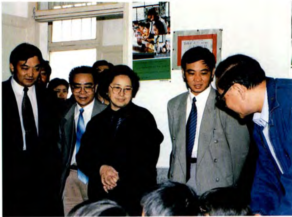
全国人大副委员会长、民革中央主席何鲁丽(前排中)视察纳雍