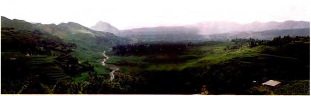
吊水岩下的梯田和梯田