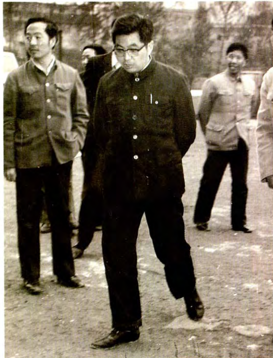
中共中央政治局常委、国家副主席 胡锦涛(右一)1986年4月任贵州省委 书记期间视察纳雍