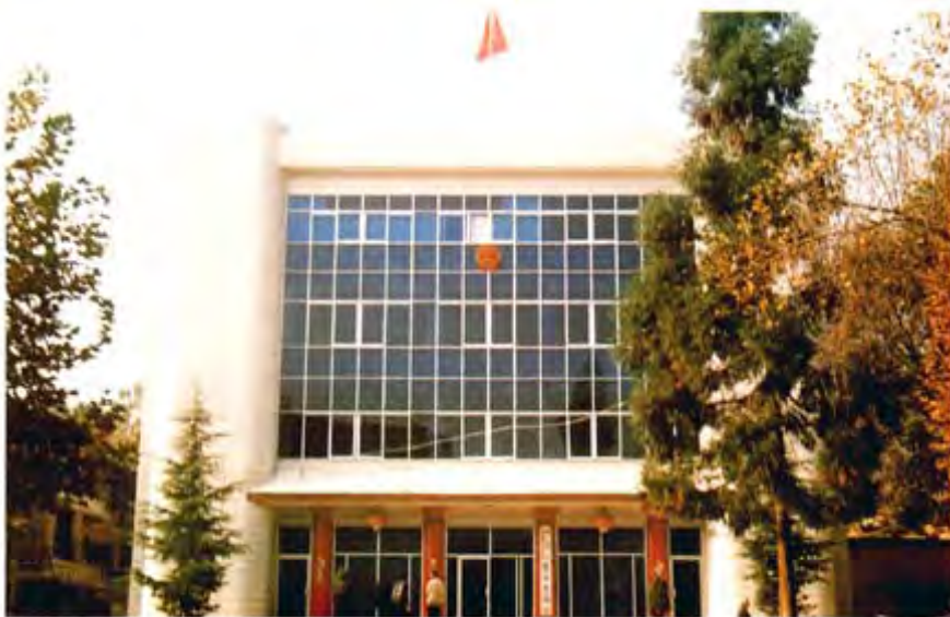
纳雍县人大常委会 办公楼