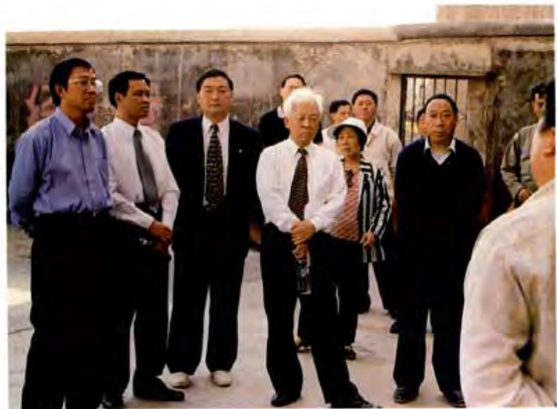
民革中央副主席周铁农(前排左二)视察纳雍