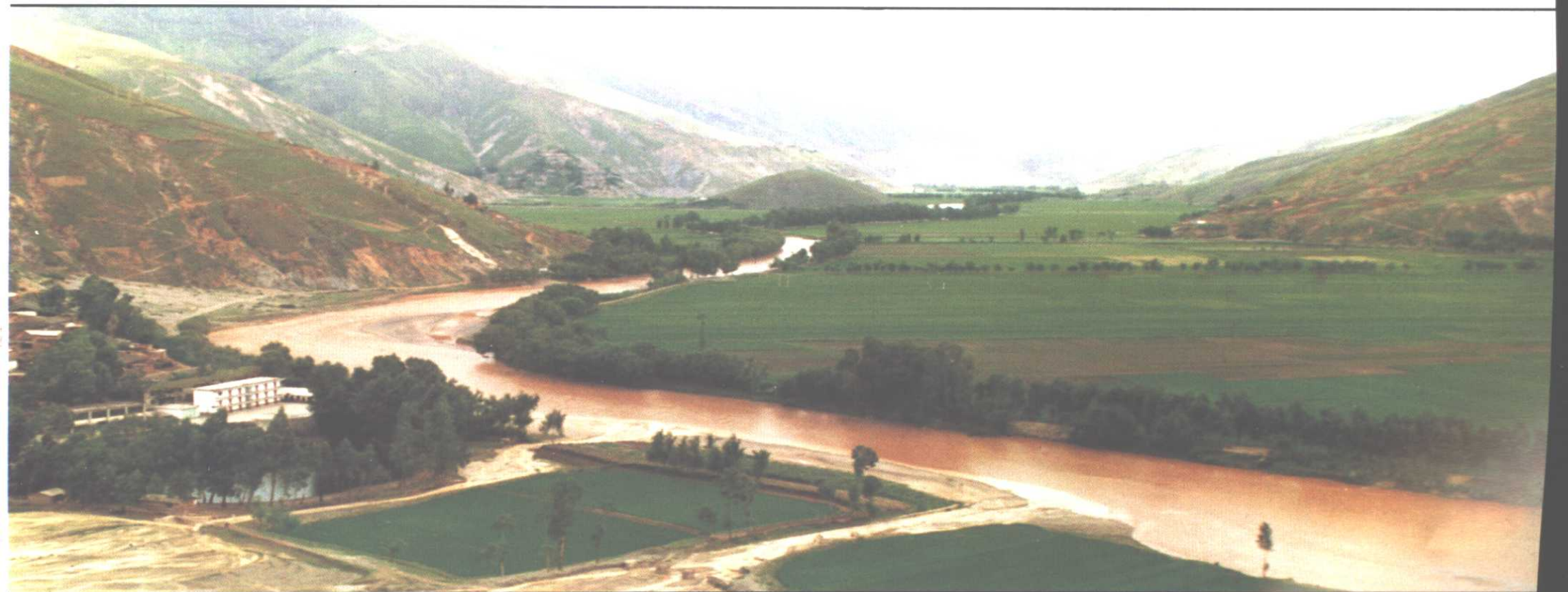
△ 干热河谷区——小江河畔