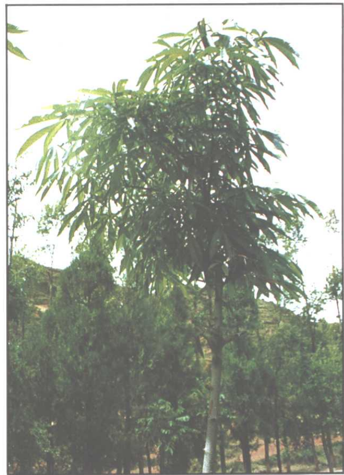
▷ 省级保护植物云南七叶树