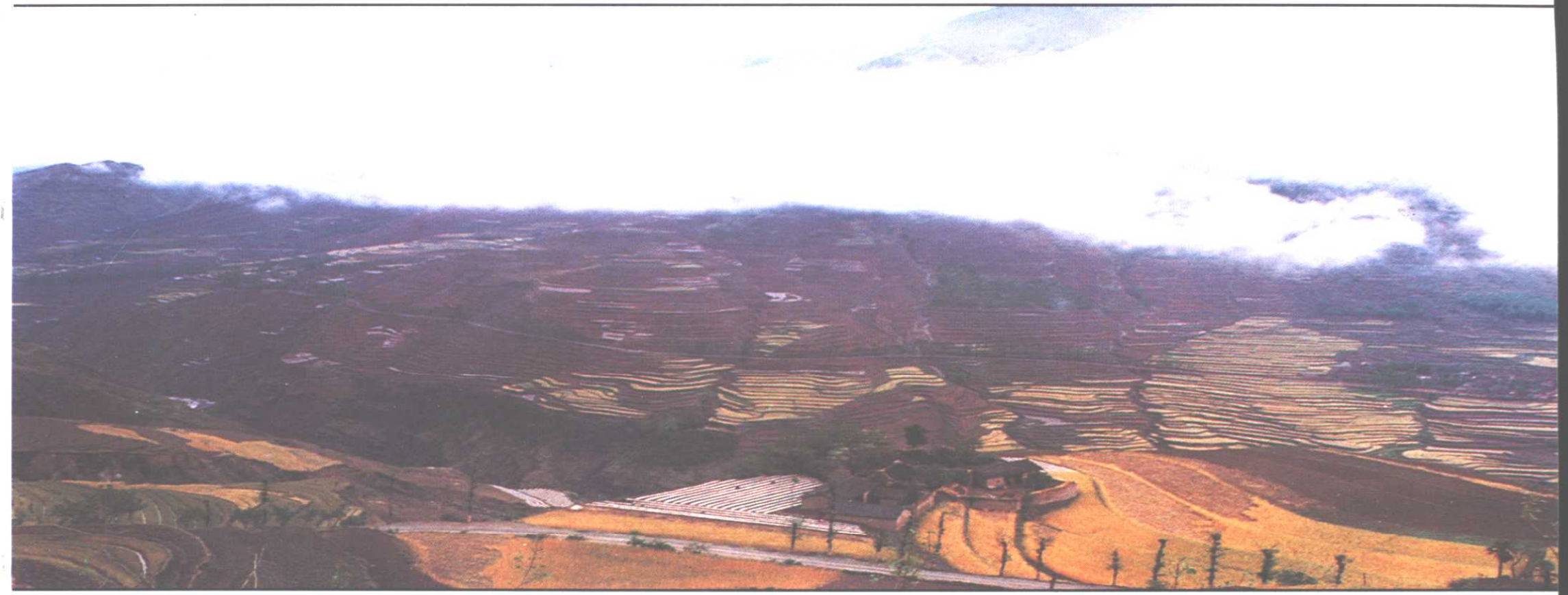
△ 高山峡谷区——晓光河沿岸