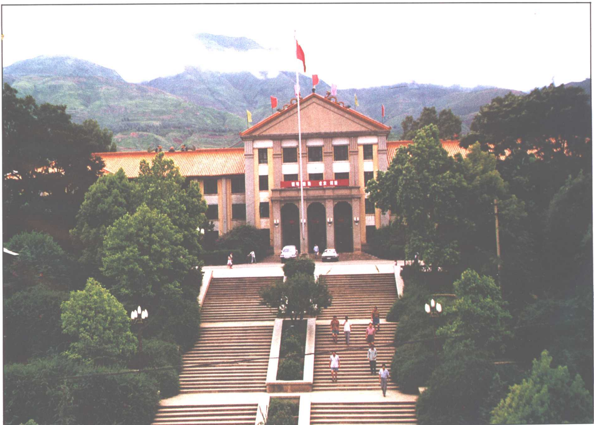
▽ 市人大、市政府、市政协办公楼