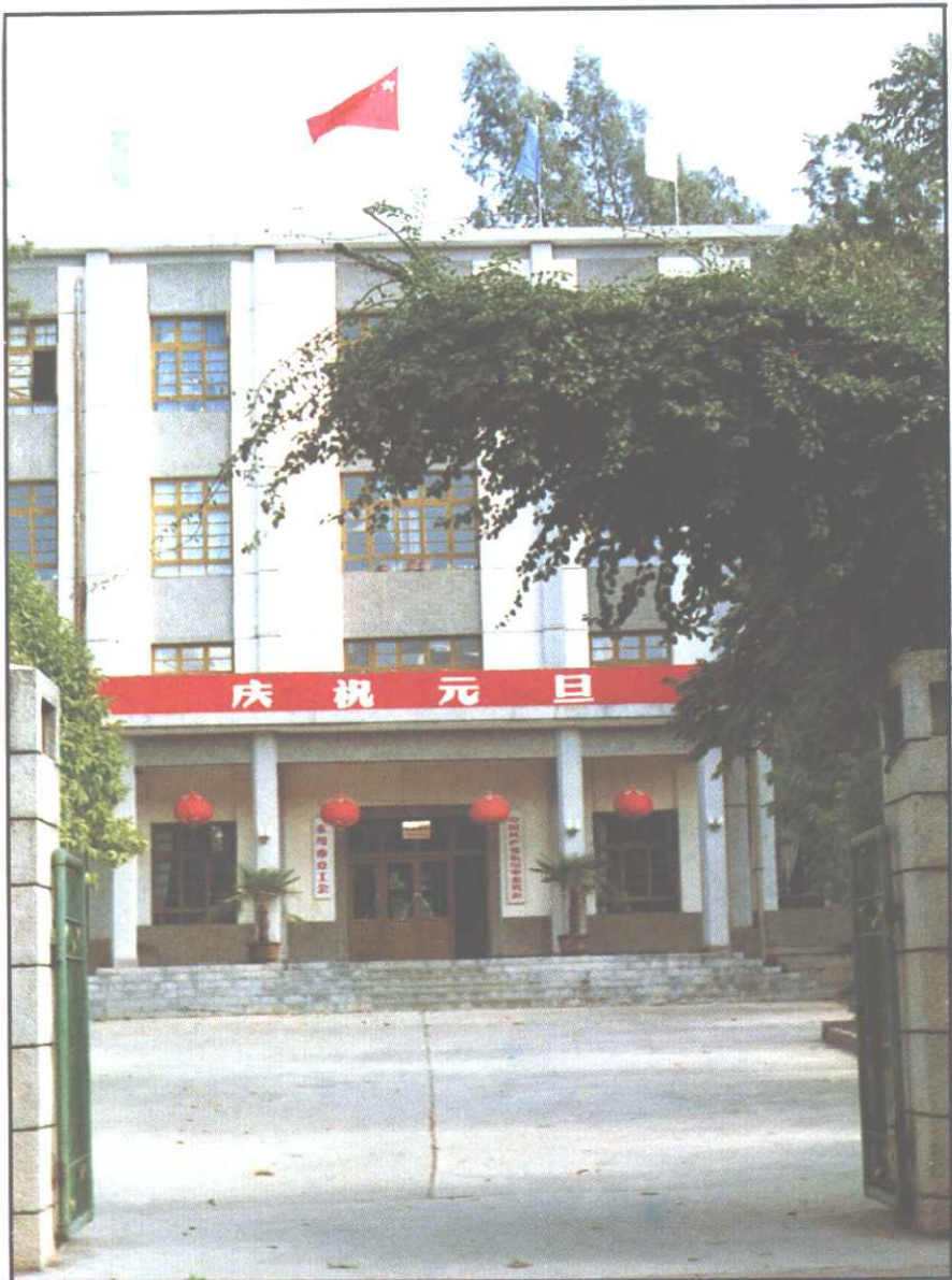
△ 中共东川市委办公楼