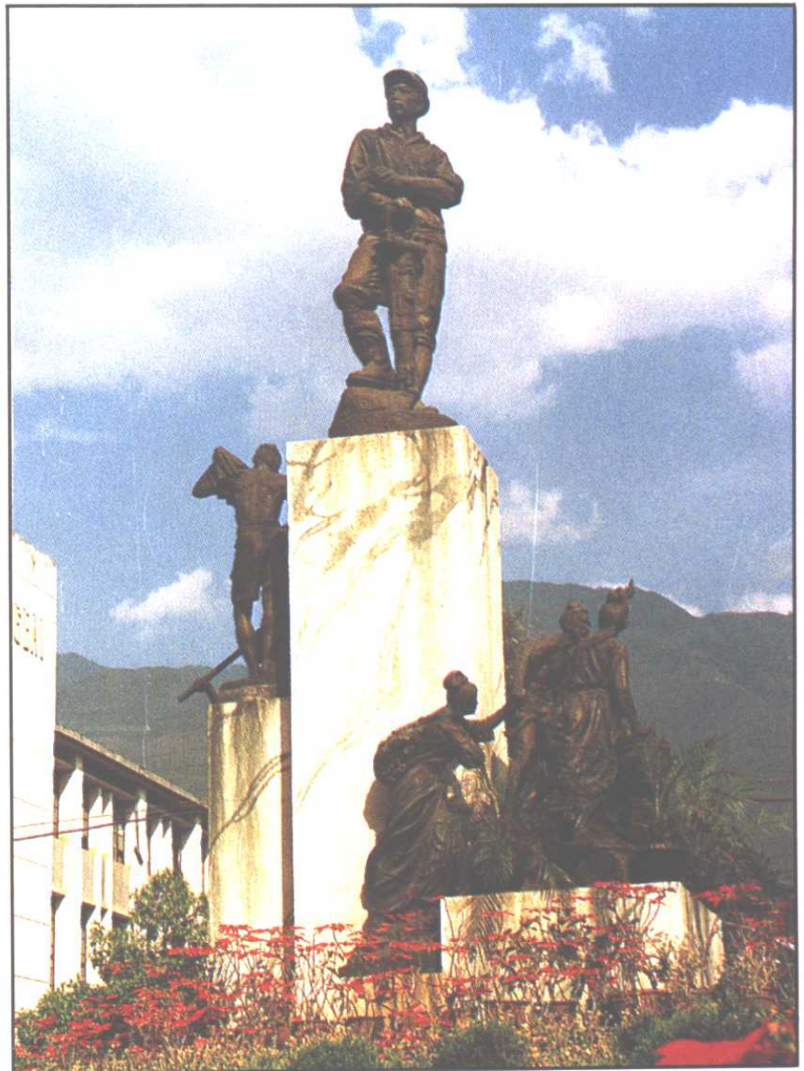
△ 矗立在城区中心的开发矿业群雕