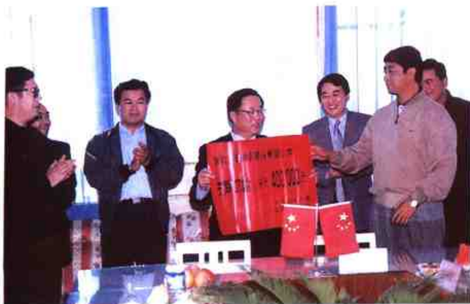
友好县(市)——山东省曲阜市捐资40万元援建希望小学