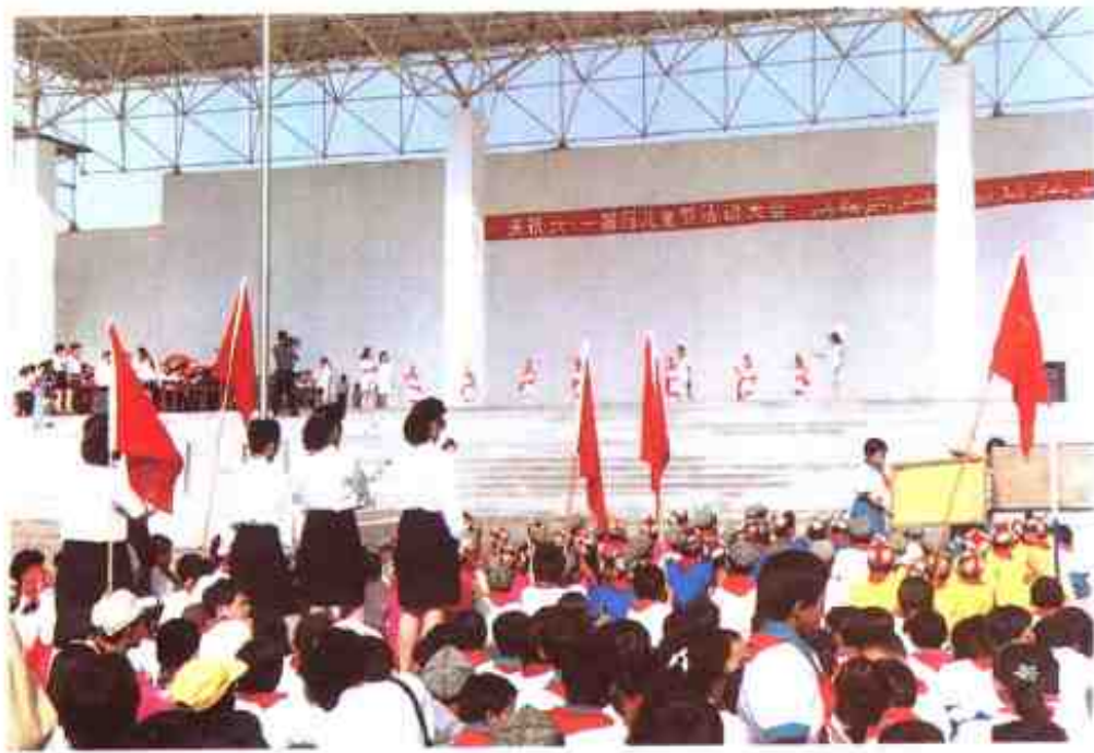
县城小学生欢度 “六·一”国际儿童节