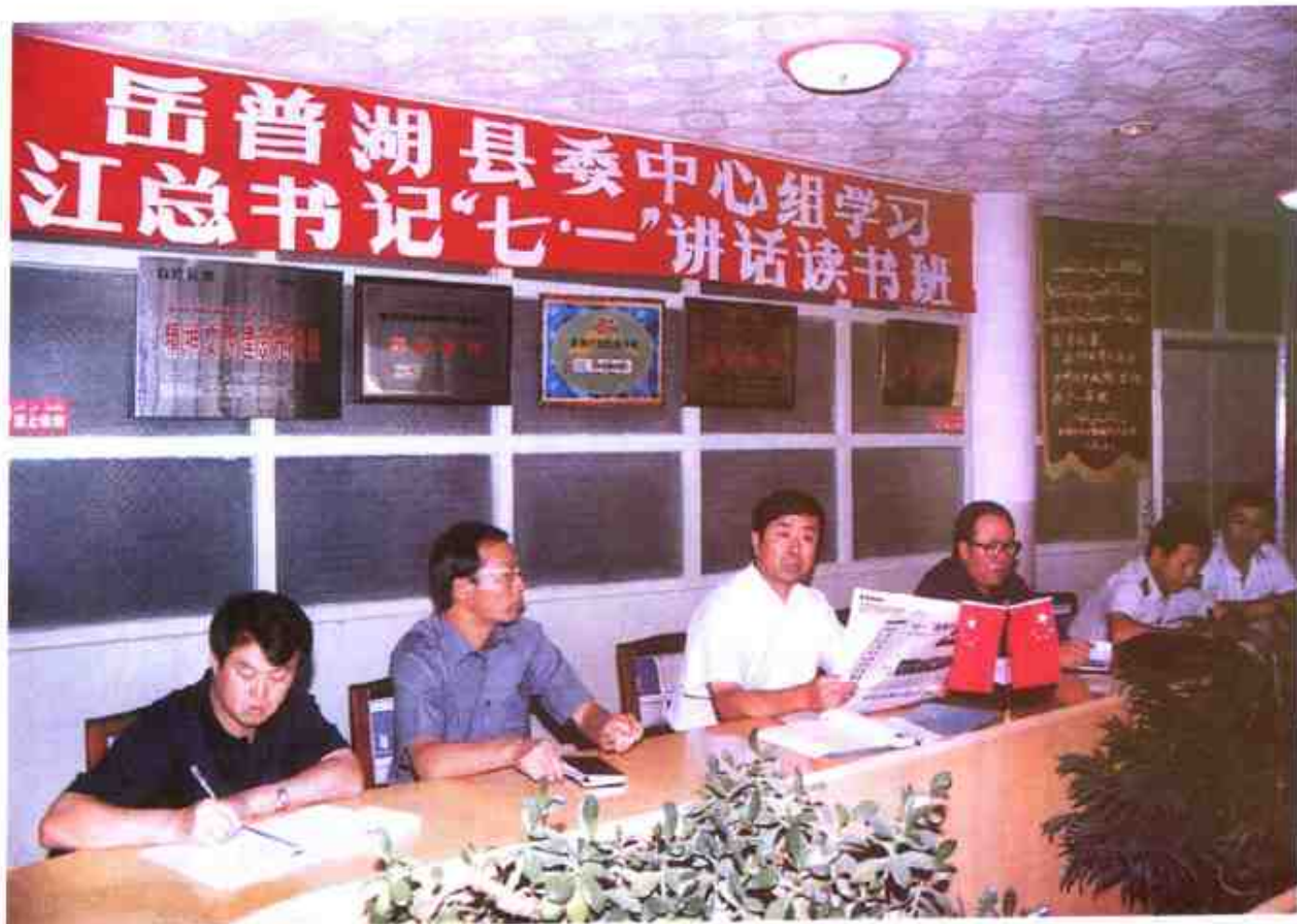
县四大班子领导带头学习