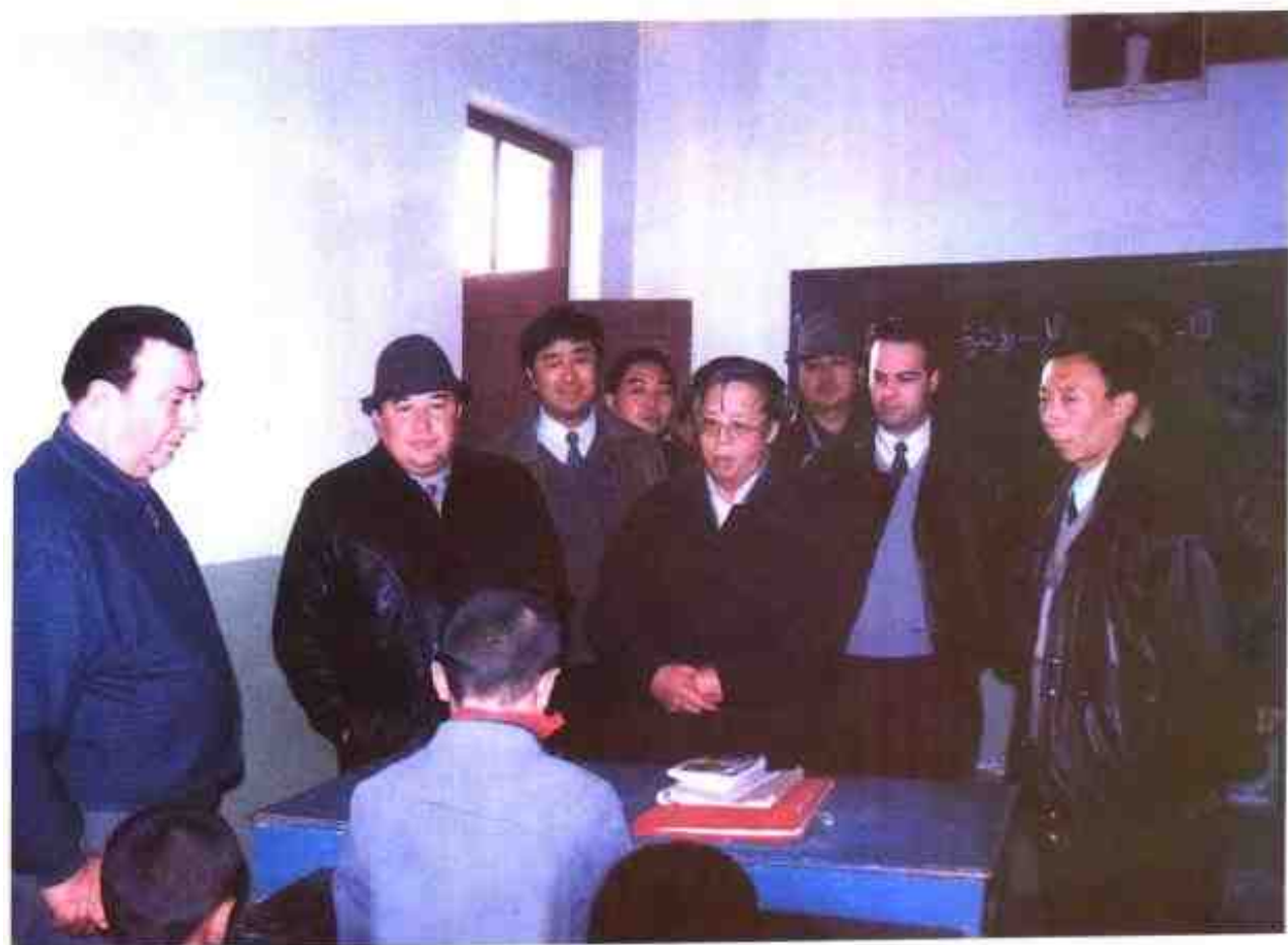
1998年12月23日,自治区副主席王怀玉(前排左三)、自治区教委主任沙地尔·哈德尔(左一)、喀什地区行署副专员买买提明·皮尔多斯(左二)考察岳普湖县教育工作