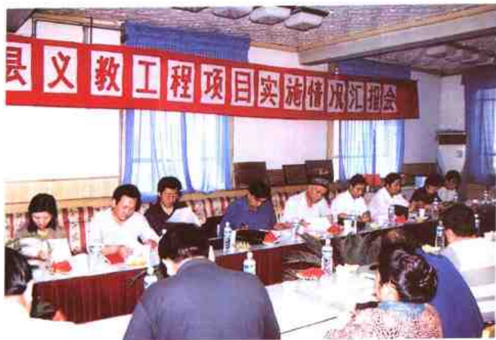
县“义教”工程项目实施情况汇报会