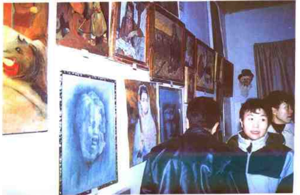
巴依阿瓦提乡中学生画展