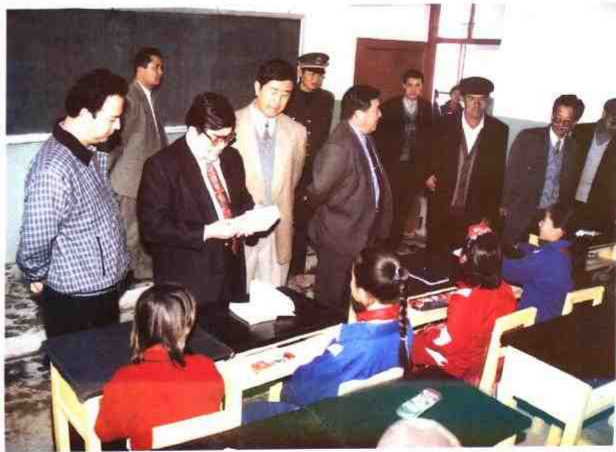
1998年10月28日,自治区副主席买买提明·扎克尔(前排左二)在岳普湖县考察教育工作