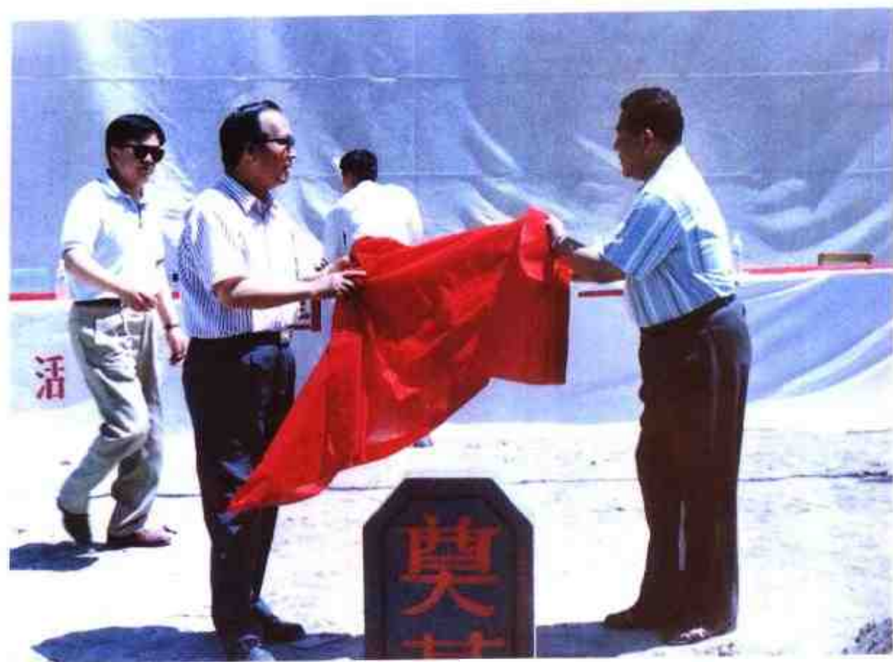
1997年6月18日,自治区副主席玉素甫·艾沙(左二)、喀什地区行署专员阿不都卡德尔·乃斯尔丁(右一)为岳普湖县一中教学楼奠基揭幕