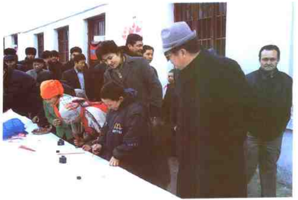
县长吾拉木江·阿不都肉苏力在乡村小学 考察校园文化