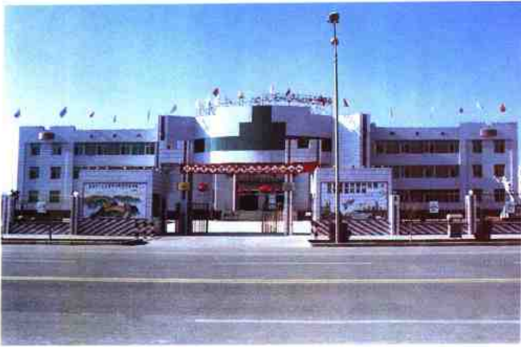
县教育培训中心大楼