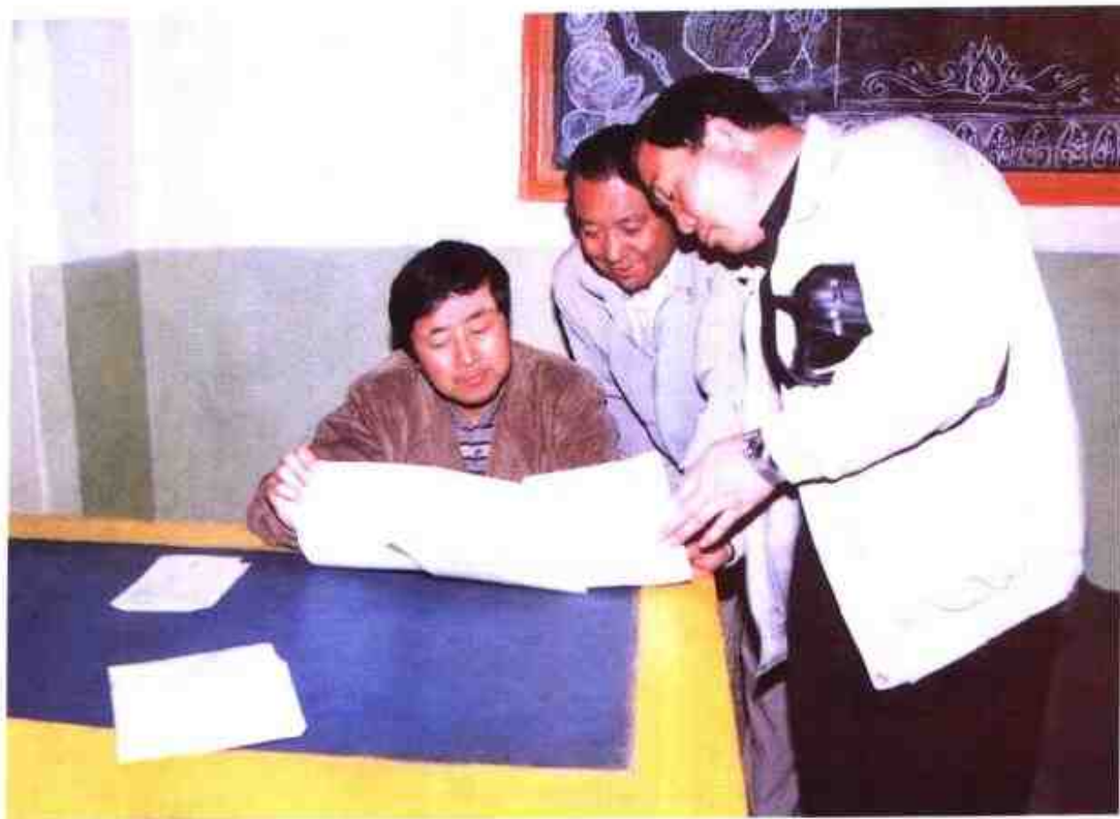
县委书记何海源考察县一中教学工作