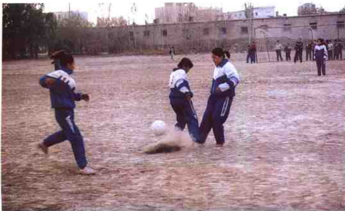
中學生女子足球賽