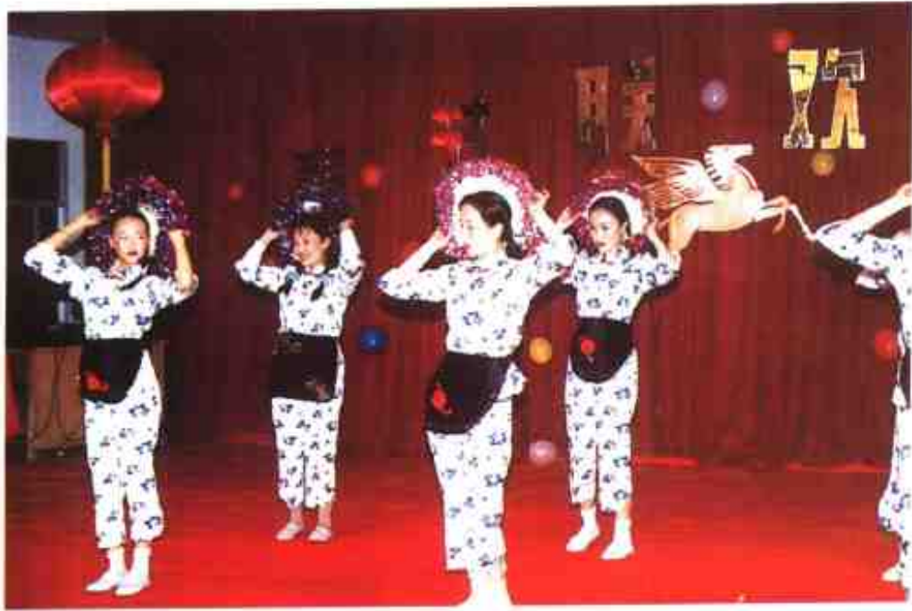
县二中学生在春节联欢晚会上表演舞蹈