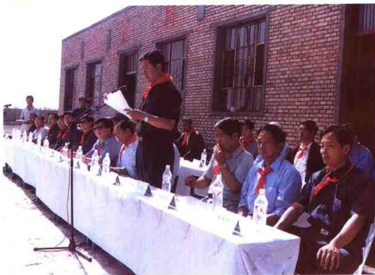
县委书记何海源在山东省曲阜市援建的希望小学竣工仪式上讲话