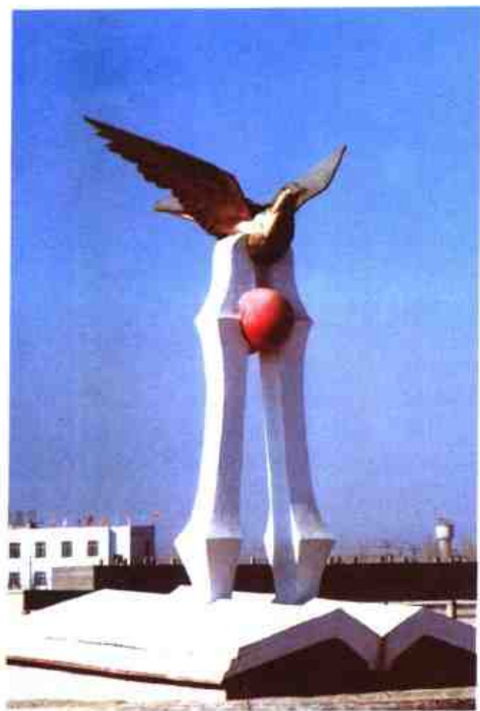
县教育广场雕塑——托起明天的太阳