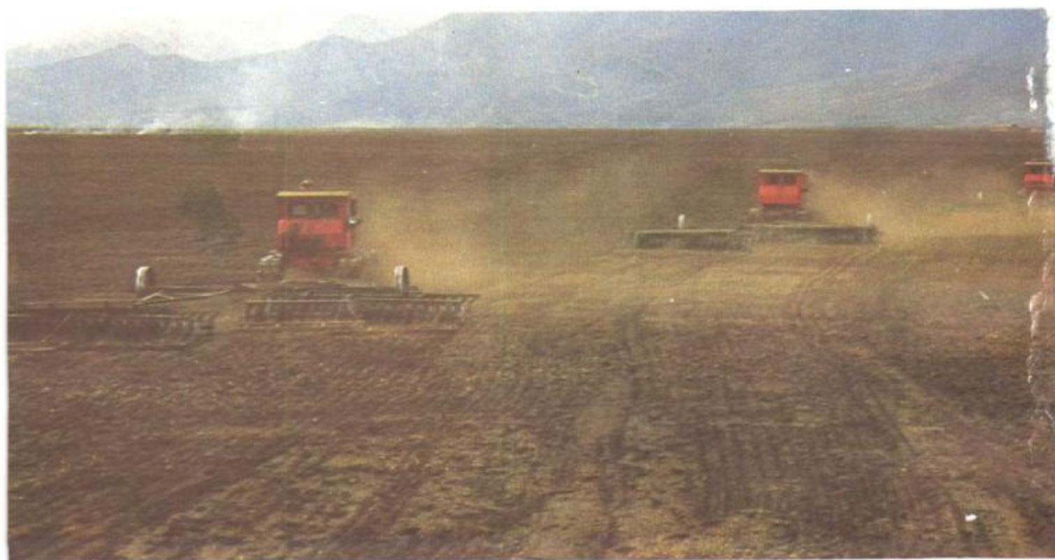
图8 东方红-75型拖拉机牵引41片轻型圆盘耙进行耙地作业