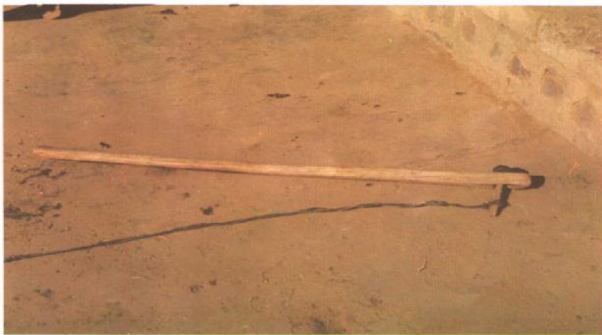
图 3 脱粒农具——连枷