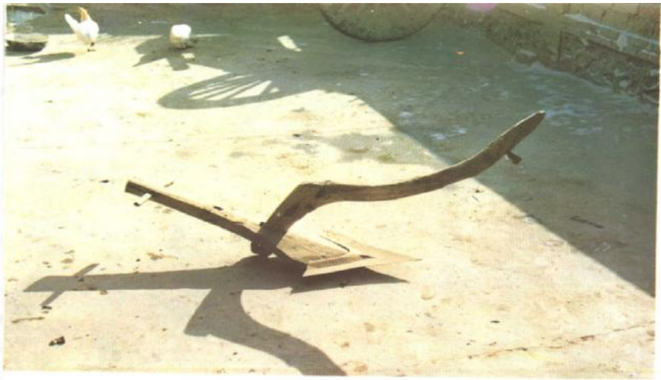
图 1 老式三角犁