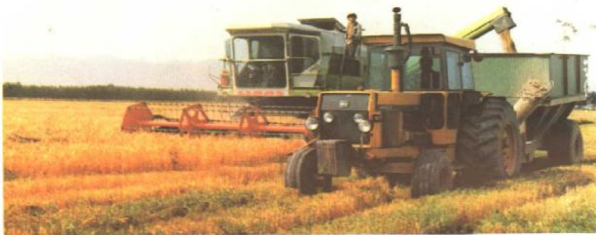
图7 东风2KB-5型自走式谷物联合收割机