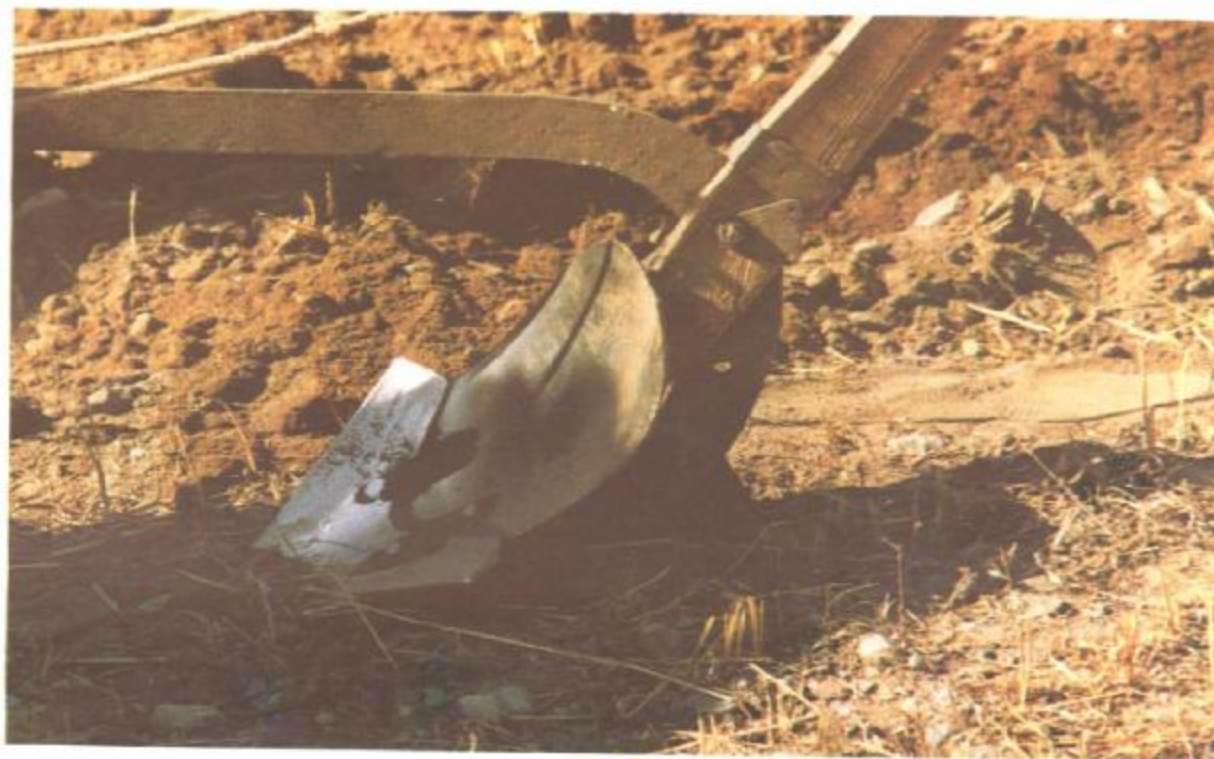
图 2 16号山地步犁