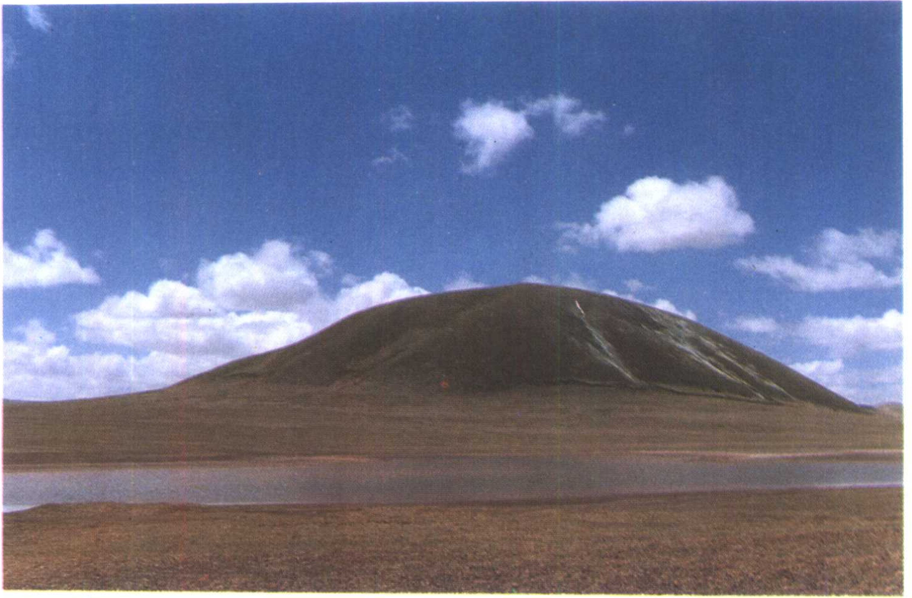
火山遺容（可可西里）