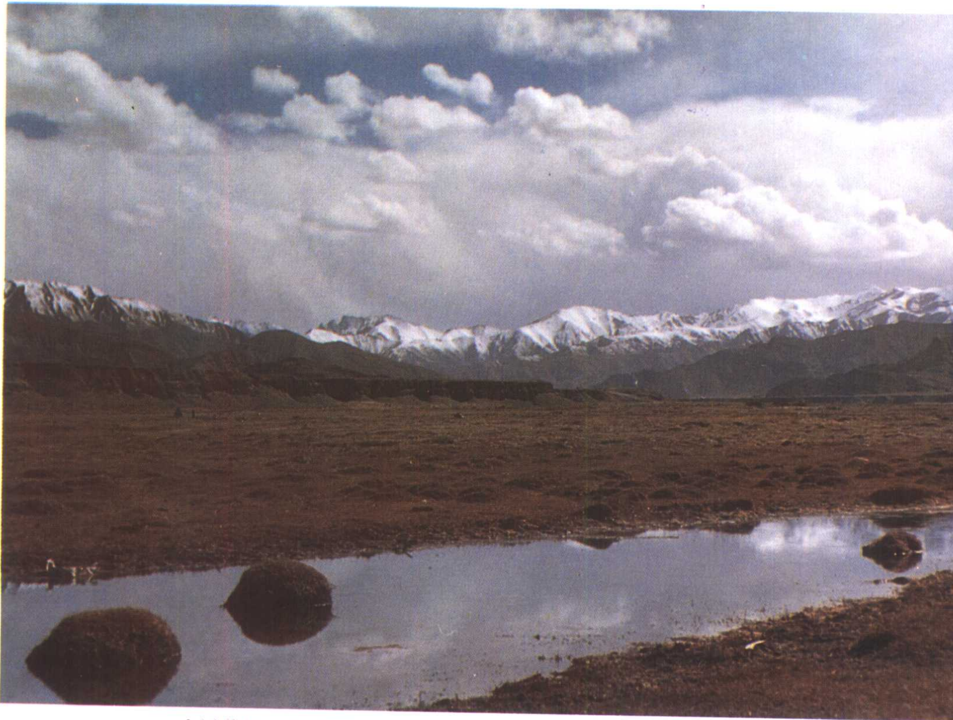
冰川草地（可可西里）