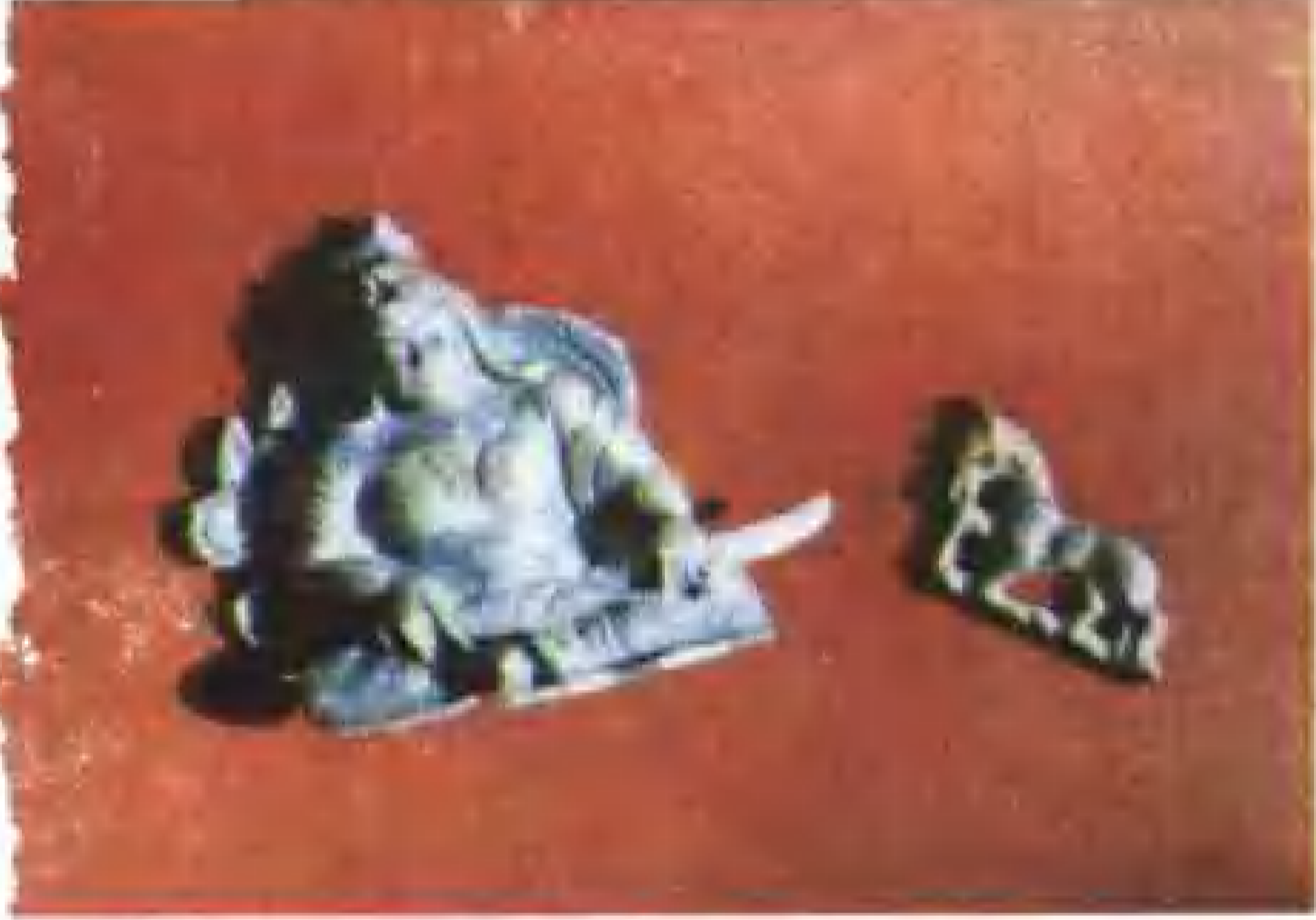
海努克古城出土文物