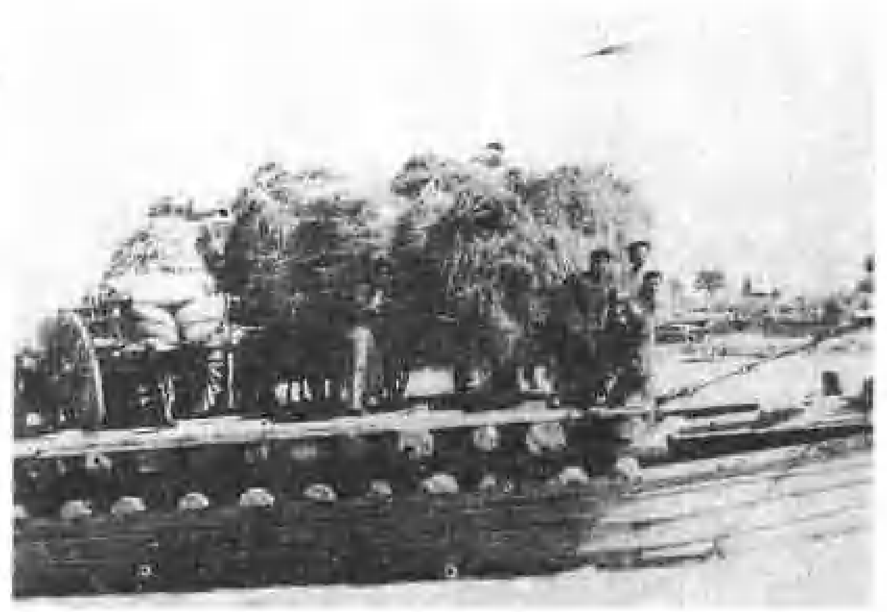
昔日伊犁河摆渡船（1949年）