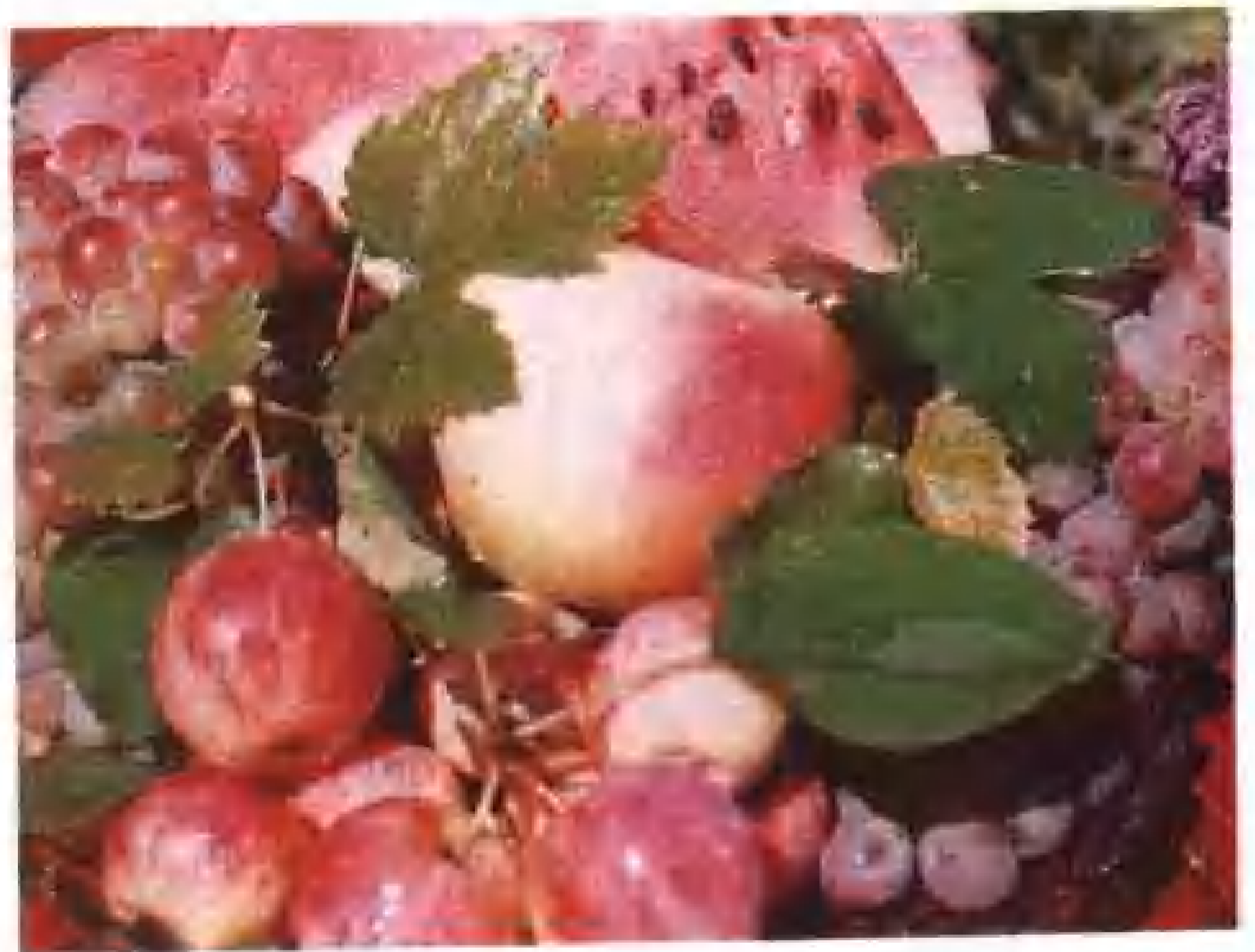
驰名伊犁的察布查尔瓜果