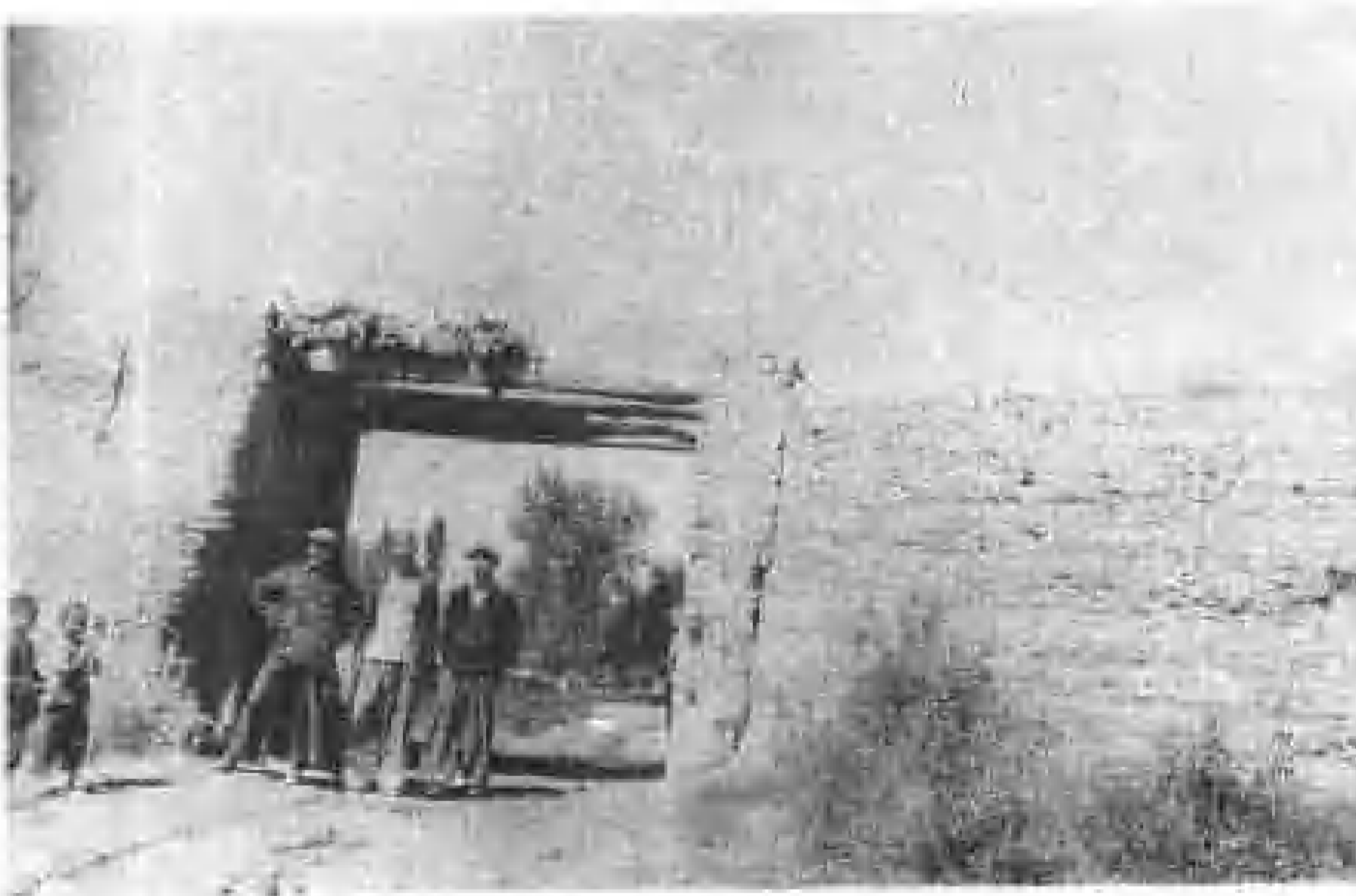
依拉齐牛录昔日城墙北大门