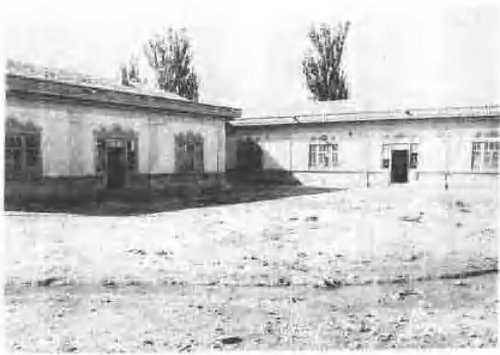
1938年建国民党河南省党部