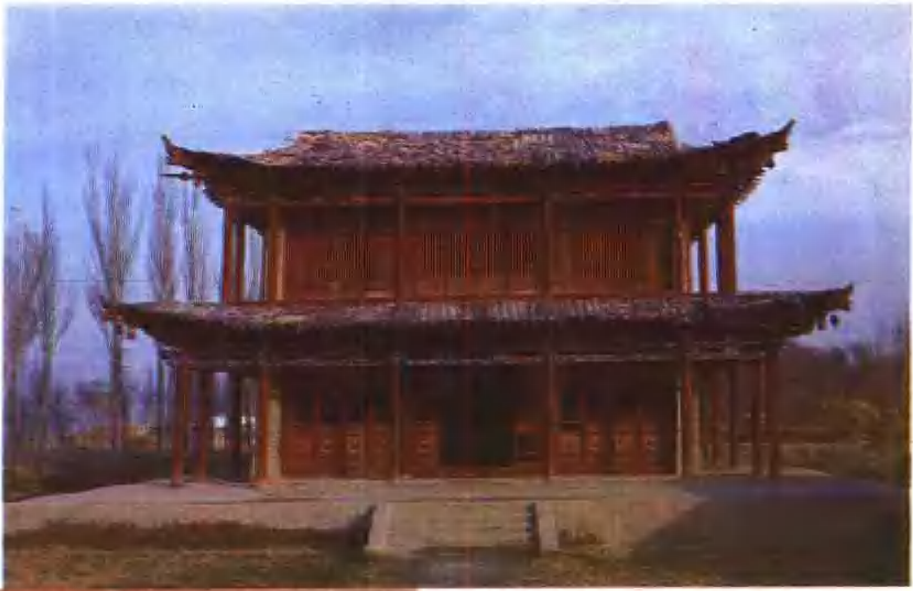
孙扎齐牛录锡伯喇嘛苏木遗址