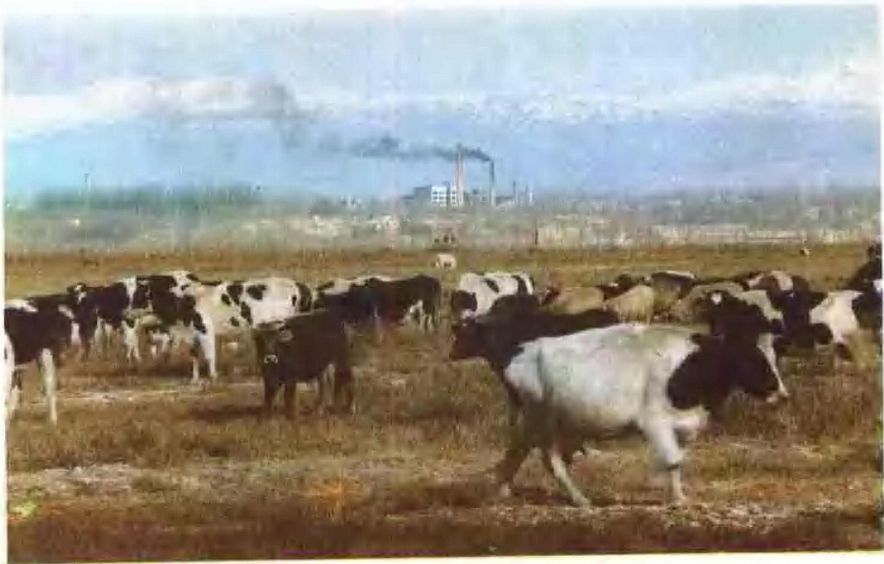
木图斯托博黑白花牛