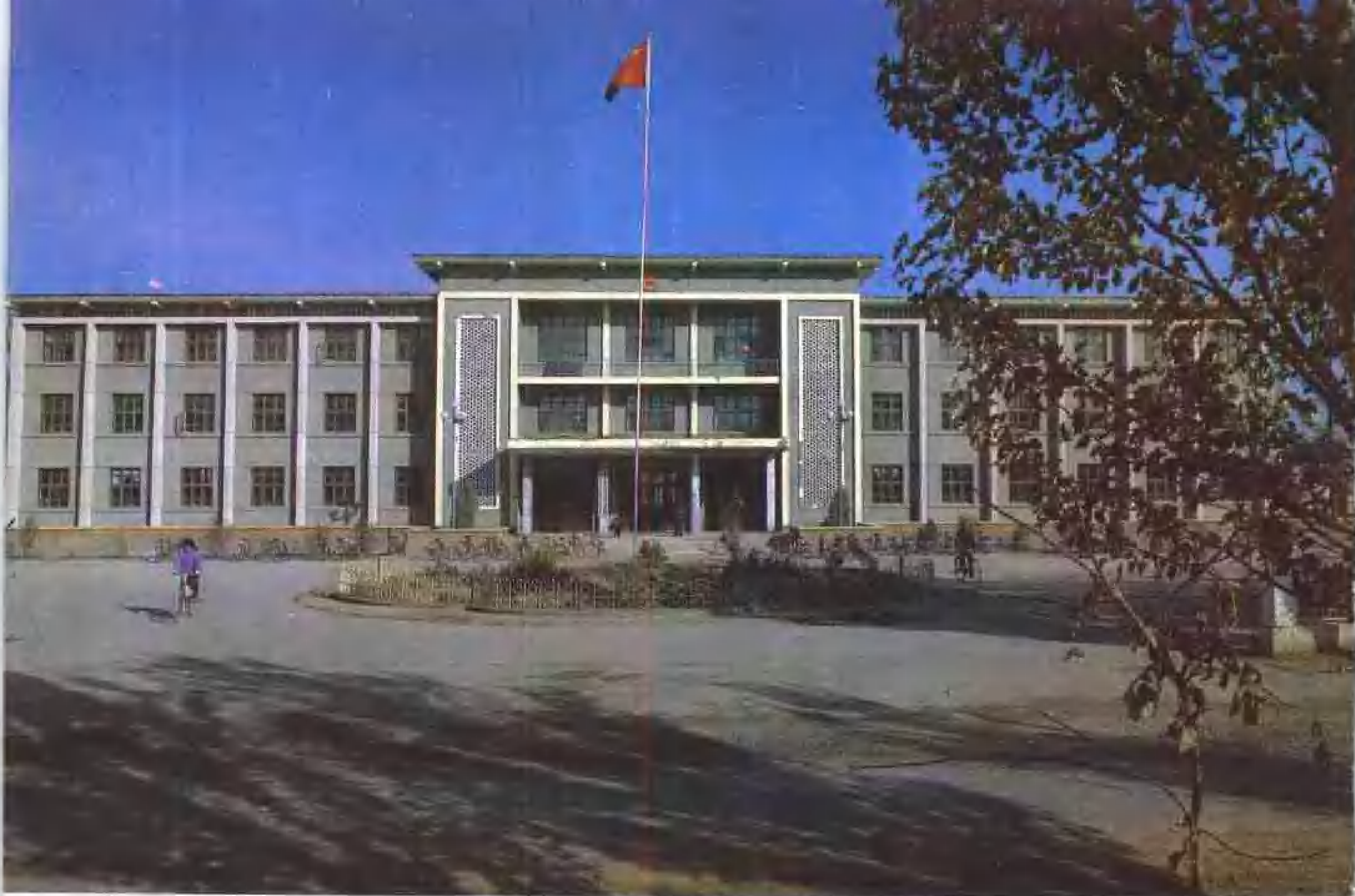
县人民政府办公楼