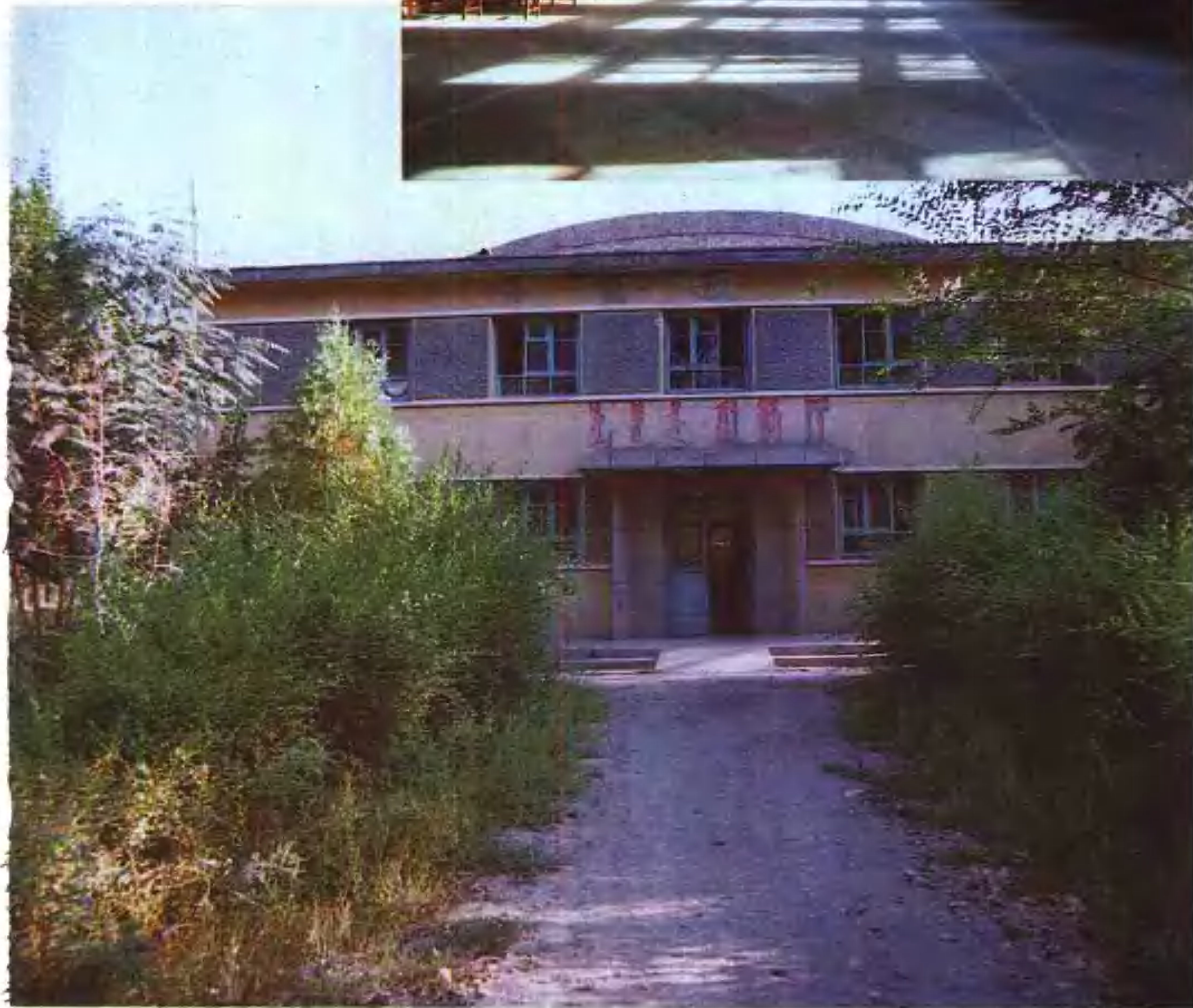
察布查尔素有“射箭之乡”的美称，射箭是锡伯人民喜爱和擅长的传统体育项目之一。图为察布查尔射箭厅外景。