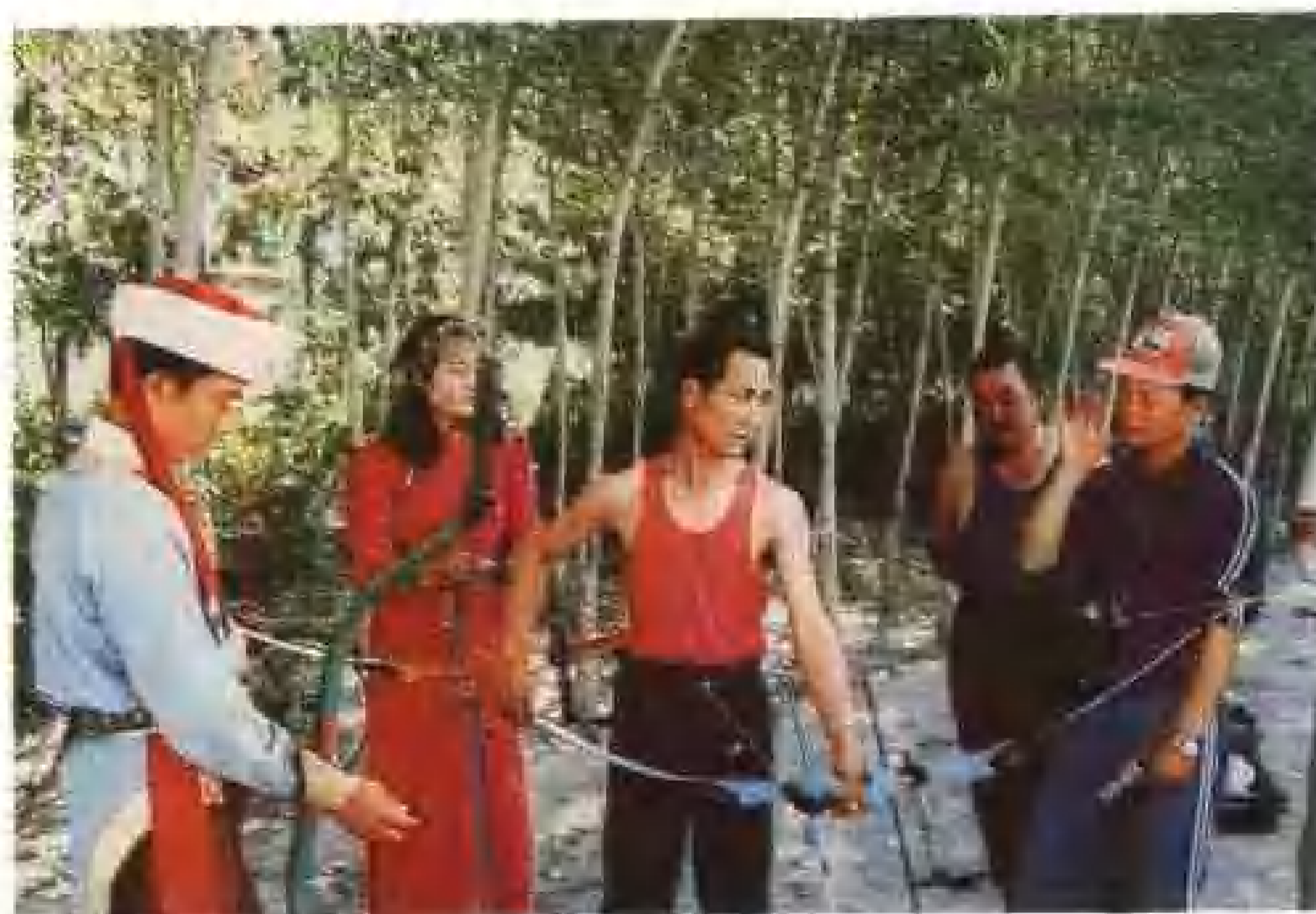
察布查尔县射箭队