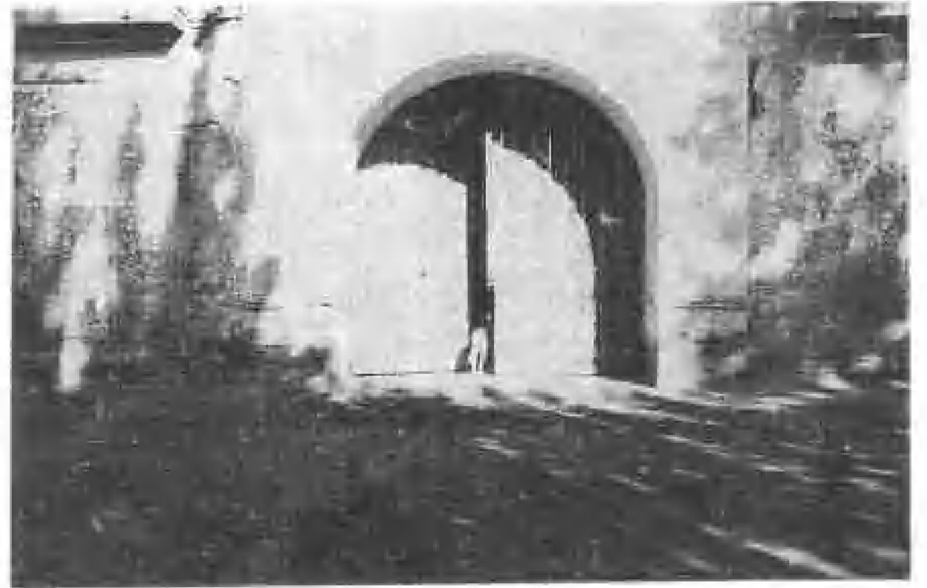
民国期河南省公安局大门（1938年）