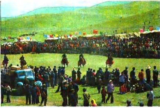
△一年一度的赛马会 ▷榨油厂车间一角 ▽一九七三年出土的铜牦牛