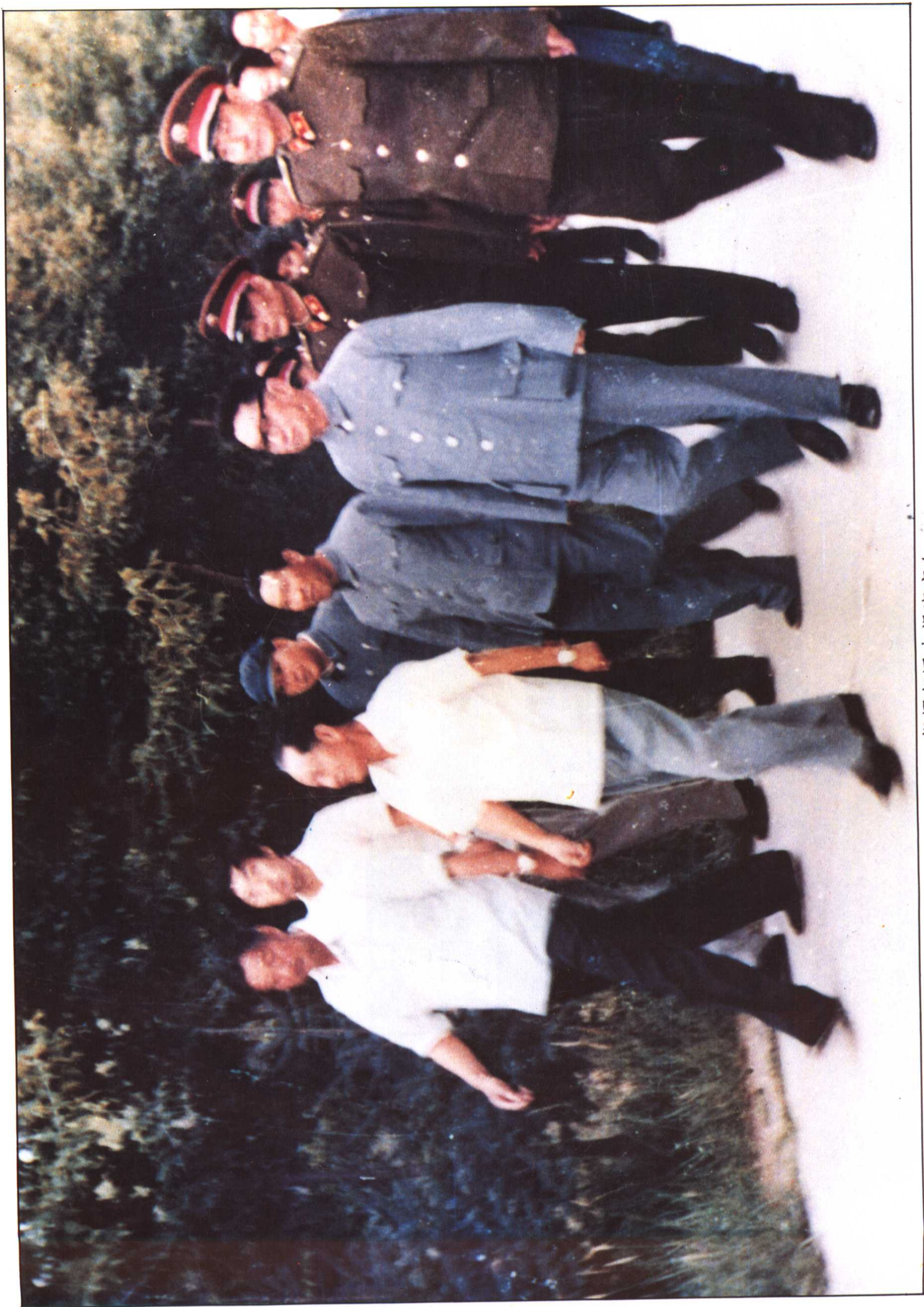
胡耀邦同志视察高台