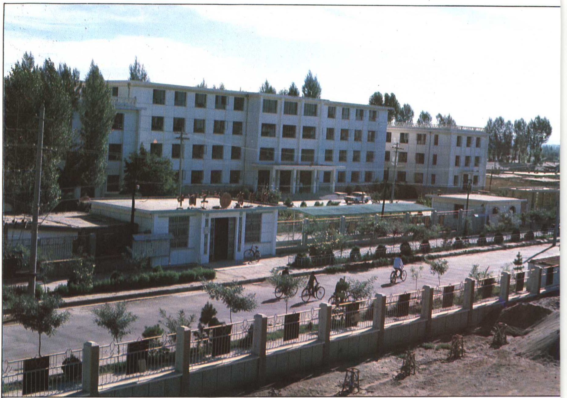
县委、人大、政府、政协驻地